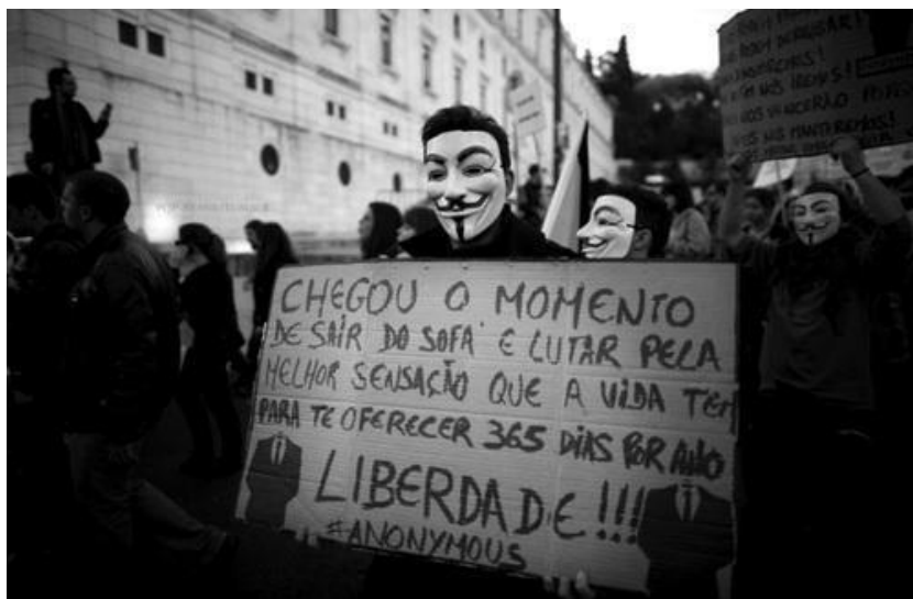
Figura 6 - Manifestante em junho de 2013

É importante frisar que o grupo não tem uma liderança que se expõem, ou seja, conhecida. Como o próprio nome diz, seus integrantes são pessoas desconhecidas e a única marca que representa o grupo é a máscara inspirada em Guy Fawkes 84 .