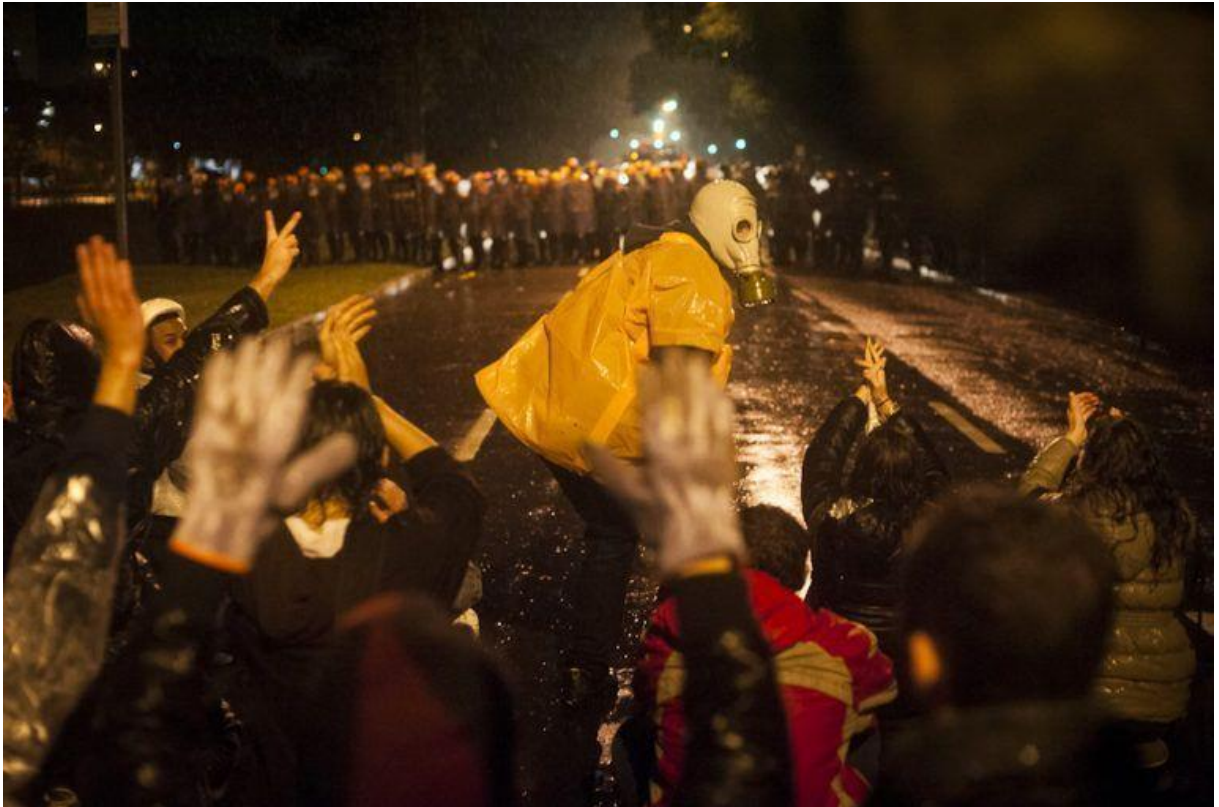
Figura 3 – Manifestantes diante de uma barreira policial em Porto Alegre.