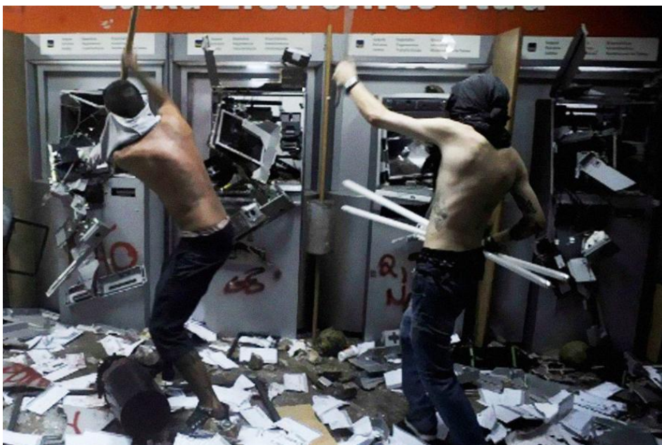
Figura 7 - Integrantes dos Black Blocs que destruíram uma agência do Banco Itaú durante as manifestações de Junho de 2013

Apesar de serem conhecidos pela violência, em algumas manifestações, os Black Blocs já renunciaram dela estrategicamente. Evangelista (2015) nos dá dois exemplos desse recuo: em Washington, em 2000, preferiram apenas proteger os manifestantes da polícia; em Praga, em 2002, eles protegeram uma viatura policial dos anarcocomunistas, pois entenderam que estavam em menor número.