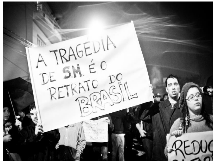
Figura 4 – Cartaz em referência ao incêndio da Boate Kiss

Neste período, as manifestações nas ruas pelo Brasil já eram amplas, até que, no dia 20 do mesmo mês, chega a Santa Maria. O Bloco de Lutas e o DCE chamaram os dois atos que aconteceriam na cidade, a partir do que se organiza a primeira manifestação que tinha duas pautas principais: barrar o aumento da passagem e pedidos de justiça pelo incêndio na Boate Kiss.