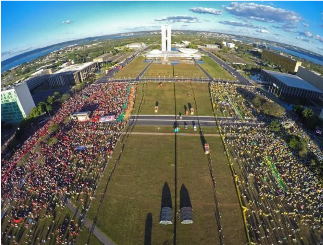
Figura 11 - Divisão dos manifestantes em Brasília