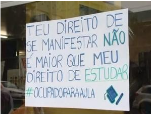
Figura 12 - Movimento “Ocupar para não Ocupar”

fim, essa gestão entrou com uma ação judicial contra a reitoria da universidade e pediu a reintegração de posse dos prédios, conseguindo, assim, acabar com a ocupação. Ela contrariou a votação de uma das maiores assembleias estudantis que já ocorreu na UFSM, em que a ampla maioria decidiu pela permanência das ocupações. Ou seja, a Libertas desrespeitou essa decisão e a pluralidade dentro do movimento. No ano de 2017, tentaram reeleição, mas sem sucesso.