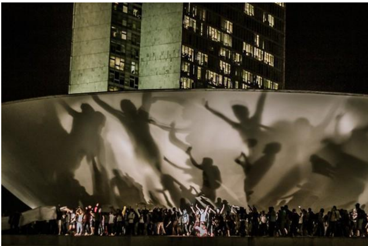
Figura 2 – Manifestantes ocupando a marquise do Congresso Nacional

Houve enfrentamento policial contra os manifestantes que tentaram ocupar o Congresso Nacional. Sobre a ocupação do monumento, Santos (2015, p. 21) 58 descreve: “a sensação era de que os manifestantes que estavam em Brasília, no monumento que representa os eleitos pelo povo, isto é, o Congresso Nacional, eram os porta-vozes diretos dos manifestantes do país inteiro”.