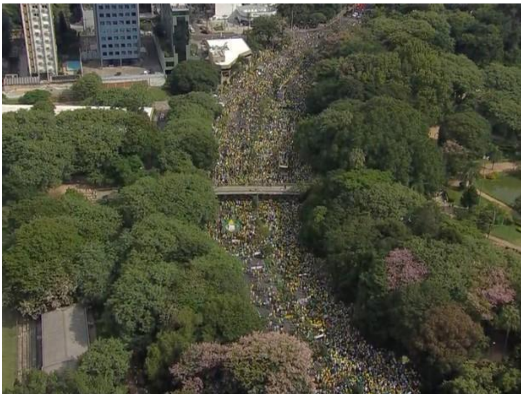
Figura 10 - Vista aérea da concentração no Parcão