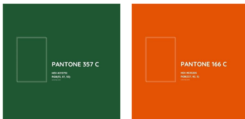
Figura 1 - Cores utilizadas