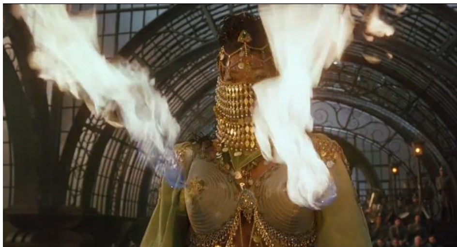
Figura 6 - West utiliza alguns aparatos de Gordon na tentativa de salvar o presidente e seus amigos