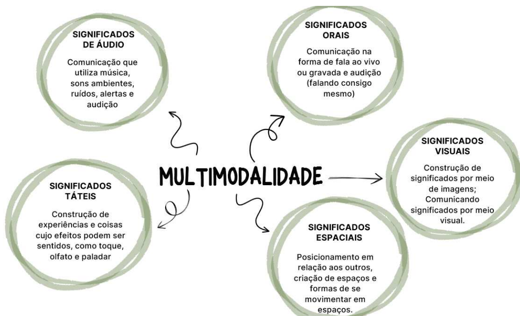
Figura 3 – Modos de significação na teoria multimodal de representação e comunicação