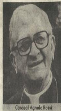
Cardeal Agnelo Rossi

Dom Agnelo disse que apoiava integralmente o cardeal-arcebispo do Rio de Ja-