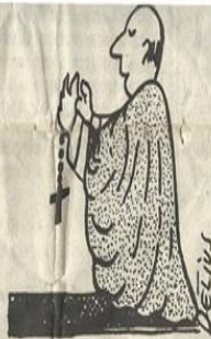
A pregação de Boff

Embora não desejando criar polémicas, não podemos deixar de fazer enérgico reparo à pregação apresentada pelo notório Frei Leonardo Boff na Missa das 18 hs, na Igreja do Sagrado Coração de Jesus, em Petrópolis, no último dia 29 de Junho. O Sr. Boff em razão do Dia de São Pedro e São Paulo, não considerando a verdade histórica, nos trouxe aos fiéis os dois Santos como representantes de tendências opostas dentro da Igreja, no 19 Concílio de Jerusalém (49-50) o primeiro um tradicional, e o segundo, um "progressista", fato que, segundo ele, dava conta da natural existência de correntes diversas e, por que não, de uma suposta falha, um erro de São Pedro. Com tal argumento justificava e de forma sutil uma fragilidade na liderança do Chefe da Igreja, quem sabe, visando o Santo Padre João Paulo II. Logo a seguir, seguindo a mesma linha de raciocínio, sua afirmação de que to-