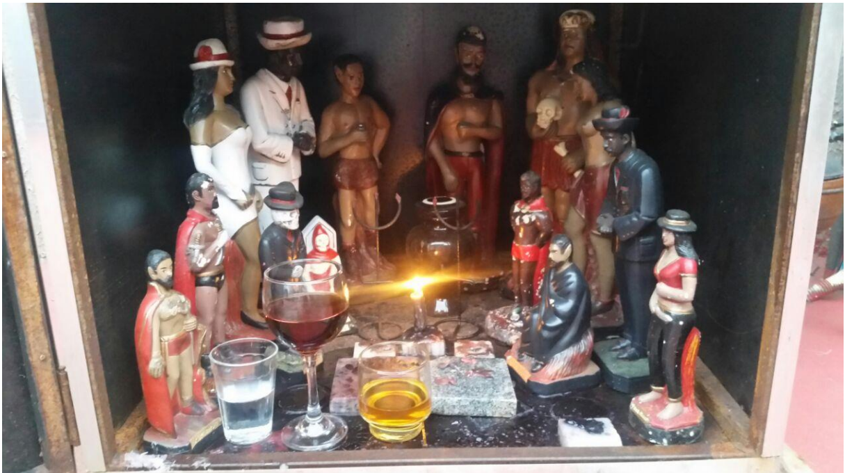
Figura 1 – Tronqueira do terreiro de Umbanda “Caboclo Giramundo e Mestre Zé Pilintra”

Andando por um bairro simples residencial, logo se chega a uma parte que parece ser o final do bairro, onde termina o asfalto e começam ruas de paralelepípedos. Virando na penúltima rua de paralelepípedos, chego ao que pareceria ser mais uma das muitas casas populares do bairro, não fosse por um elemento, discreto, mas de presença: a tronqueira, ou cangira; a casa de exu. Caixinha de madeira pequenina, do lado do portão de ferro, com imagens dos exus que atendem na linha da esquerda do terreiro. Imagens da pomba gira, dos exus, e da figura principal da presente pesquisa: Seu Zé Pilintra. Estas dividem o pequeno espaço com velas e bebidas: o marafo (cachaça) o champanhe e o whisky para as pombagiras e os exus.