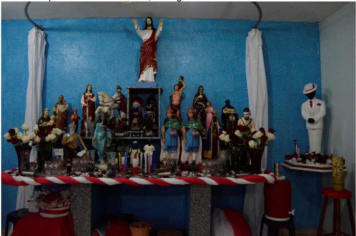
Figura 2 – Congá do terreiro “Caboclo Giramundo e Mestre Zé Pilintra” decorado para festa de Zé Pilintra, e imagem de Zé Pilintra ao lado

mas o evoca de forma compreensível para aqueles que compartilham daquele arcabouço cultural necessário para conhecer a imagem. Sendo assim, para os frequentadores do terreiro e para os filhos de santo, a imagem, por exemplo, do casal de idosos de pele negra e vestes simples brancas é a representação dos pretos-velhos. Aquela estatueta representa a aparência e dá a noção de como será feita a representação dos mesmos na incorporação, assim como traz um referencial imagético para apropriação da figura no imaginário dos fiéis, sendo referencial para a prática da representação daquela entidade.