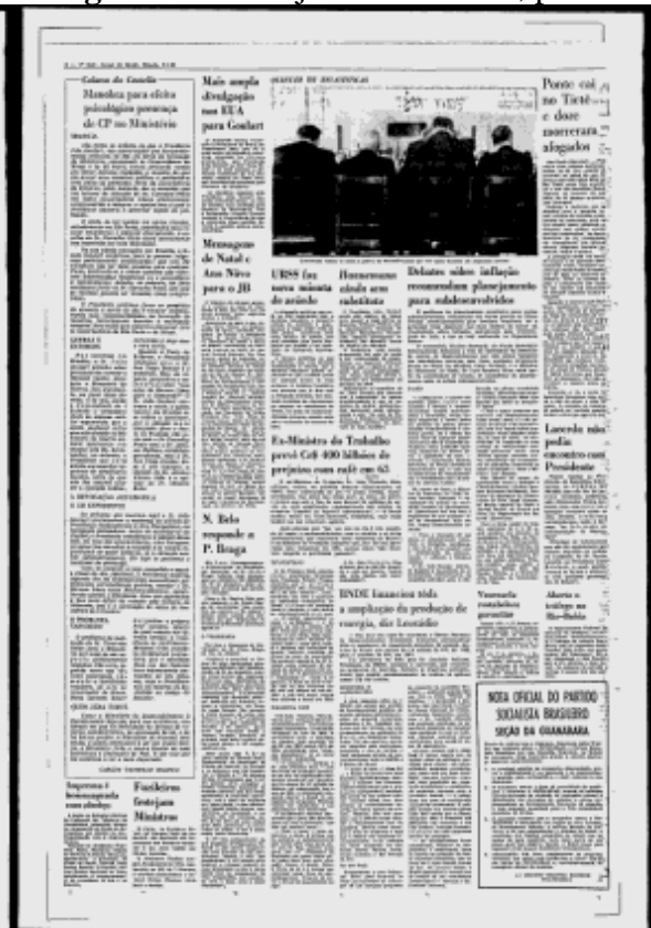
Figura 11 - 5 de janeiro de 1963, p.4