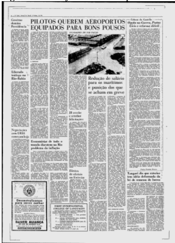
Figura 10 - 3 de janeiro de 1963 p. 4