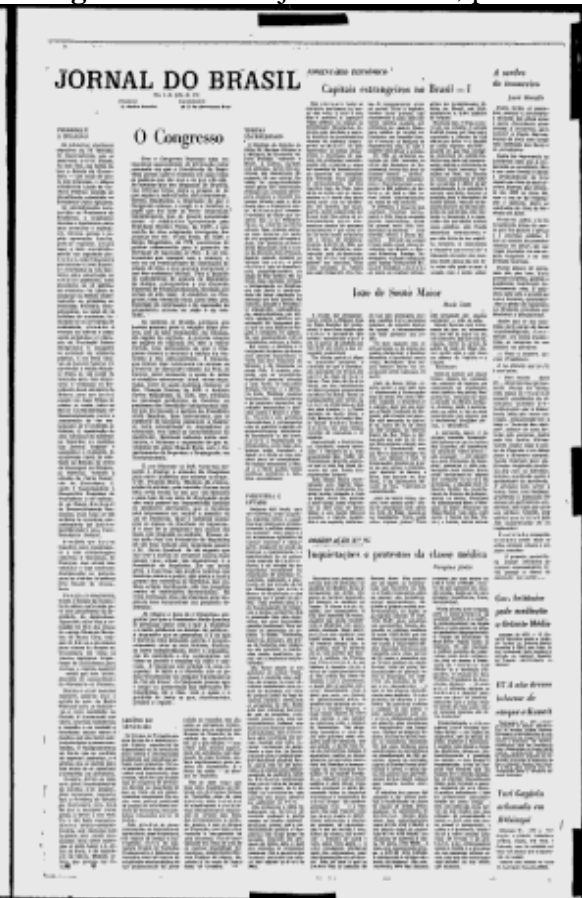
Figura 13 - 11 de julho de 1961, p.6