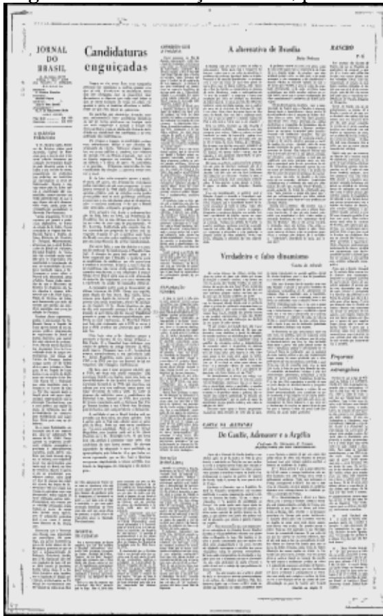
Figura 12 - 4 de março de 1960, p.6