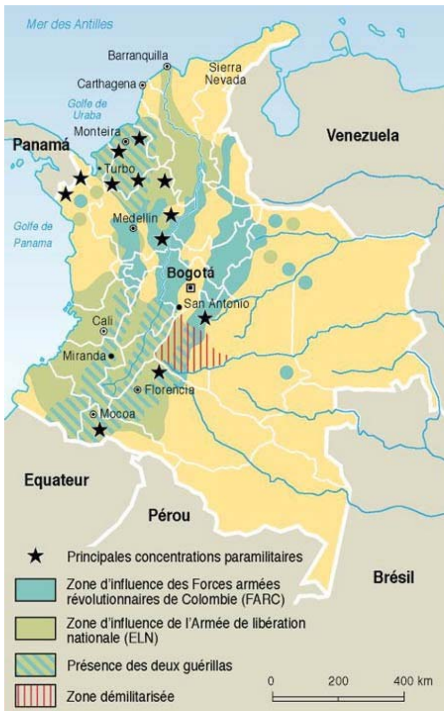
Mapa 3 – Guerrilhas e Forças Paramilitares na Colômbia em 2000