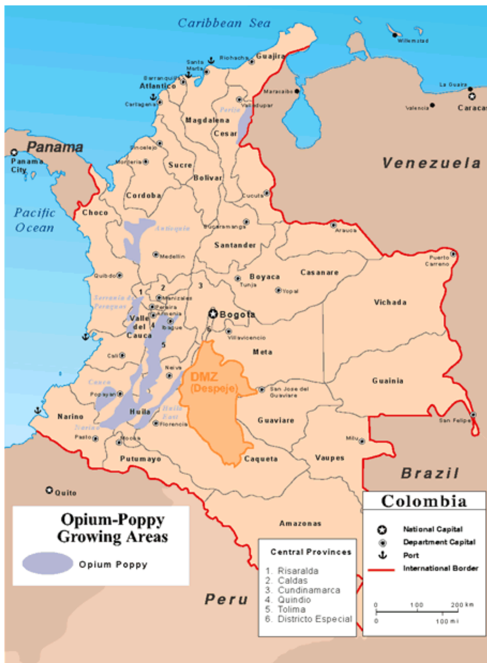
General Opium Cultivation Areas in Colombia