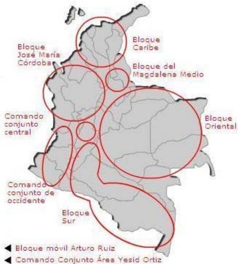
Mapa 4 – Principais comandos e zonas de ação das FARC