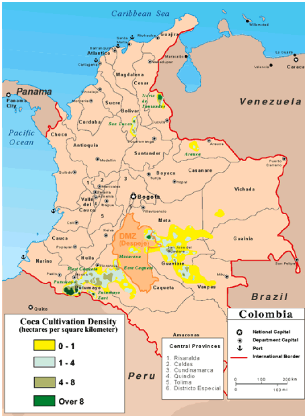
General Coca Cultivation Areas in Colombia