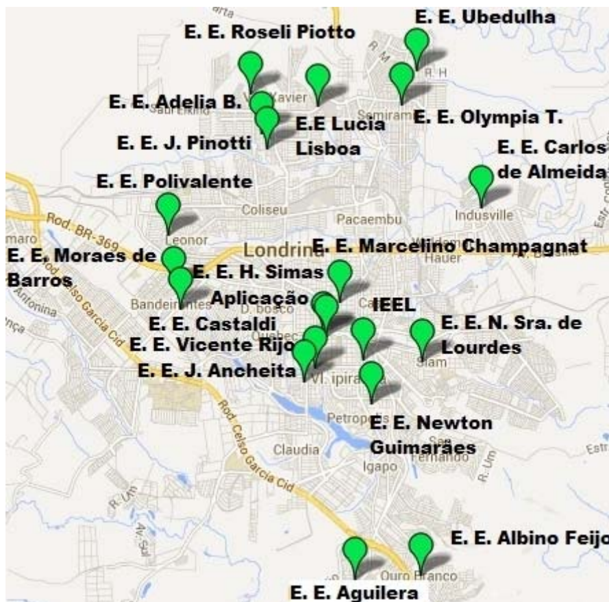
Figura 1 – Localização das 20 escolas estaduais de Londrina – PR, participantes da pesquisa.

Posteriormente, os pesquisadores realizaram palestra de sensibilização para os professores de cada escola e então as entrevistas foram agendadas de acordo com a disponibilidade dos sujeitos da pesquisa, de preferência na escola e em períodos de hora/atividade.