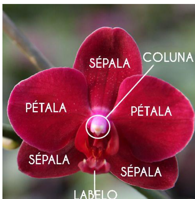
Figura 1. Estruturas botânicas da flor da orquídea Phalaenopsis sp.