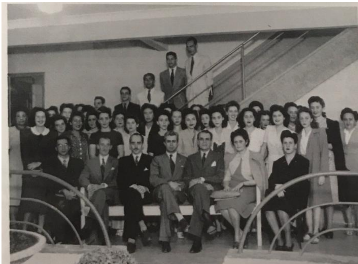
Figura 5 – Professores e Estudantes do Curso Prévio