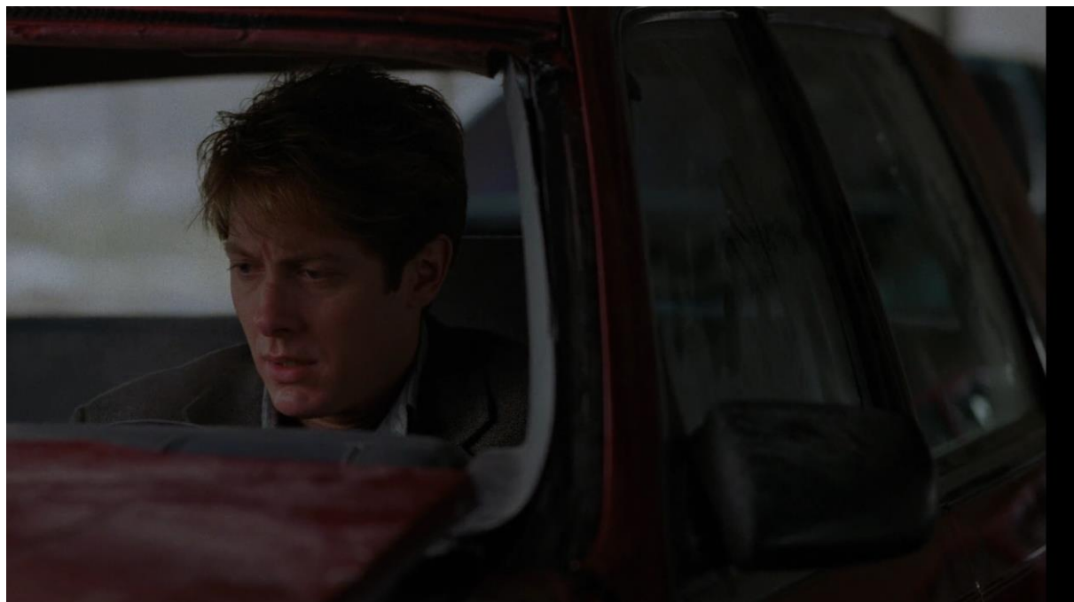
Figura 09: Ballard volta ao seu carro após sofrer um grave acidente de trânsito

Fonte: frame do filme Crash - Estranhos Prazeres (1996)