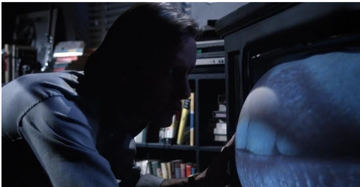
Figura 02 - A televisão se transforma em um objeto de carne que beija e atira