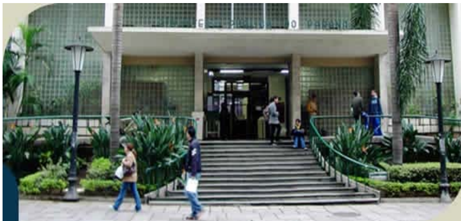
Figura 3 – Entrada Biblioteca Pública do Paraná