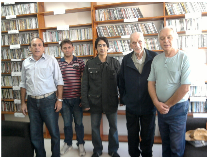
Figura 7 – Associados do Cineclube Jorge de Souza. Outubro de 2011