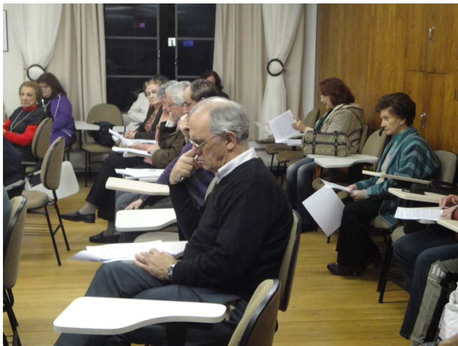
Figura 17 – Aula teórica na Oficina Permanente de Poesia da Biblioteca Pública do Paraná. Outubro de 2011