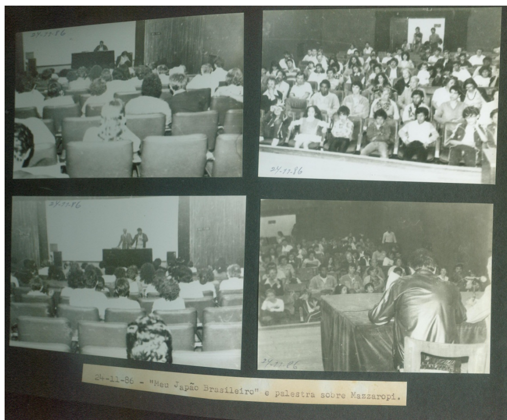
Figura 9 – Palestra e exibição de filme no Auditório da Biblioteca Pública do Paraná. Novembro de 1986