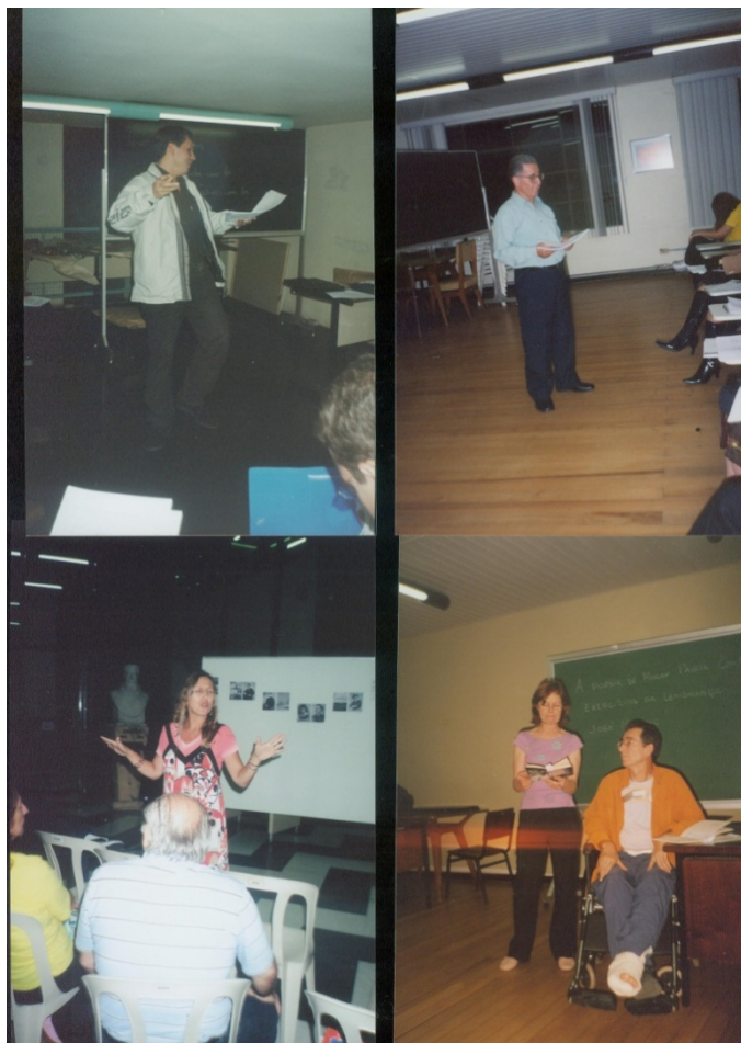
Figura 14 – Declamações de poemas na Oficina Permanente de Poesia da Biblioteca Pública do Paraná