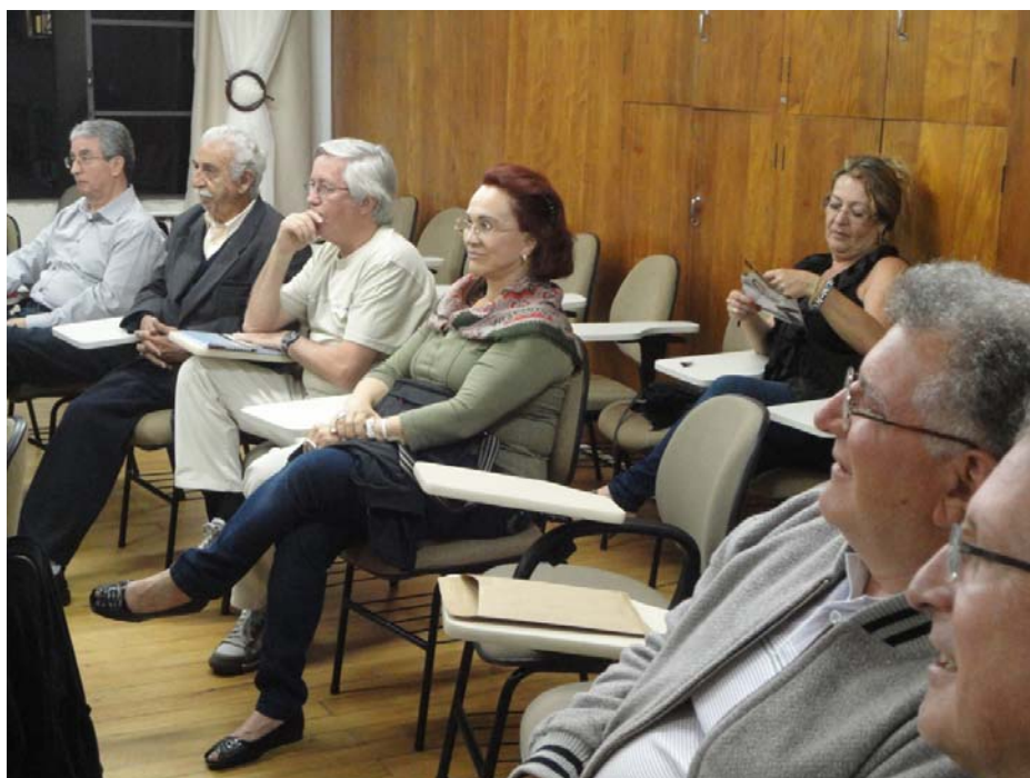
Figura 21 – Participantes ouvem poemas na Oficina Permanente de Poesia da Biblioteca Pública do Paraná Outubro de 2011