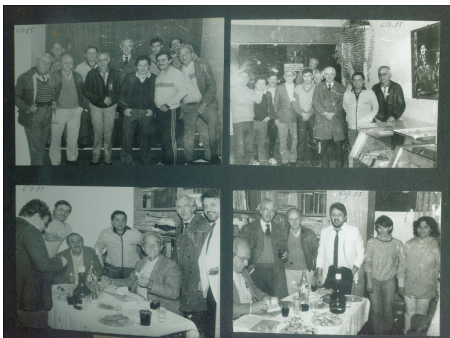
Figura 6 – Associados do Cine Clube Anníbal Requião. Setembro de 1985