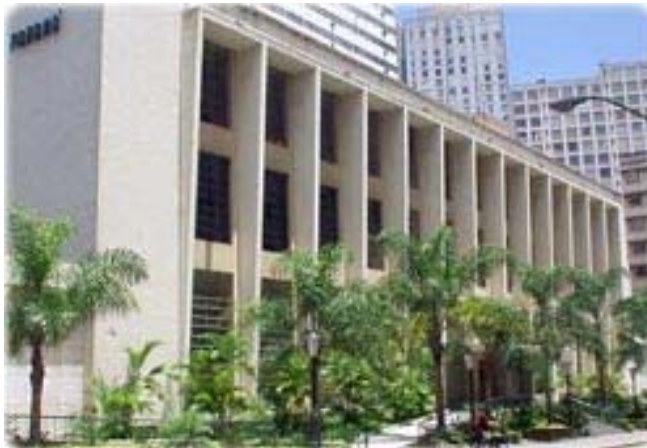
Figura 1 – Fachada da Biblioteca Pública do Paraná 2