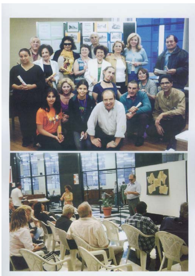
Figura 11 – Participantes da Oficina Permanente de Poesia em diferentes momentos e atividades na Biblioteca Pública do Paraná