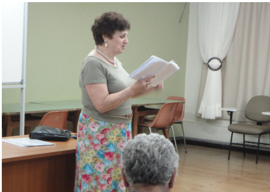
Figura 18 – Leitura de poema na Oficina Permanente de Poesia da Biblioteca Pública do Paraná. Outubro de 2011