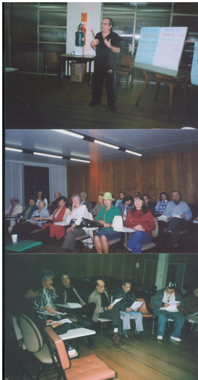
Figura 15 – Aulas teóricas na Oficina Permanente de Poesia da Biblioteca Pública do Paraná