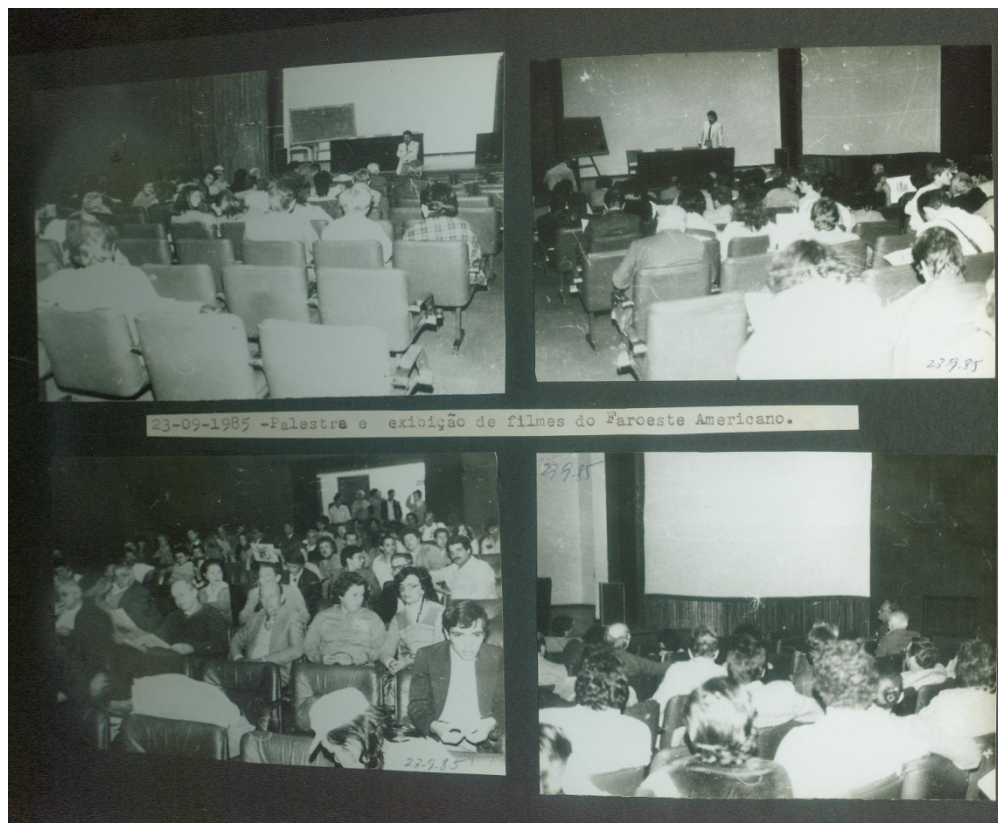
Figura 8 – Palestra e exibição de filme no Auditório da Biblioteca Pública do Paraná. Setembro de 1985