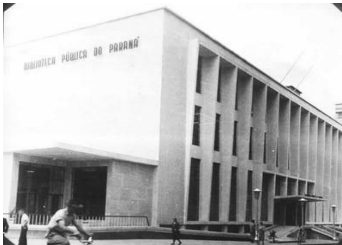
Figura 1 – Fachada da Biblioteca Pública do Paraná 1