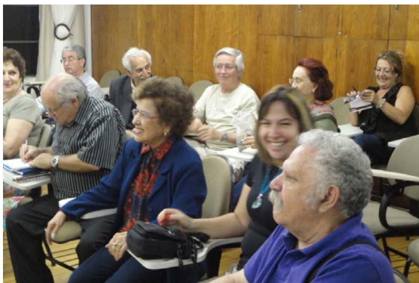
Figura 13 – Oficina Permanente de Poesia na Biblioteca Pública do Paraná - Outubro de 2011