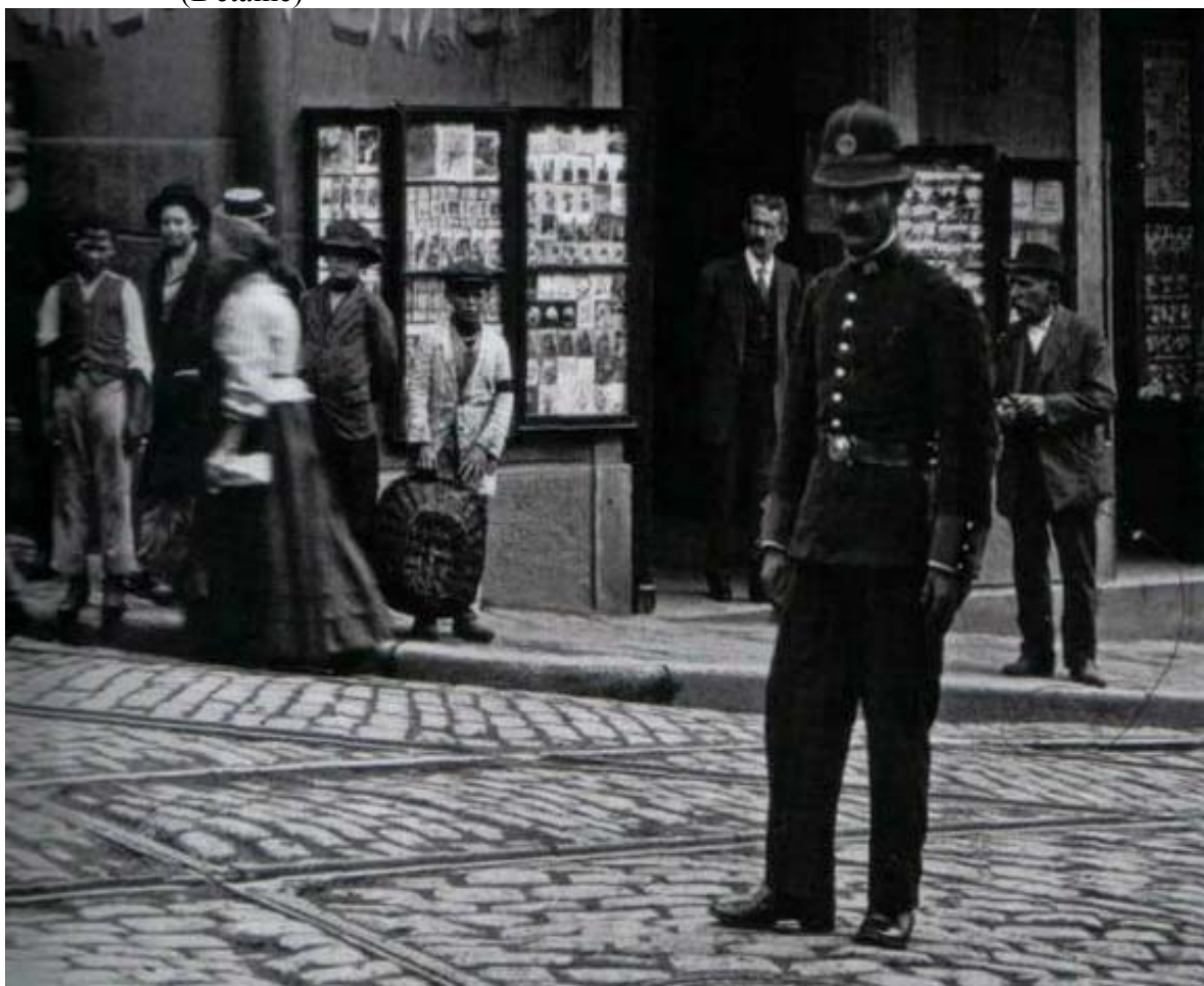
Imagem 3 - Aurélio Becherini: Foto de um policial vigiando a movimentação e ao fundo um grupo de meninos na Rua Líbero Badaró esquina com a Ladeira São João, 1912, (Detalhe)