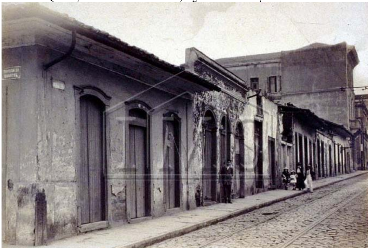
Figura 1 - Vincenzo Pastore: Casario da Rua da Esperança, esquina com a Travessa do Quartel, zona do baixo meretrício, região da atual Praça da Sé. São Paulo 1910