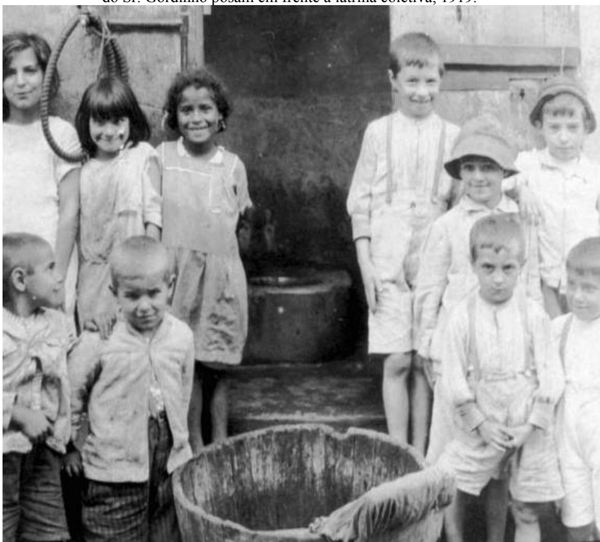
Imagem 5 – Geraldo Horácio de Paula Souza: Fotografia de crianças habitantes do cortiço do Sr. Gordinho posam em frente à latrina coletiva, 1919.