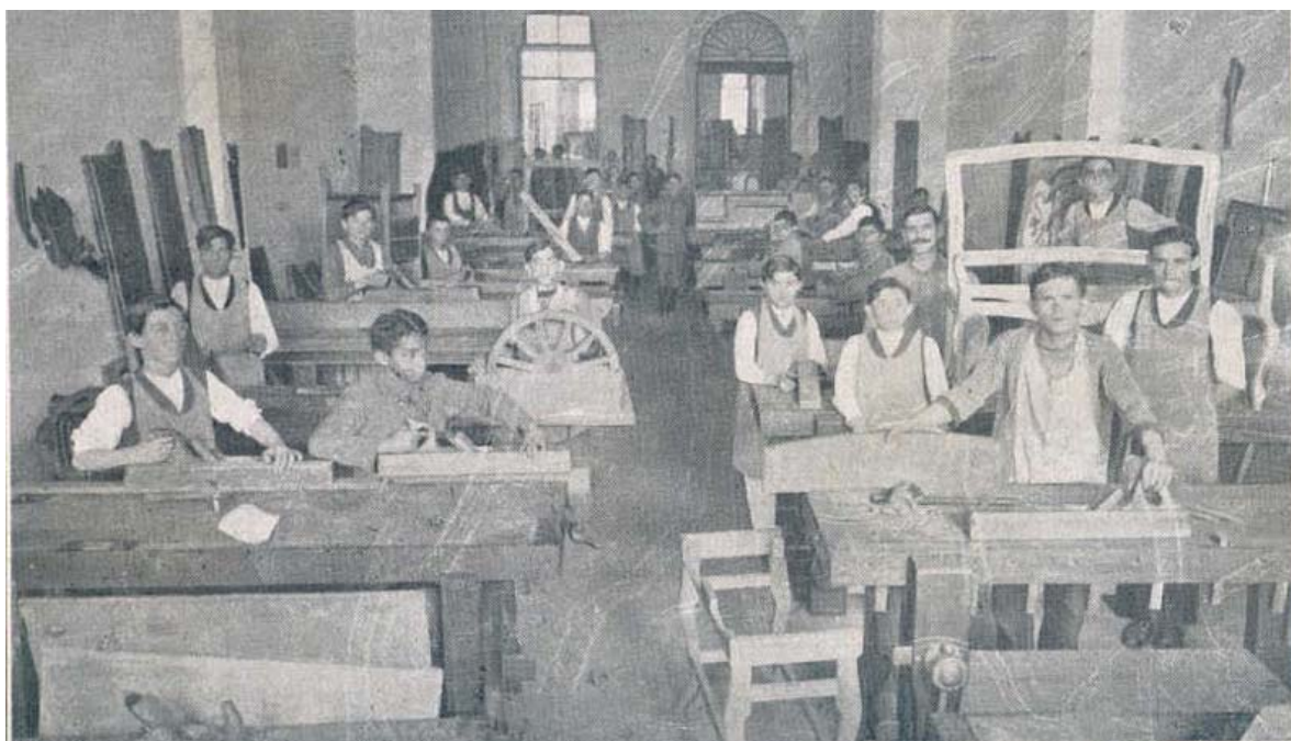
Imagem 8 – Alunos em aula prática de marcenaria na Escola Profissional Masculina.