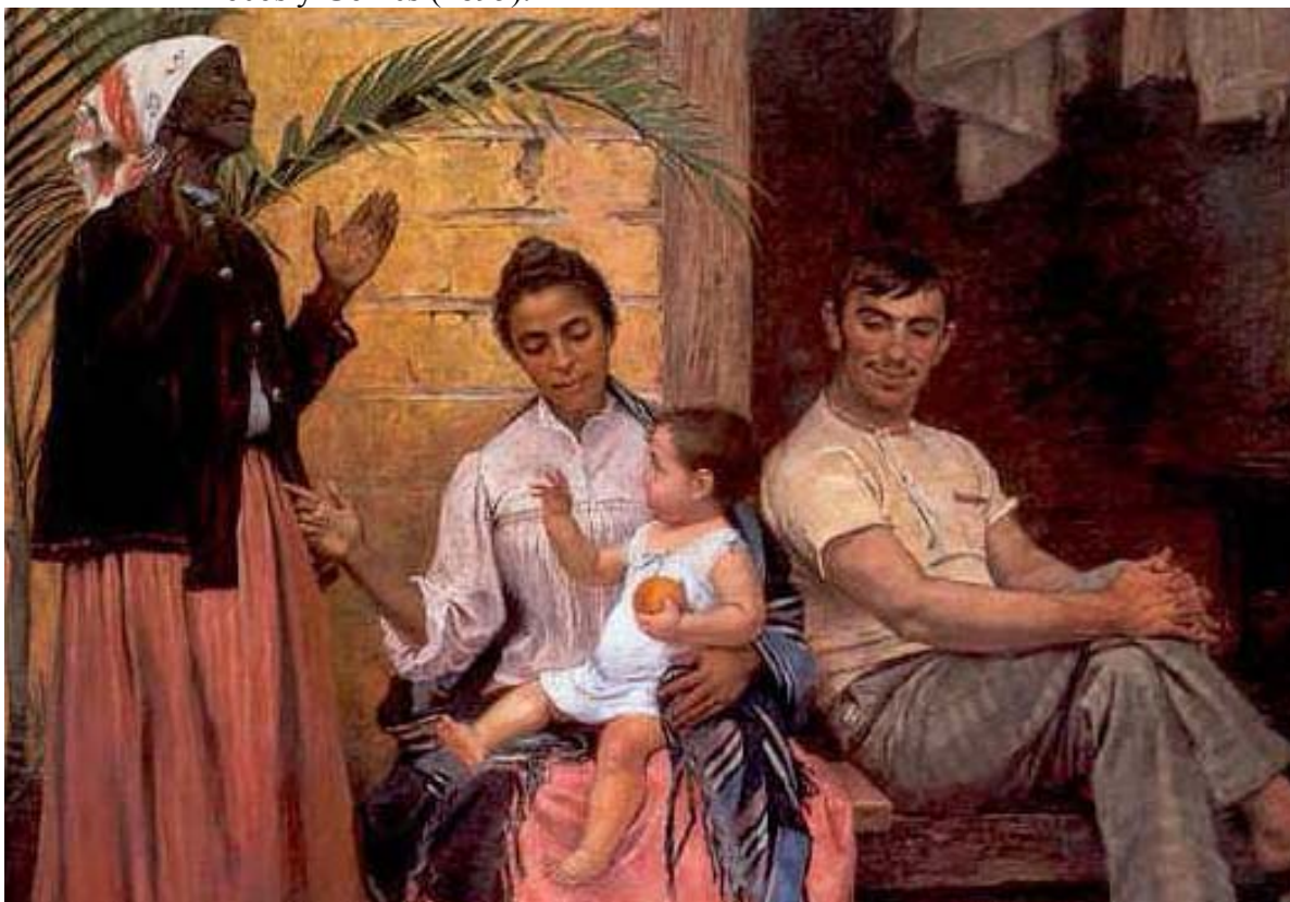
Imagem 4 – Detalhe da pintura A Redenção de Cam do espanhol radicado no Brasil Modesto Brocos y Gomes (1895).

A cena mostra três gerações da mesma família: a avó negra, a filha mulata casada com um homem branco e seu filho branco, expressava a mentalidade da sociedade da época em que via na miscigenação a solução para o branqueamento racial no Brasil. Acervo: Museu Nacional de Belas Artes – Rio de Janeiro.