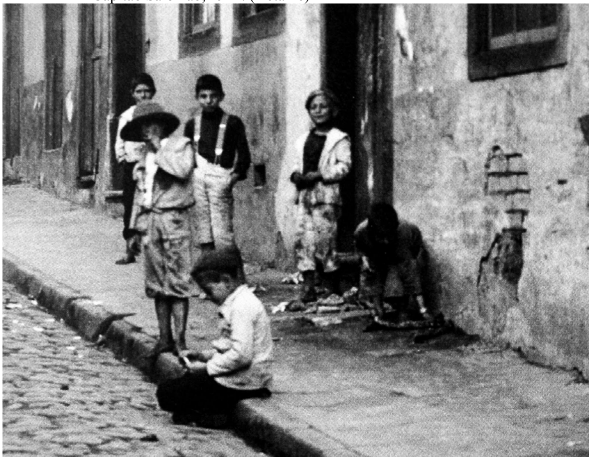
Imagem 2 – Aurélio Becherini: Fotografia de um grupo de crianças delinquentes na Rua Capitão Salomão, 1912. (Detalhe)

Fonte: Livro: Aurélio Becherini , São Paulo: Editora Cosac Naify, 2009, p. 132 Acervo: Biblioteca Setorial de Ciências Humanas (BSCH) Universidade Estadual de Londrina – PR.