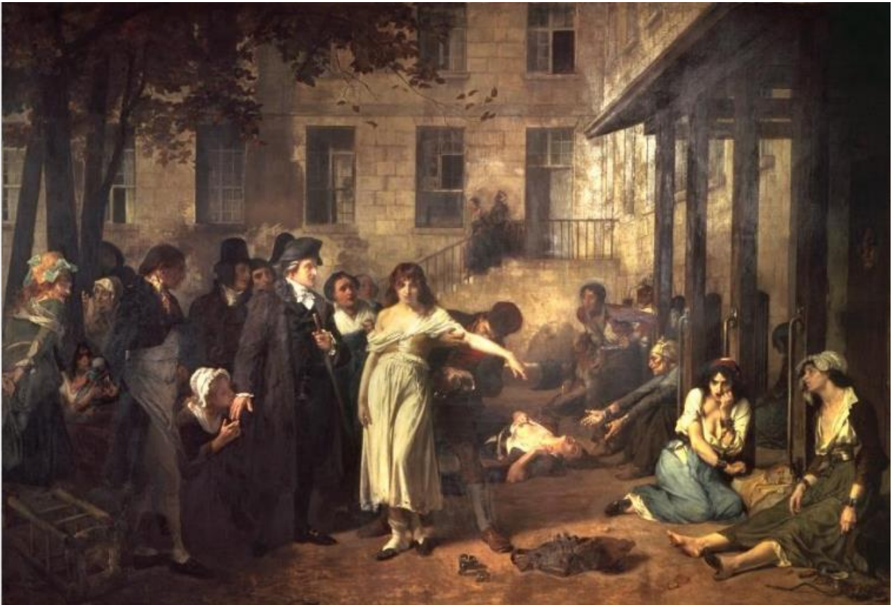
Figura 02 - Pinel libertando os loucos, por Tony Robert-Fleury (1837-1912)

apesar das críticas quanto ao caráter vago e ambíguo de alguns de seus postulados, sobretudo no que diz respeito aos fatores etiológicos. É a sua busca por objetividade através da observação sistemática, como tentativa de aproximação metodológica com as ciências naturais, que traçou o percurso da medicina em relação à loucura, agora transformada em alienação mental, durante todo o século XIX.