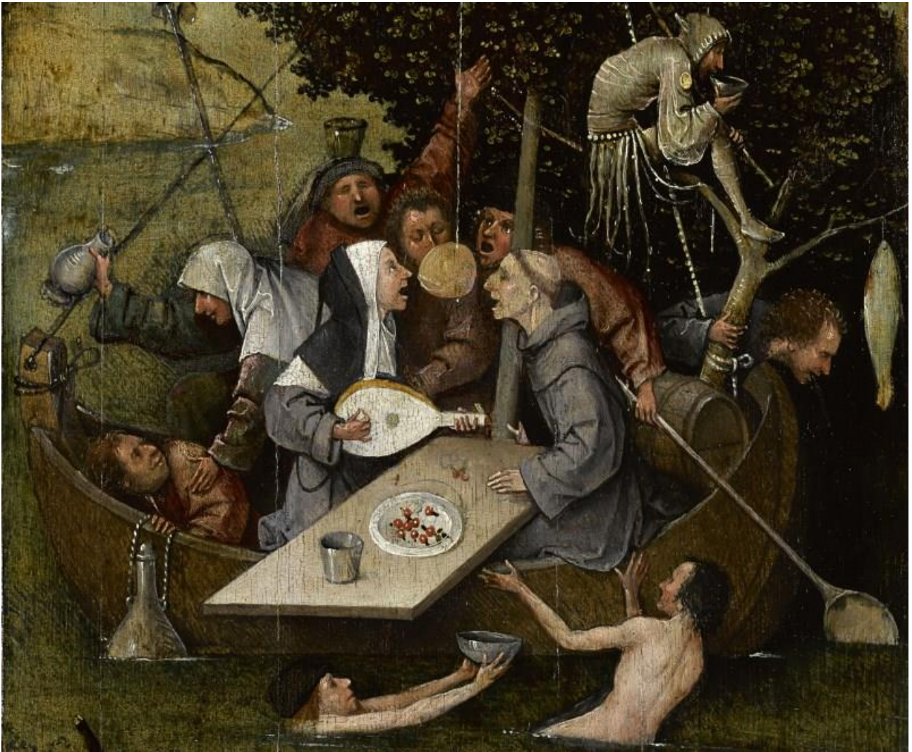
Figura 01 – A Nau dos Loucos , de Hieronymus Bosch.