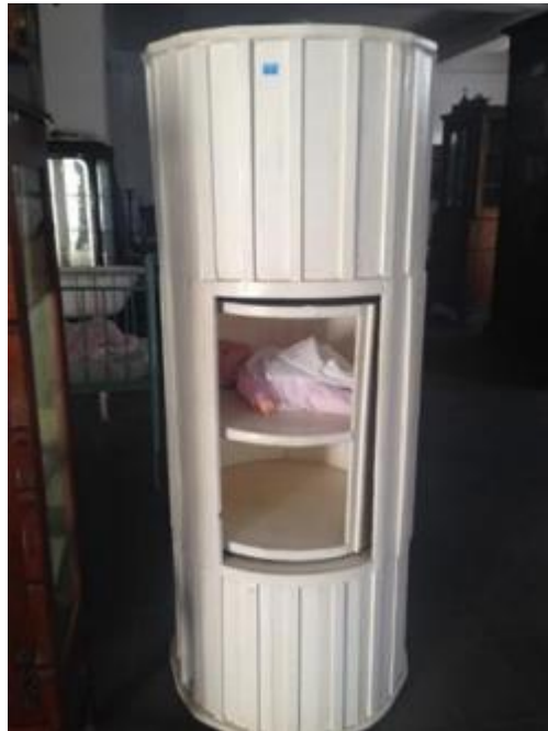
Figura 04 - Roda dos expostos da Santa Casa de Misericórdia do Rio de Janeiro

De acordo com Leite (1991), a Roda apresentava um compartimento instalado no muro da entidade, em geral Santas Casas de Misericórdia, com a porta para a rua, no qual as crianças eram deixadas, anonimamente. Este compartimento cilíndrico girava verticalmente, de modo que a criança era colocada para dentro da instituição de caridade sem expor os que a deixavam ali (Bulhões, 2018).