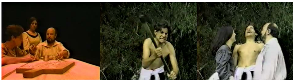
Figura 18 - Definição de Amor livre em Pão Negro: da divisão do pão à deliciosa afetividade

Pão Negro, portanto, não se preocupa em representar tais narrativas como o cinema clássico possivelmente faria, não busca criar uma representação de realidade, são cenas que não se escondem, cenas caricatas. Será mesmo que os colonos viam o anarquismo dessa forma? Será que Rossi era mesmo esse santo de ideias libertárias, um Jesus Cristo do anarquismo? São questões que o filme lança.