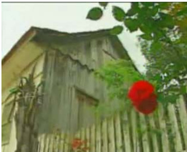
Figura 51 - Ilustração imagética da decepção com o socialismo