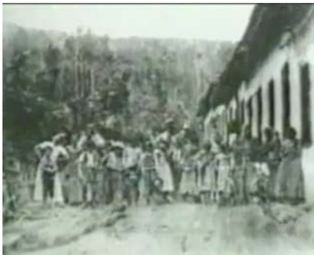
Figura 49 - Imagem de arquivo para retratar o excesso populacional