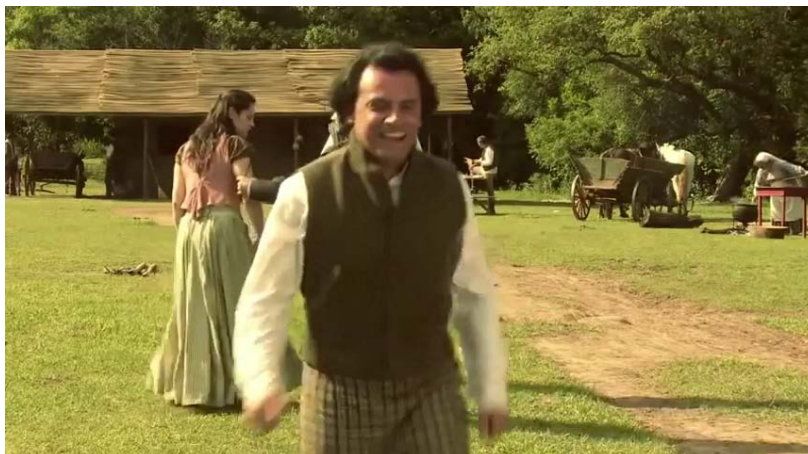
Figura 30 - Risos do vilão e ciúmes agressivo do protagonista