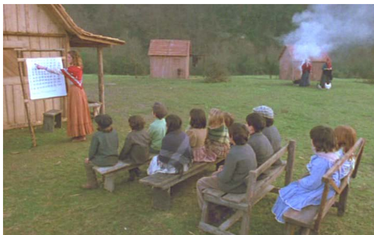
Figura 8 - Novas mulheres também representadas em seus papéis tradicionais