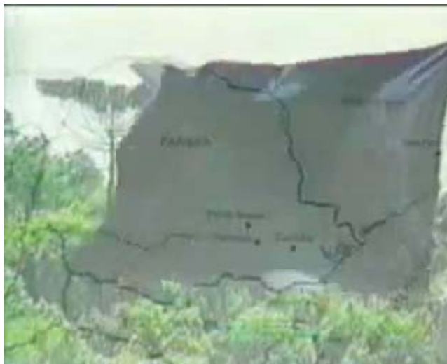
Figura 52- Cena retirada do filme Pão Negro de 1993