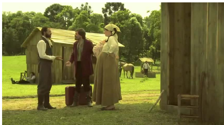
Figura 45 - Pai de família questiona o fracasso econômico da Cecília

Quais outros elementos reforçam esses estereótipos? Primeiro, como observamos, a ausência de explicações racionais sobre o que é. Segundo, as muitas regras no local que se dizia contrário a todas, são de cunho religioso, moral e também afetam o trabalho, hora permitindo que uns explorem os outros, hora obrigando todos a cooperar.