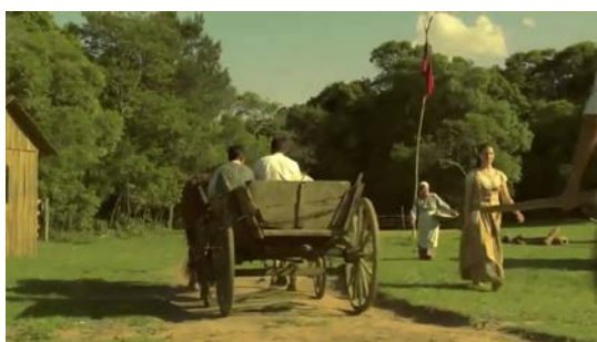
Figura 43 - Protagonista ironiza a ausência de regras

No terceiro, tremula enquanto Fabrício se arruma, corteja as mulheres e os demais trabalham (Figura 39). No mutirão para pagar as dívidas da colônia, aparece durante a ironia do protagonista: agora a regra era trabalhar (Figura 43).