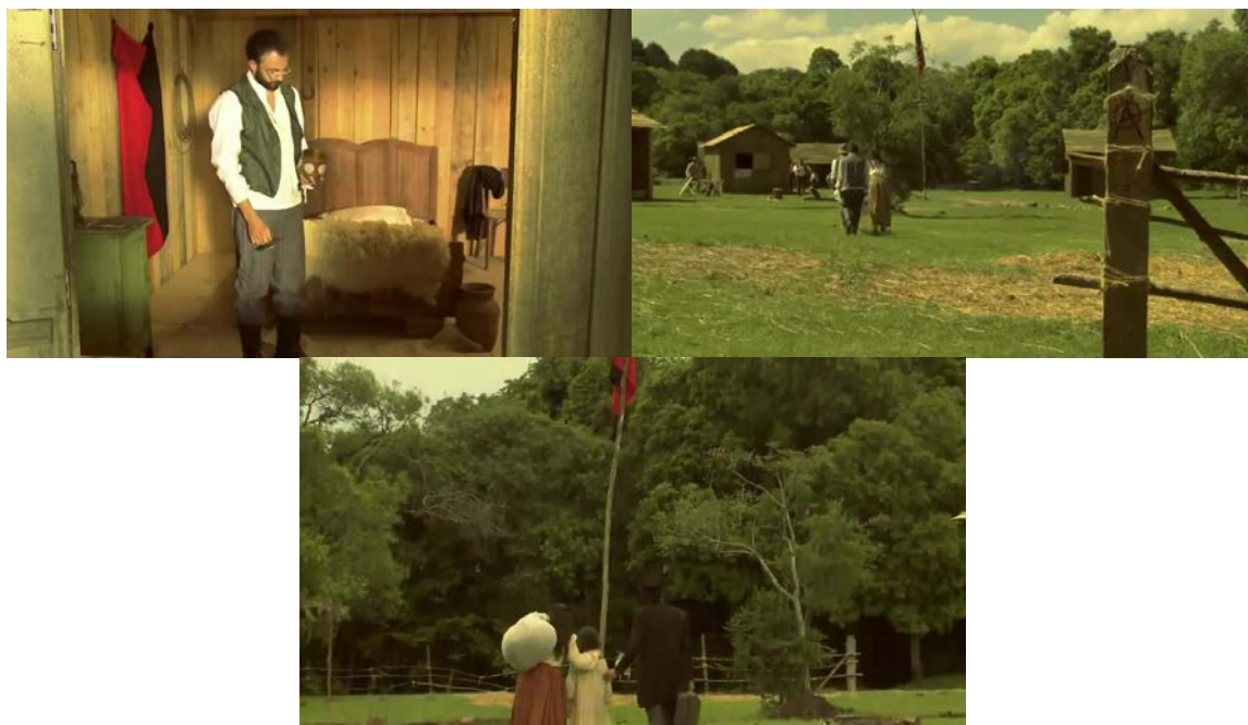
Figura 44 - Comprovada a inocência anarquista, é abandonado o sonho