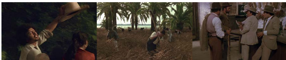
Figura 9 - Contextos da Cecília: Escravidão (16'40''), exploração do trabalho nas fazendas e preconceito (18'40'')