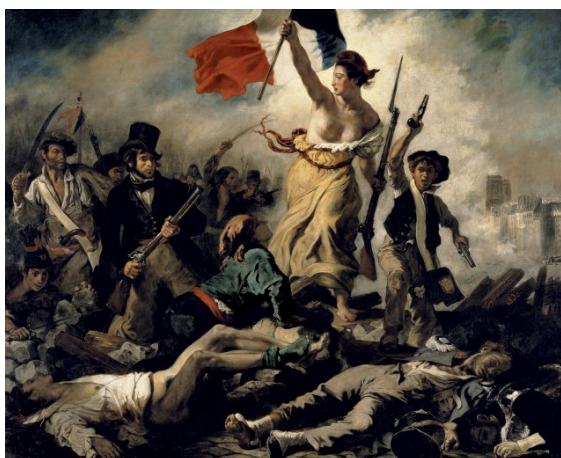
Figura 5 - A liberdade guiando o Povo - Eugène Delacroix (1830)