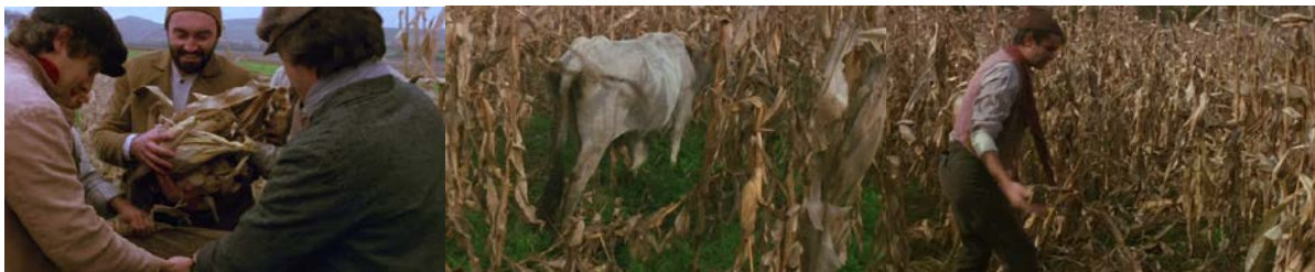
Figura 10 - Conflitos se acentuam com a partida de Rossi

seguem trabalhando, a canção ressurgue de modo unificador e pacificador dos conflitos durante a despedida de Rossi.