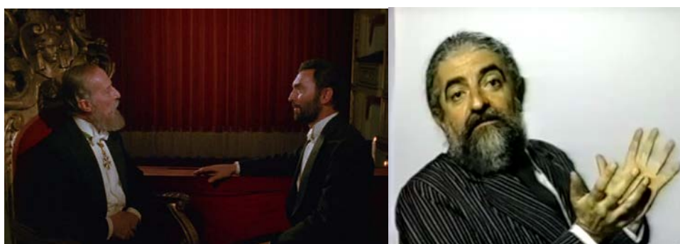
Figura 14 - Cenas de abertura de La Cecília , à esquerda, e de Pão Negro

Fonte: La Cecília (1975) e Pão Negro (1993)