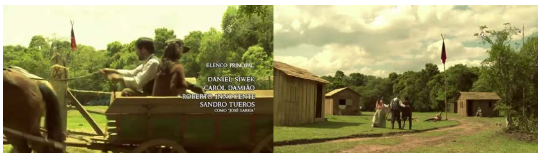
Figura 41 - Bandeira da anarquia na abertura e como travesseiro do bêbado

No capítulo 1, na abertura, é comparada com ironia à bagunça e à palavra confusa. Sob o sol, é o local em que o bêbado demonstra a prática da anarquia. Em contra plongée, é cenário para o gesto de conotação sexual (Figura 29). Está presente quando descobrem que a filha não é de Aníbal (Figura 31).