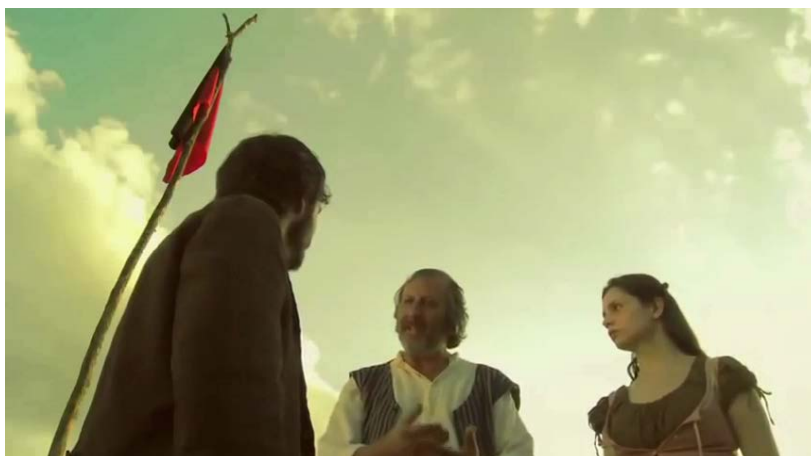
Figura 29 - Anarquismo explicado com gesto de conotação sexual