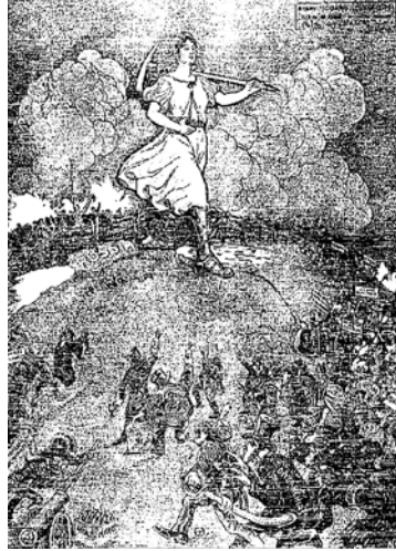
Figura 6 - A revolução social