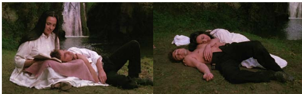
Figura 12 - Olimpia e as brechas para imaginar o amor livre

Essas cenas de Olimpia com homens são sempre insinuantes; o filme nada mostra, mas faz e deixa pensar. Nessa cena da cachoeira, a dupla aparece primeiro vestida. Num segundo momento, com menos roupas e o zíper da calça do rapaz está aberto (Figura 12).