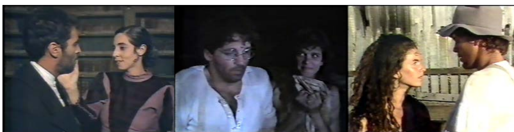
Figura 25 - Um ideal de amor? Romântico