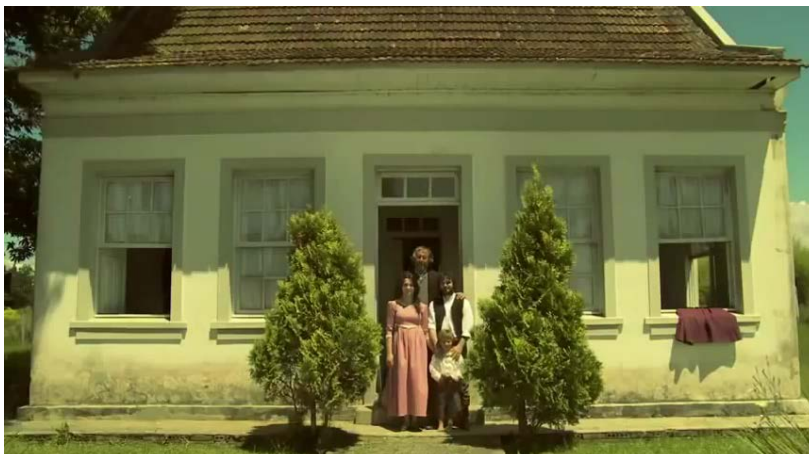
Figura 47 - Família tradicional, sucesso e ideologia do capitalismo