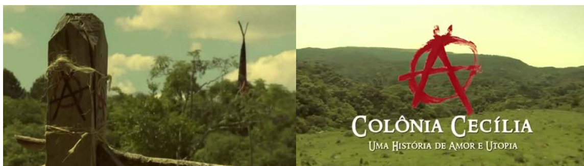
Figura 40 - Simbologias do anarquismo

O início do quarto capítulo apresenta Fabrício e Giulia isolados ao pôr do sol na mais triste solidão. A seguir, os anarquistas festejam a colheita e a série se aproxima de seu desfecho trágico e feliz. Nesse, a mudança da mulher desprezada pelo marido, Janice, nos ajudará a entender essa forma de narrar o amor livre. Antes, entretanto, pensemos como se representou o anarquismo na série.