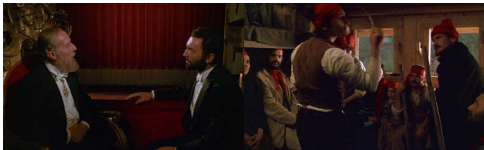
Figura 13 - Comparativo: abertura (2'08'') e encerramento teatral (1h37')