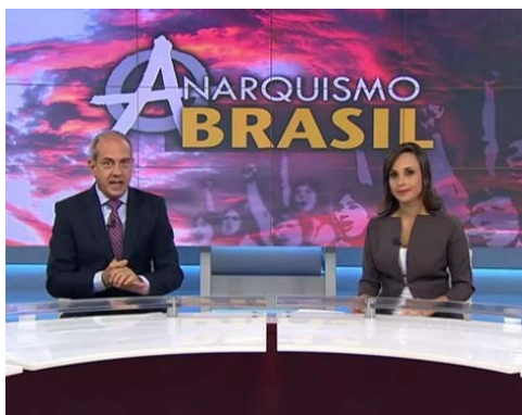
Figura 55 - Âncoras exageram ao apresentar a temática da reportagem