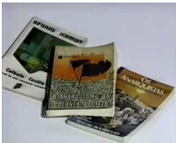
Figura 16 - Modelo historiográfico começa ganhar relevância