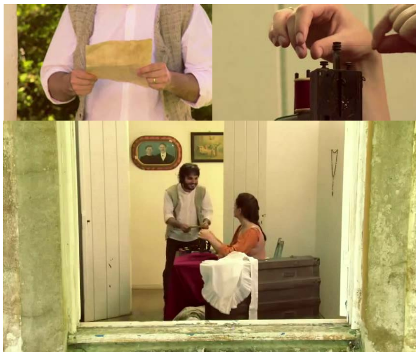
Figura 28 - Protagonistas exibem alianças, família tradicional e religião católica

têm casa e repete o convite. Antes de ouvirmos a resposta da mulher, vemos o indício de que a viagem foi feita. Um corte nos mostra o símbolo A de anarquismo pintado em preto e vermelho sobre uma porteira. Falaremos depois sobre essa ruptura na forma de representação audiovisual da simbologia anarquista da Cecília.