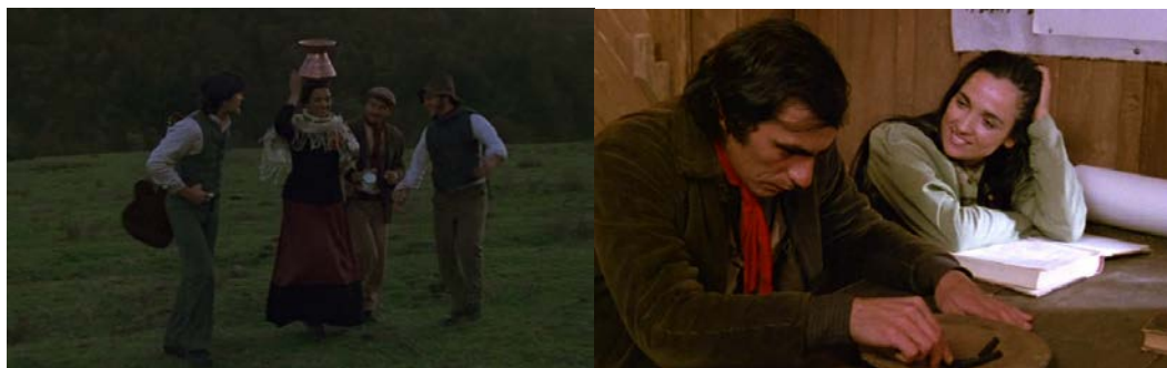
Figura 7 - Comparativo: sedutora, provedora (10'20'') e porta voz do amor livre (1h1')