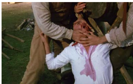
Figura 11 - Batismo de vinho durante celebração: ironia e crítica à religião