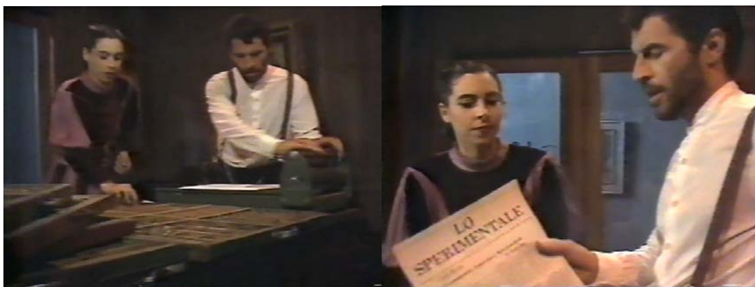
Figura 2 - Rossi e Adele imprimem o jornal Lo Sperimentale

É diante disso, e após ter tido sua proposta arquivada no seio da organização que era predominantemente anarquista, no contexto italiano da época, a AIT na Itália, que Rossi se envolve cada vez mais com o Partido Socialista Revolucionário Italiano - PSRI. Por meio de seus jornais, publicou a primeira edição do livreto “un commune” em 1878 no periódico “La Plebe”. Seu envolvimento e sua campanha em defesa das colônias no partido se intensifica a partir de 1883 em uma série de artigos. O então reconhecido anarquista, vigiado pela polícia italiana, ao fazer questão de defender o exemplo positivo, afasta-se da tendência insurrecional e se aproxima cada vez mais das propostas do partido. Defende em 1884 uma candidatura como estratégia de ação, de direito, de justiça e autodefesa. Por fim, em 1885, submete a proposta de fundação de uma colônia ao PSRI. Indícios apontam que a proposta não surtiu efeito, em 1886, Rossi se desvincula do partido e lança em Brescia seu próprio jornal: Lo Sperimentale (Figura 2). (MUELLER, 1999, p. 130-151).