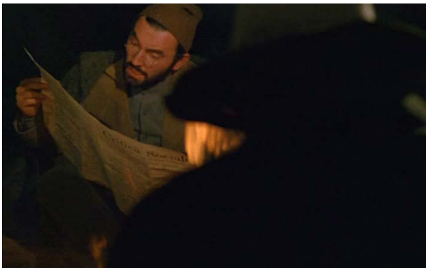
Figura 3 - Rossi lê e se queixa da crítica de Malatesta: Em La Cecília , é essa leitura que motiva a viagem de Rossi para a Itália

Como veremos no capítulo seguinte, a crítica de Malatesta aparece em várias narrativas audiovisuais como, por exemplo, no filme La Cecília (Figura 3).