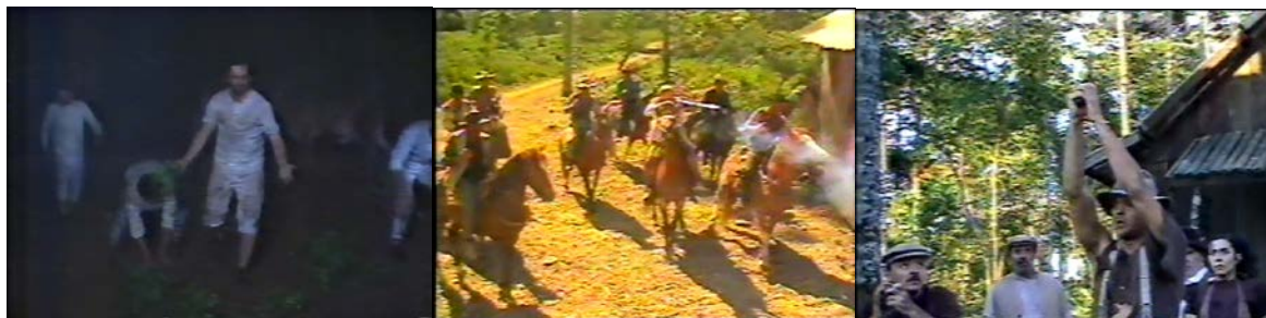
Figura 20 - Ataques econômicos e violência