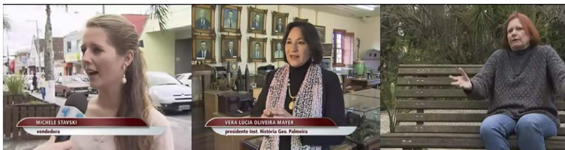
Figura 54 - Mulheres entrevistadas pela reportagem