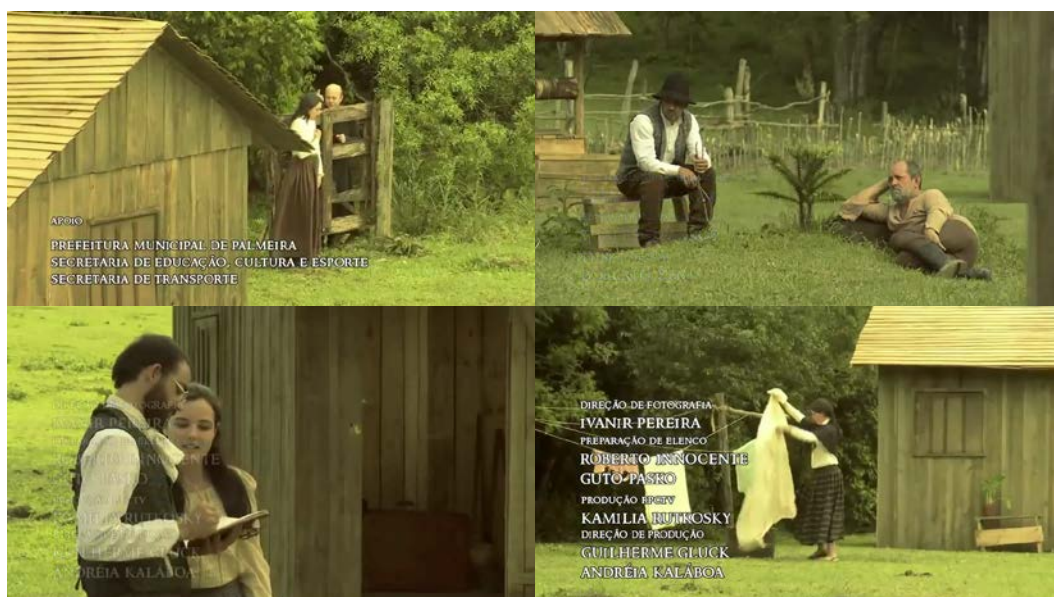
Figura 46 - Sem religião, família, governo e laços que prendem a mulher ao homem