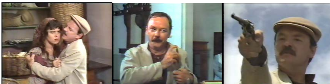
Figura 23 - Narrativa do roubo e o ápice da violência

Por fim, no capítulo 10, vemos uma história que voltará a surgir na voz dos descendentes de cecilianos do filme Pão Negro, o padre é contrário ao enterro das crianças anarquistas vítimas da crupe. Cria-se assim o cemitério dos renegados na Colônia Cecília.