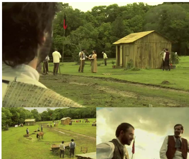
Figura 42 - Bandeira em conflitos morais, econômicos e políticos