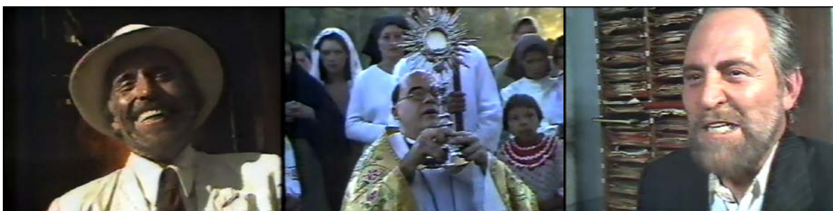
Figura 21 - Vilões: burguês, padre e delegado