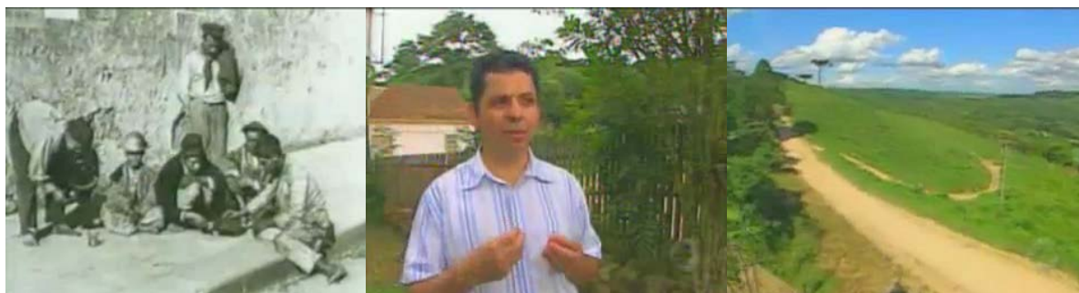
Figura 48 - Imagens de arquivo, entrevistas e cenas da região de Palmeira