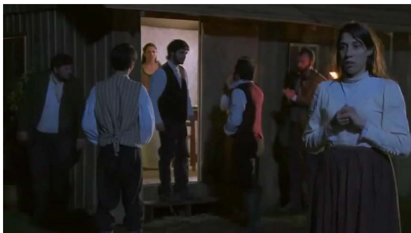
Figura 33 – Grupo de homens demanda a esposa de Fabrízio

Já em casa, acomodados pelo tio que vai se deitar, cansado, é que eles começam a entender os princípios de Rossi, pela experiência. Ao conversarem, a sós, Giulia diz que está impressionada com a organização da Colônia, parecem esperançosos. Mas Fabrízio pressente o perigo, ao dizer que não lhe agrada o modo de vida dessa gente, batem à porta.