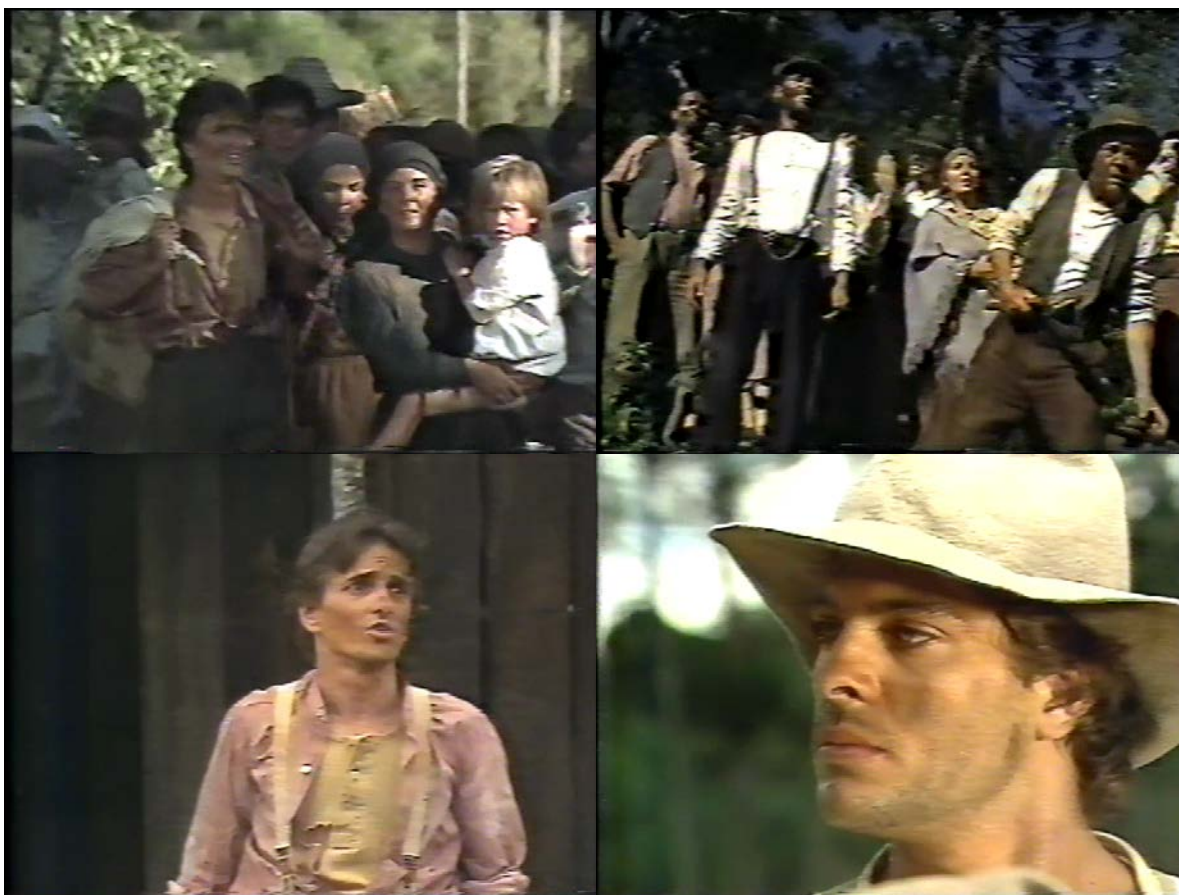
Figura 22 - Diferença entre imigrantes não anarquistas (à esquerda) e anarquistas