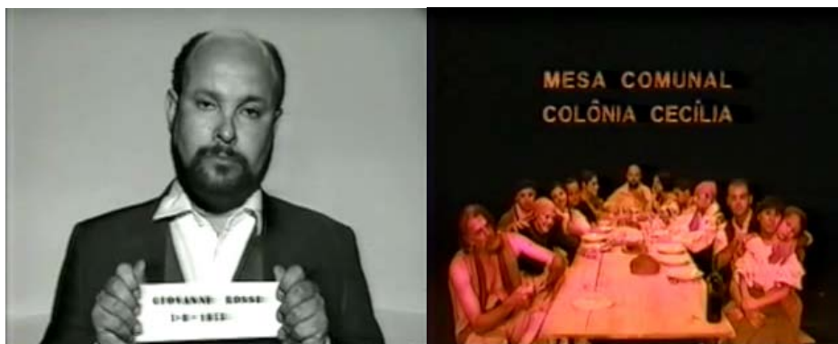
Figura 15 - Estereótipos de Giovanni Rossi em Pão Negro