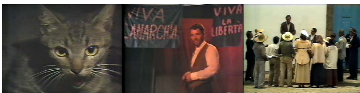
Figura 26 - Luta de classes e protesto anarquista