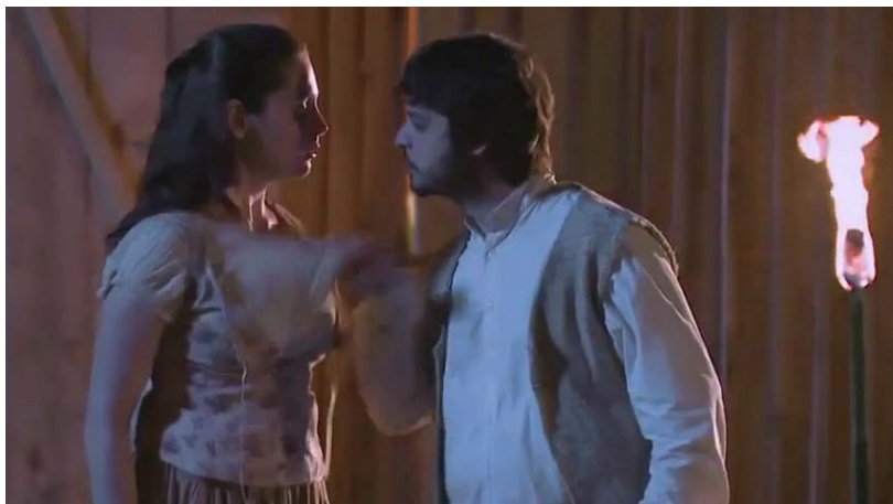
Figura 37 - Protagonista questiona o decote de sua esposa

Depois, disso, Gariga propõe fazer um levantamento financeiro da colônia com ajuda de Giulia, ela concorda mas o marido a proíbe, pois é o único que não sofre da inocência, anarquista e da mulher, e consegue prever a má intenção do canalha. Por isso, ao final do episódio, brigam e Giulia vai dormir em outra casa. O marido é machista e irônico, mas o único capaz de entender a realidade, alerta que Gariga só se interessa por ela devido a beleza, que Giulia seria mais útil se continuasse dando aulas e distribuindo água, que pelo ou menos, assim, os homens estariam felizes com seu decote. E puxa com o dedo o decote dela (Figura 37).