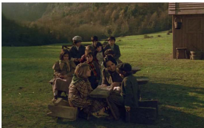
Figura 4 - O papel da mulher: Professora

Diante das propostas de vanguarda, não pode se perder de vista que mesmo na efervescência do movimento anarquista brasileiro até os anos 1920, o contexto ainda permanecia muito machista, a fábrica muitas vezes era vista como local de perdição e a mulher como responsável pelo lar. “A mentalidade machista era muito arraigada. Mesmo entre anarquistas e comunistas”. (PRIORE, 2005, p. 266).