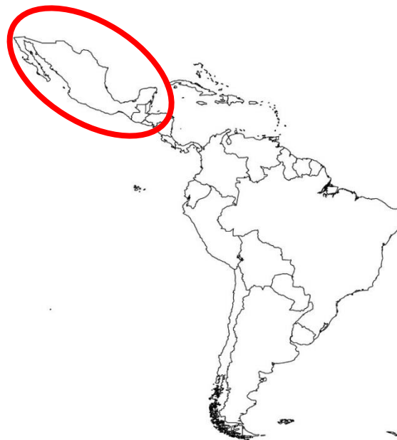
Figura 1 – Centro de origem do milho doce, com destaque para a região do México.

O milho doce ( Zea mays convar. Saccharata ) é uma planta pertencente à família das Poáceas, tribo Maydeae e gênero Zea , e tem como centro de origem e domesticação a América Central e do Sul, abrangendo, principalmente, a região onde se situa o México (Figura 1) (KWIATKOWSKI; CLEMENTE, 2007). Teorias sustentadas por provas arqueológicas e genéticas sugerem que o surgimento do milho doce tenha ocorrido através de mutação, sendo a domesticação promovida pelas civilizações existentes, processo que consolidou a existência e importância da cultura como fonte de carboidrato (SOUSA; PAES; TEIXEIRA, 2012).