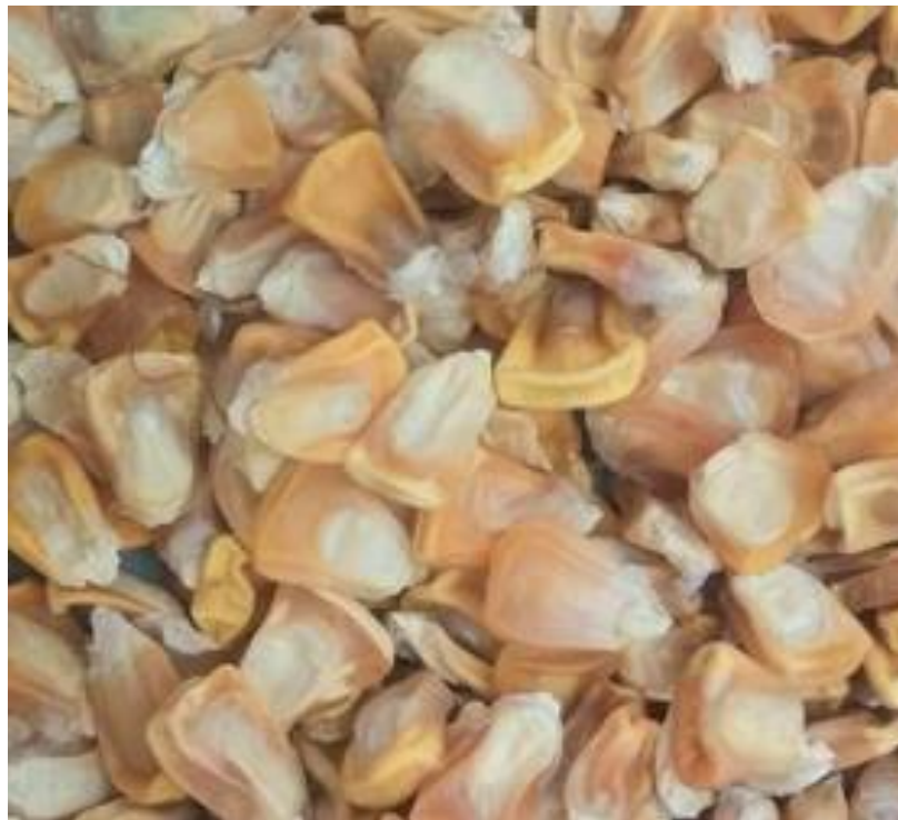
Figura 2 – Aspecto vítreo e enrugado da semente de milho doce.

A principal diferença entre o milho comum e o doce está na semente, que depois da maturação fisiológica perde água lentamente e, quando atinge a umidade ideal para o armazenamento, em torno de 13%, apresenta aspecto vítreo e enrugado (Figura 2). Essa conformação deve-se a cristalização dos açúcares, que estão em maior concentração nas sementes de milho doce, e pela menor quantidade de amido no endosperma, se comparada à do milho comum (STORCK; LOVATO, 1991).