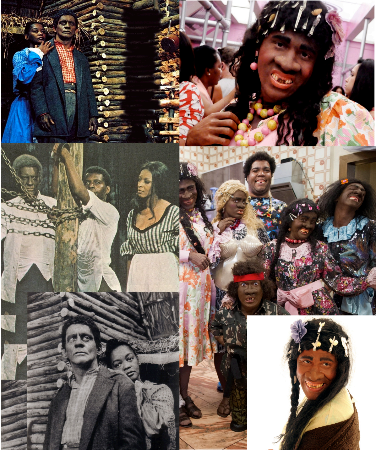
Imagens da esquerda: cenas da telenovela “A Cabana do Pai Tomás” exibida pela rede Globo em 1969; Imagens da direita: cenas do programa “Zorra Total” exibido pela rede Globo em 2013.