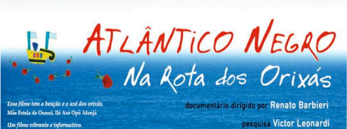
Cartaz do documentário "atlântico negro: na rota dos orixás" (Barbieri, 1998).