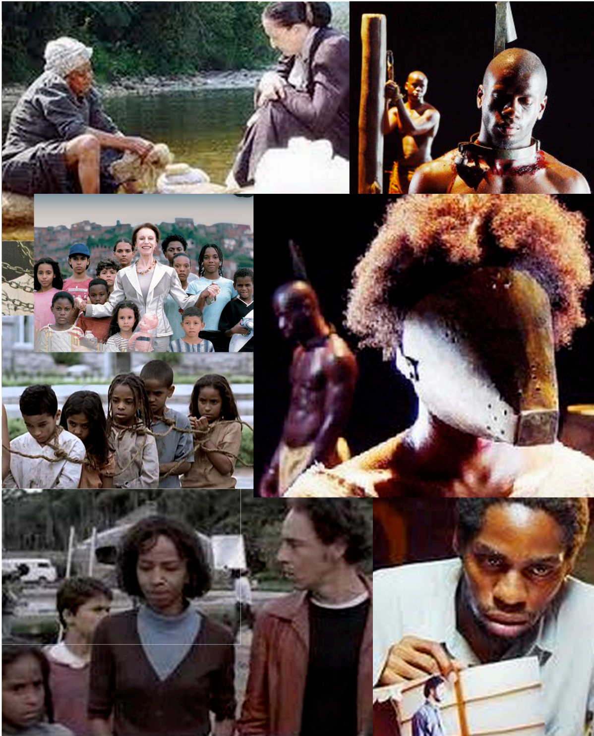
Cenas do filme Quanto Vale ou é por Quilo? (2005), produzido pelo diretor Sergio Bianchi.