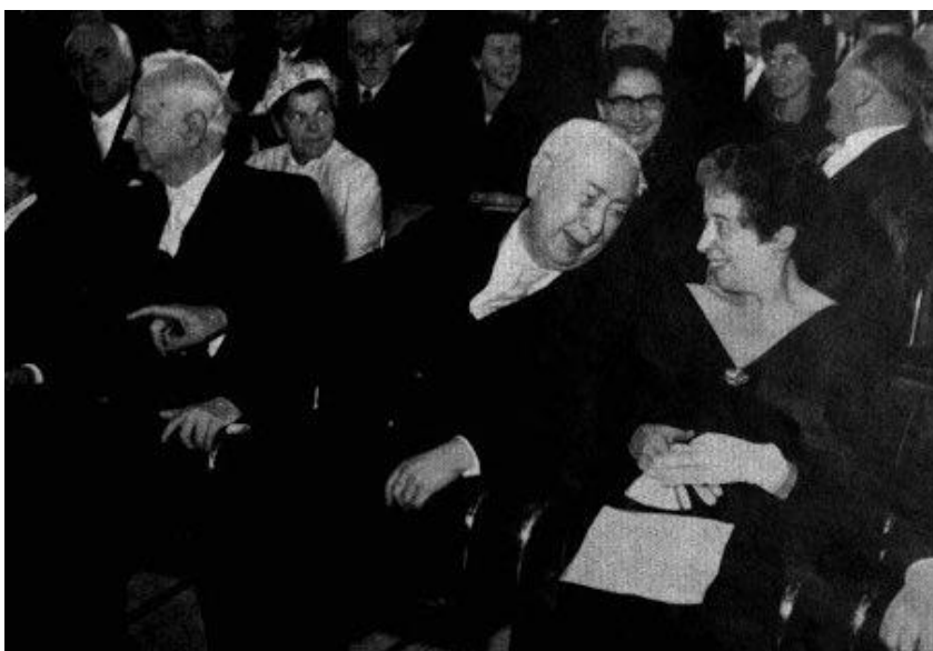
Figura 2: Karl Jaspers e Hannah Arendt