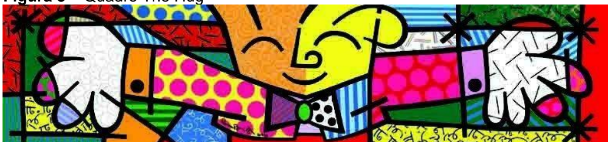
Figura 3 – Quadro The Hug

Fonte: Romero Britto (2013). Disponível em: https://www.ebiografia.com/romero_britto/