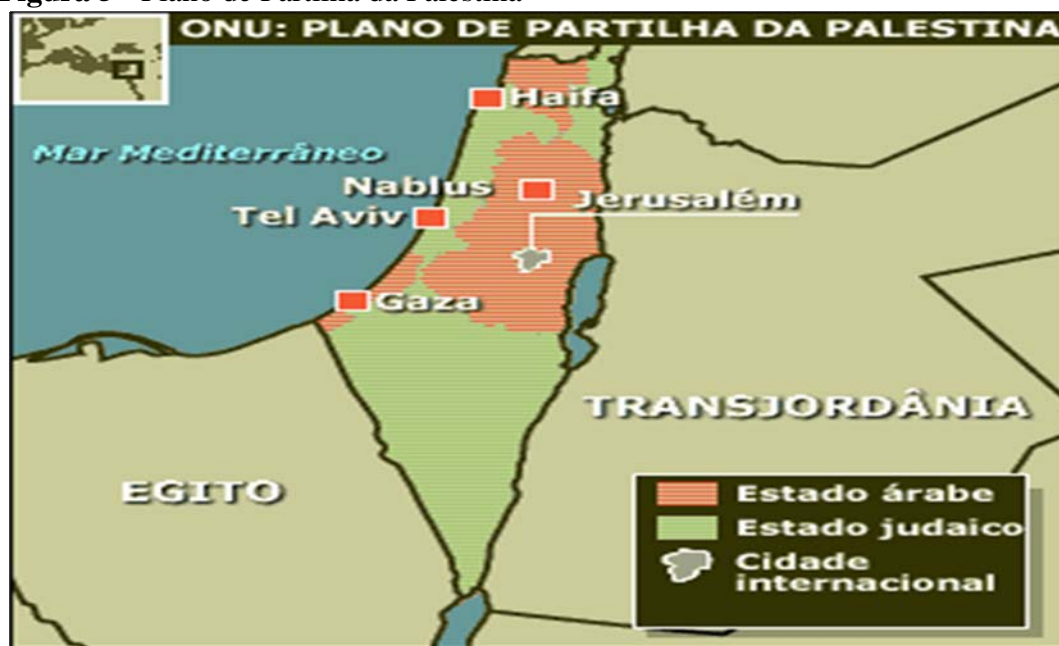
Figura 5 - Plano de Partilha da Palestina

Não podendo deter a imigração clandestina de judeus, Londres encaminhará à ONU a Questão Palestina em 1947. As Nações Unidas elaboram então um plano de partilha, pelo qual o território passaria a abarcar um Estado judeu e outro árabe. O judeu, com 14 mil Km 2 , incluindo a Galileia Oriental, a faixa que vai de Haifa a Telaviv e a região do deserto de Negueve até o Golfo de Ácaba; o Árabe, com 11 mil Km 2 , incluindo a Cisjordânia e a faixa de Gaza; e Jerusalém teria status internacional. A Figura 5 apresenta o mapa com a visualização geográfica de tal plano: