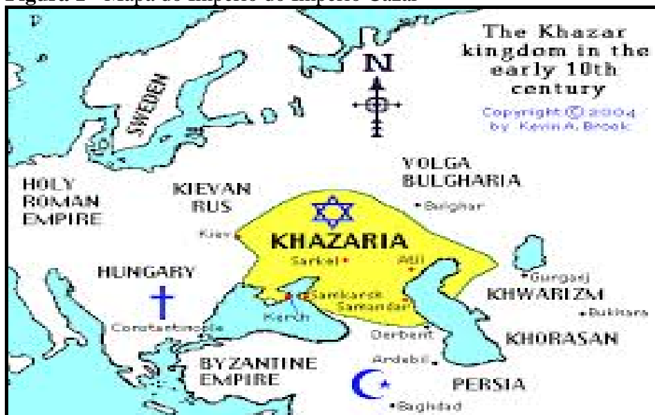
Figura 1 - Mapa do Império do Império Cazar