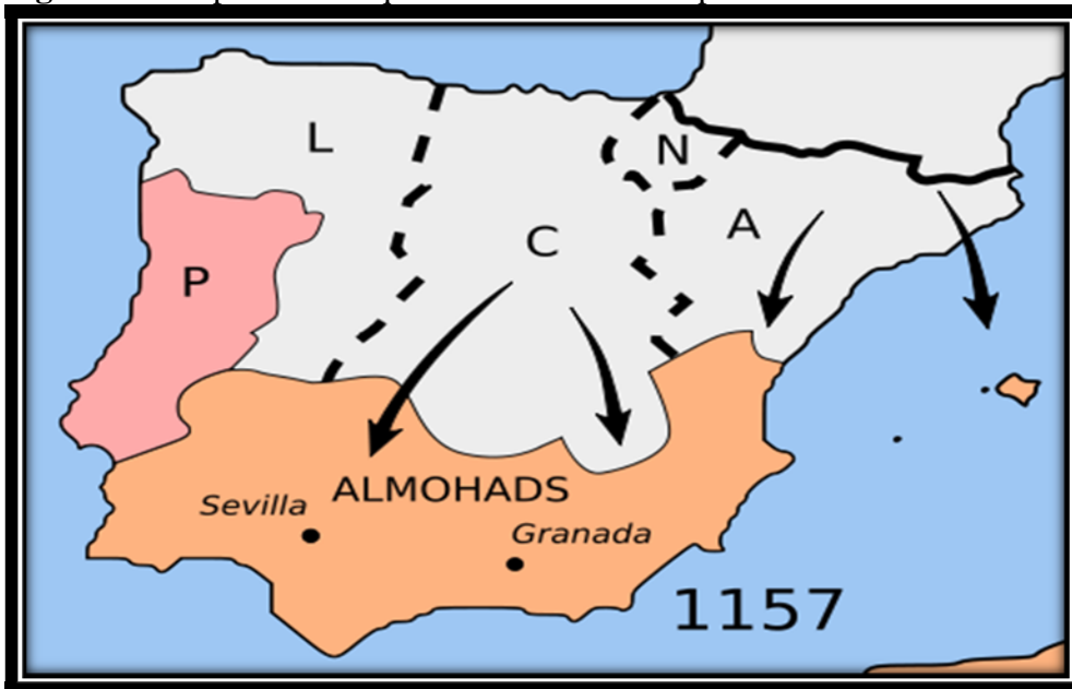
Figura 3 – Mapa da reconquista cristã sobre o império dos Almóadas