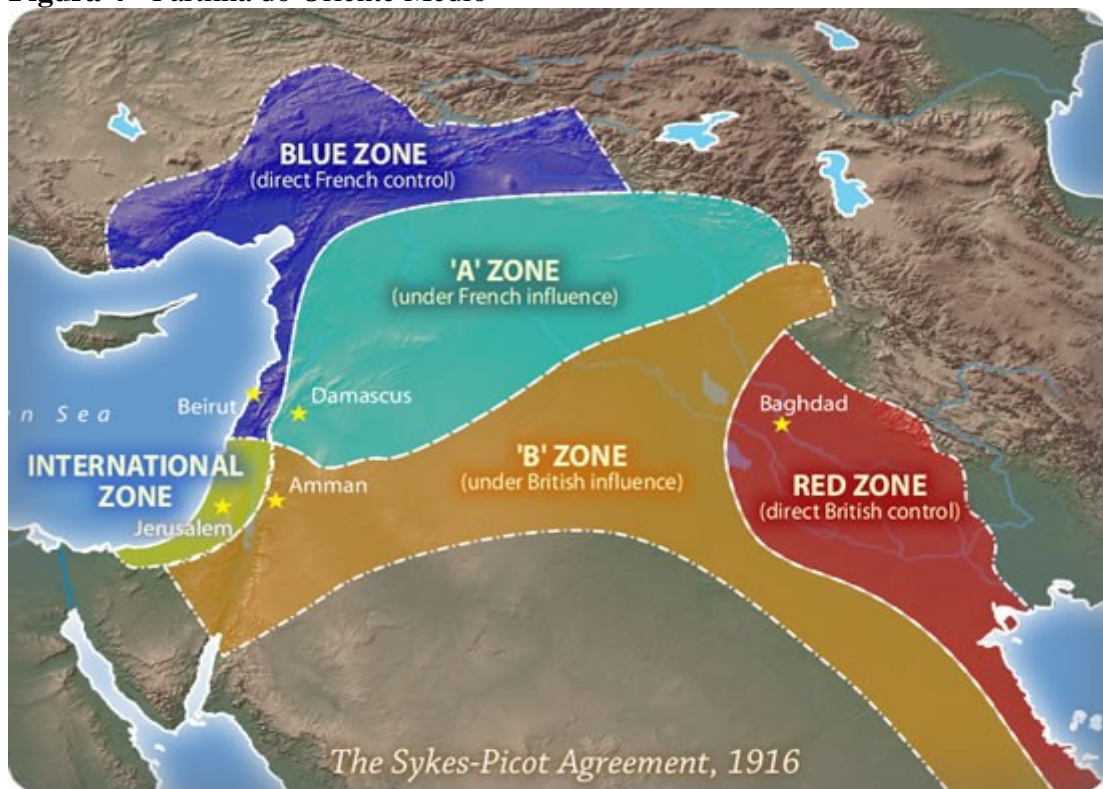
Figura 4 - Partilha do Oriente Médio

Interessante observar a enormidade territorial que a Inglaterra e a França, secretamente por meio desse acordo, outorgaram a si do ainda moribundo Império Otomano. No mapa a seguir (Figura 4), podemos verificar as regiões que, pelo plano, estariam diretamente sob o controle dessas potências, além de outras que também estavam sobre sua influência hegemônica.