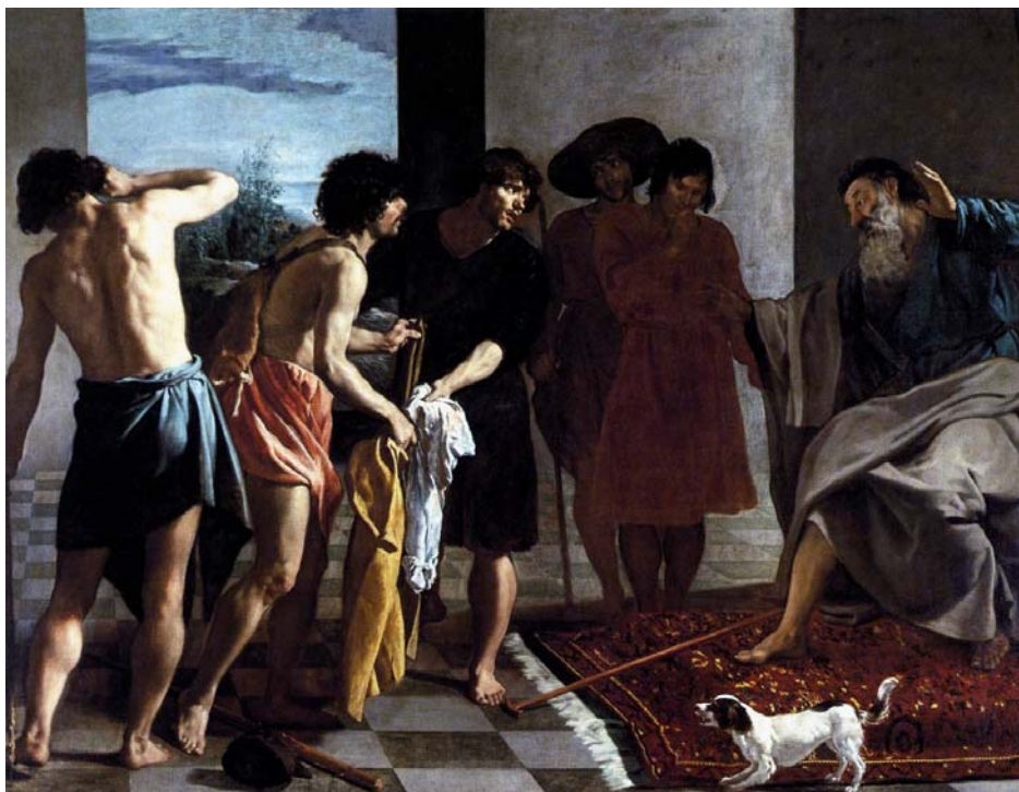
Fonte: Óleo sobre tela, 223 x 250 cm Monasterio de San Lorenzo