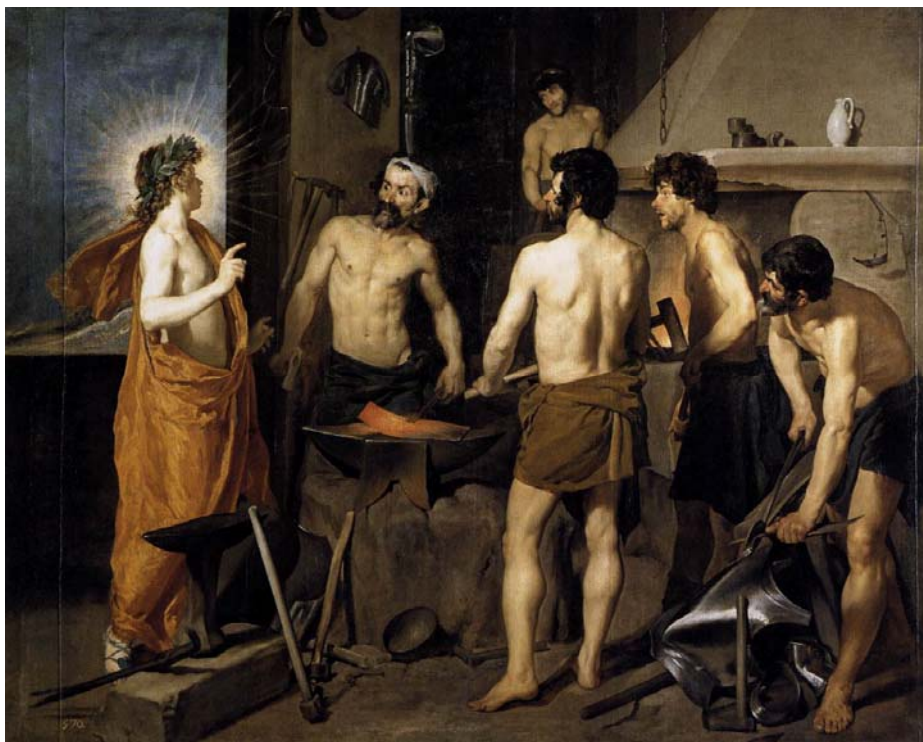
Fonte: Óleo sobre tela, 223 x 290 cm Museo del Prado, Madrid