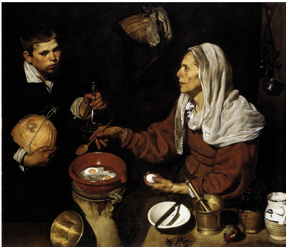
Fonte: Óleo sobre tela, 101 x 120 cm National Gallery of Scotland, Edinburgh

A obra do pintor espanhol Diego de Velázquez sempre foi marcada por contrastes, sejam eles contrastes de luz, contrastes de temas e contrastes entre itens dentro de suas telas. O fato de utilizar-se do claro-escuro de Caravaggio pode remeter ao Tenebrismo, uma espécie de sub-corrente barroca, marcada pelo uso de contraste de luz, com áreas da tela com grande incidência de luz e outras áreas na mais completa escuridão.