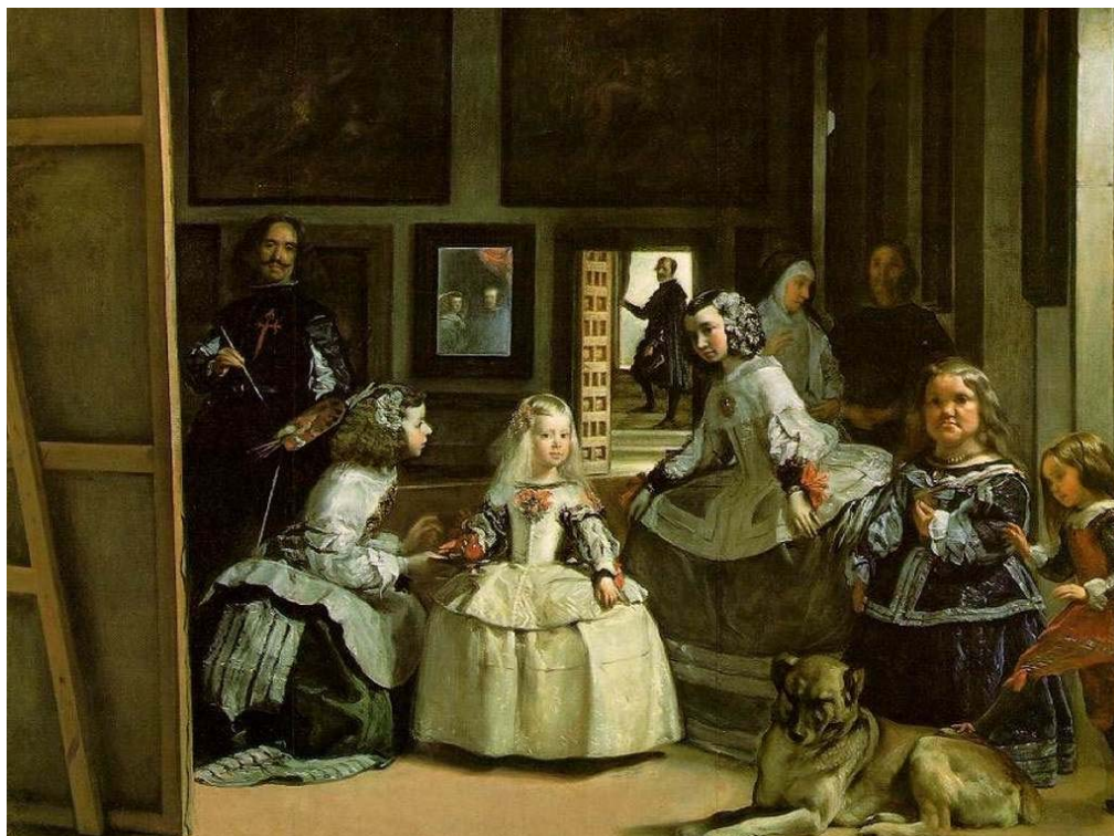
Fonte: Óleo sobre tela, 3,18 x 2,76 Museu do Prado, Madri

Para Foucault, a linguagem escrita possui critérios distintos da linguagem plástica. Em outras palavras, por mais elaborada que seja uma descrição longa e detalhista a respeito de um quadro, esta não é capaz de subtrair da obra de arte a sua essência. Ou seja, nomear elementos ou tentar rastrear a técnica de um artista como Velázquez não faz com que se obtenha a verdade sobre ele ou suas obras.