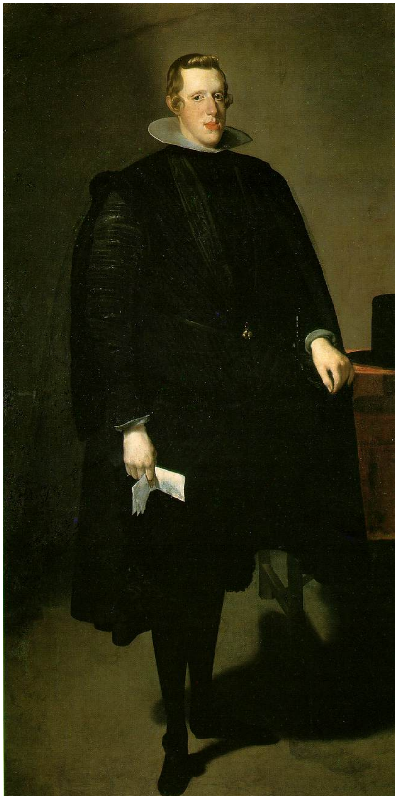
Fonte: Óleo sobre tela, 210x 102 cm Museu do Prado, Madri