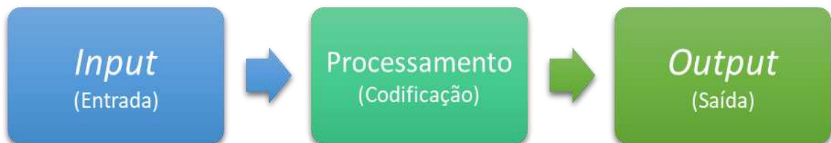
Figura 1 - Fluxo da informação no sistema de input, processamento e output.

Para Eysenck e Keane (2017), essa analogia é estabelecida ao comparar o processamento das informações pelos computadores ao processamento das informações humanas em um sistema denominado input (entrada), processamento e output (saída). No momento em que o indivíduo focaliza sua atenção sobre a informação, ela é recebida dos sentidos, nos estágios cognitivos (iniciais) em um processo denominado de input . Enquanto os processos de armazenamento compreendem tudo o que acontece com os estímulos internamente no cérebro e podem incluir a codificação e a manipulação dos estímulos, ele interpreta a entrada usando sua memória de curto de longo prazo e decide o quê, quando, onde e como o aprendiz responde ou utiliza a informação. Já o output envolve a ação ou ações que respondem à situação. Esse fluxo pode ser observado na Figura 1 a seguir: