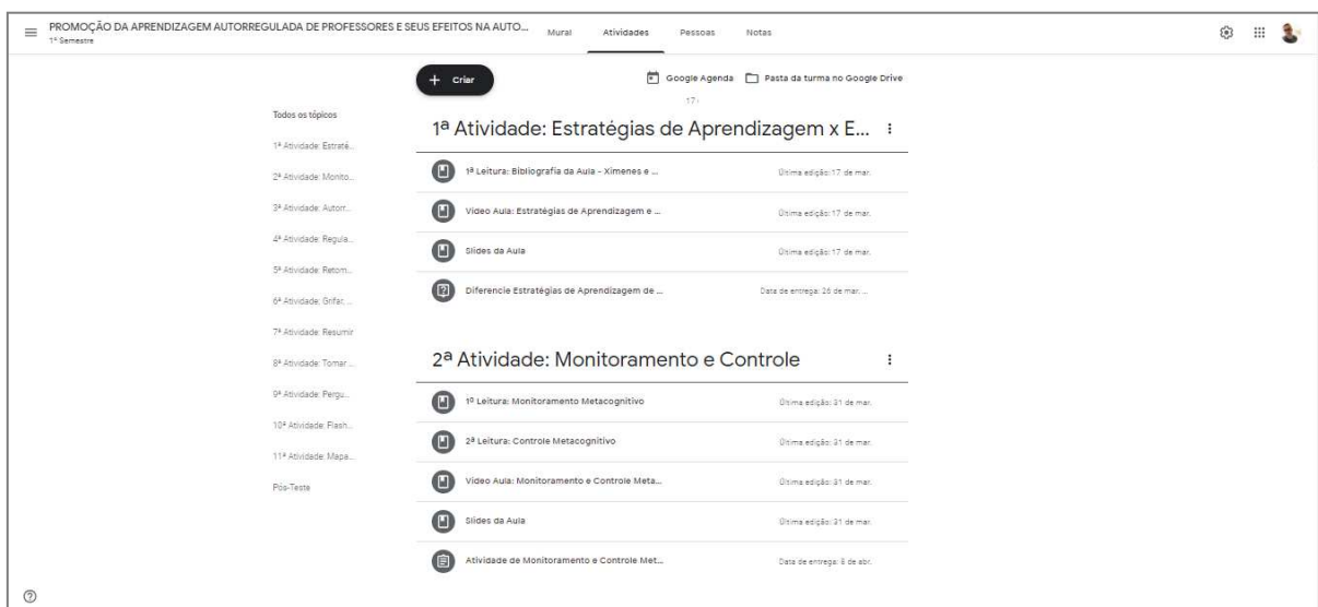
Figura 3 - Modelo de Organização do Google Classroom para as aulas a distância.