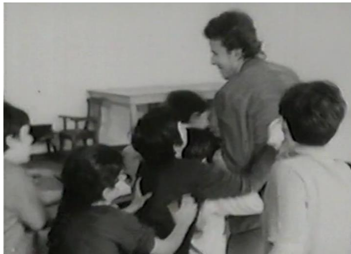
Figura 10 - Estudantes promovem um ato de rebeldia em sala de aula e atacam o professor