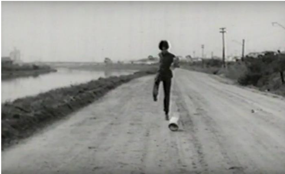
Figura 9 - Cena do filme Meio-dia , de Helena Solberg - A