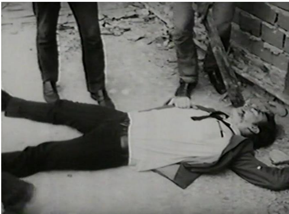
Figura 11 - Cena do filme Meio-dia , de Helena Solberg - B

Esse mesmo professor sai de um dos anexos da escola e vai até o pátio, onde alguns alunos e alunas estão posicionados. Novamente emparedado pelos estudantes, ele é morto no confronto. Uma mulher adulta é vista, mas é poupada pelo grupo. “É proibido proibir” 37 , canção de Caetano Veloso, da qual só tínhamos ouvido alguns compassos iniciais, é amplificada e embala diversas cenas de crianças correndo, brincando e dançando. Na sequência, as vidraças do colégio são quebradas.