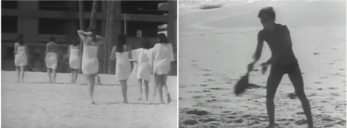
Figura 6 - Diferença na exploração dos corpos dos banhistas dos gêneros masculino e feminino em cenas do filme A entrevista , de Helena Solberg