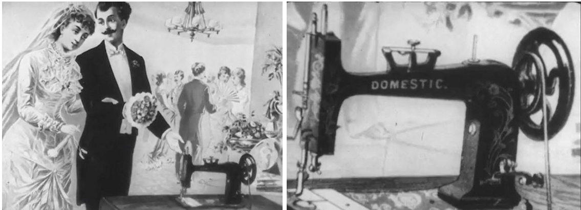
Figura 14 – Frame de A nova mulher / Presente de casamento