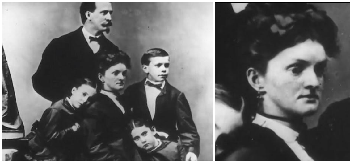
Figura 13 – Frame de A nova mulher / Mãe ao centro com a família