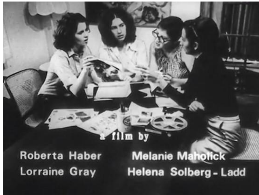
Figura 15 – Frame de A nova mulher / Créditos iniciais