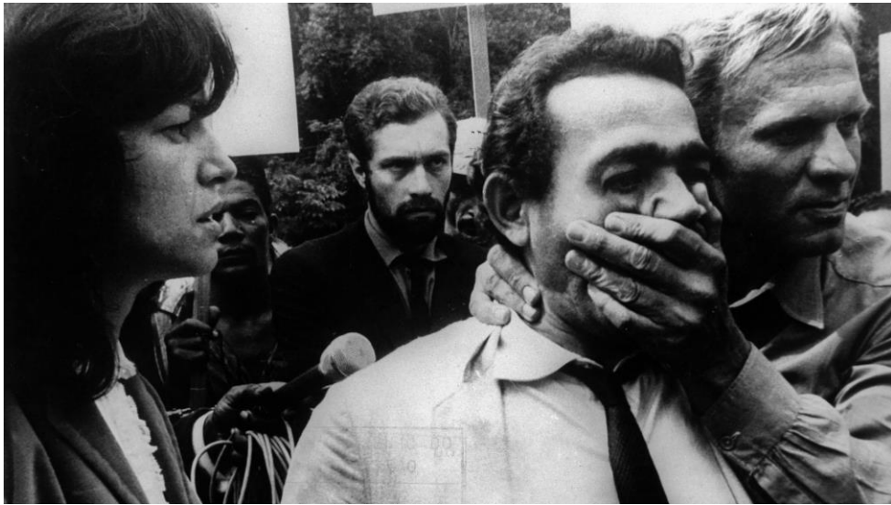
Figura 4 - Cena de Terra em transe , de Glauber Rocha