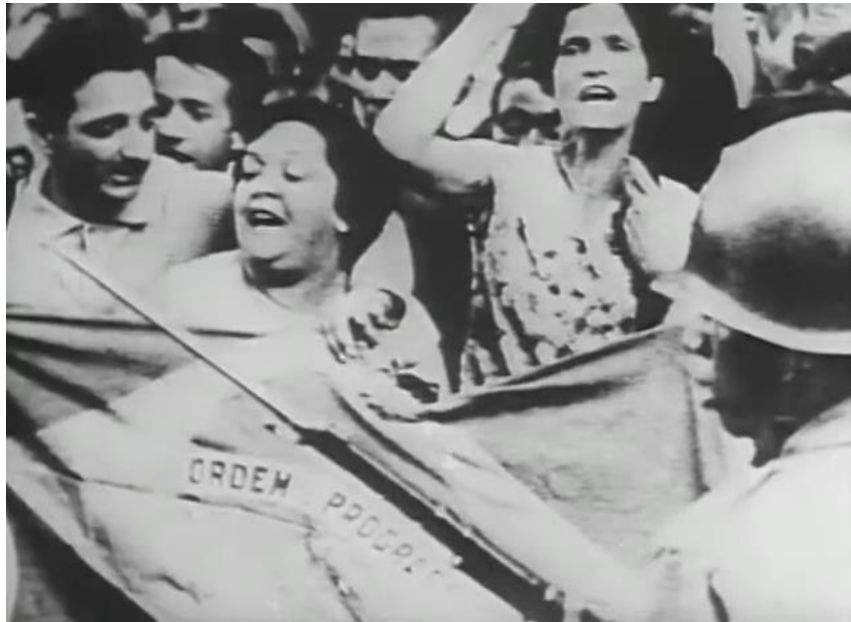
Figura 8 - Cena do filme A entrevista , de Helena Solberg - B