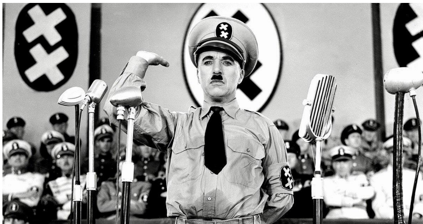
Figura 2 - Cena do filme O Grande Ditador , de Charles Chaplin

Simões (1999), foi a proibição de O Grande Ditador , de Charlie Chaplin, lançado em 1940. O pesquisador identifica que a sátira antiditatorial de Chaplin, ainda que obviamente endereçada a Hitler e à Alemanha nazista, atacava o regime brasileiro por tabela e feria o código de regras estipulado pelo órgão da censura. Para justificar sua análise, Simões (1999, p. 28) cita as objeções feitas pelo então diretor da DIP, major Coelho dos Reis, que considerava algumas cenas “definitivamente comunistas e desmoralizadoras da Forças Armadas”.