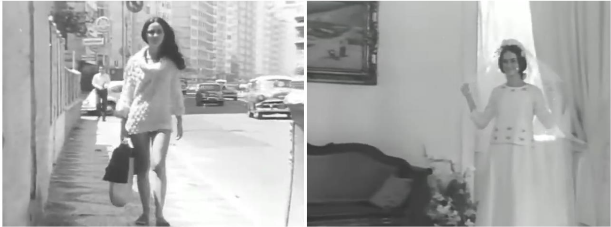
Figura 7 - Contraste dos modelos e comprimento dos vestidos nas cenas em que a personagem desfila pela rua (esq.) e quando está prestes a subir ao altar (dir.)