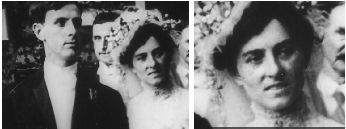
Figura 12 – Frame de A nova mulher / Noiva com cara de desprezo

continham heroína e morfina para escapar de suas existências tediosas”. É aí que a comicidade se esvai e A nova mulher volta à sobriedade.