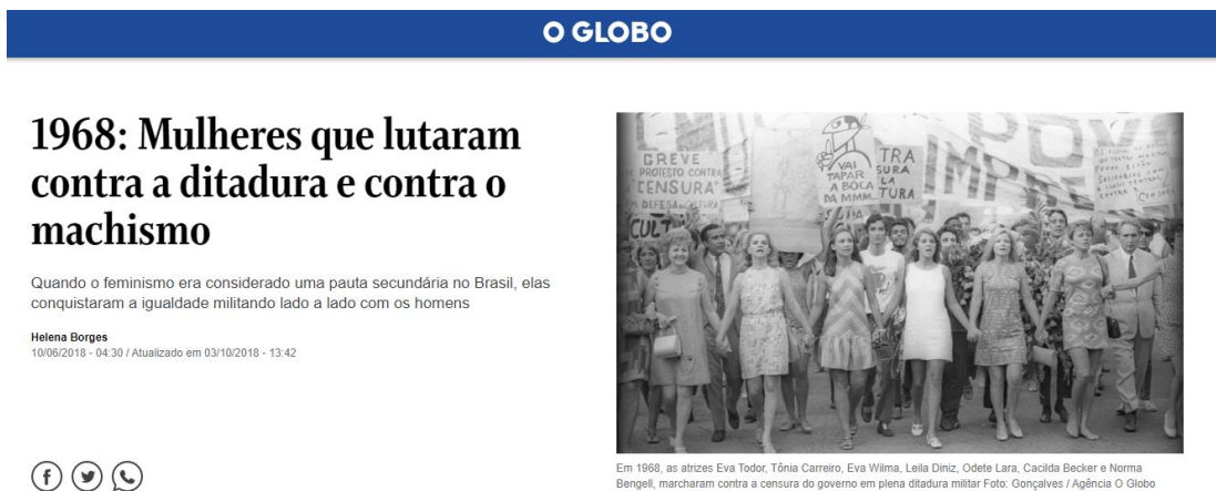
Figura 17: O uso midiático da fotografia.