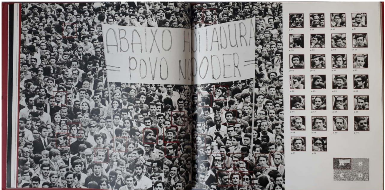
Fotografia: Evandro Teixeira. Fonte: 1968 destinos 2008: Passeata dos 100 Mil (2007).