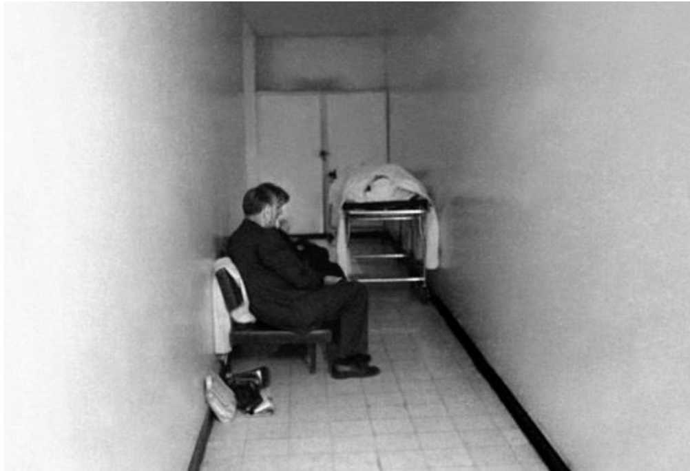
Fonte: Vou Viver (Tributo a Pablo Neruda em fotos de Evandro Teixeira, 2005).