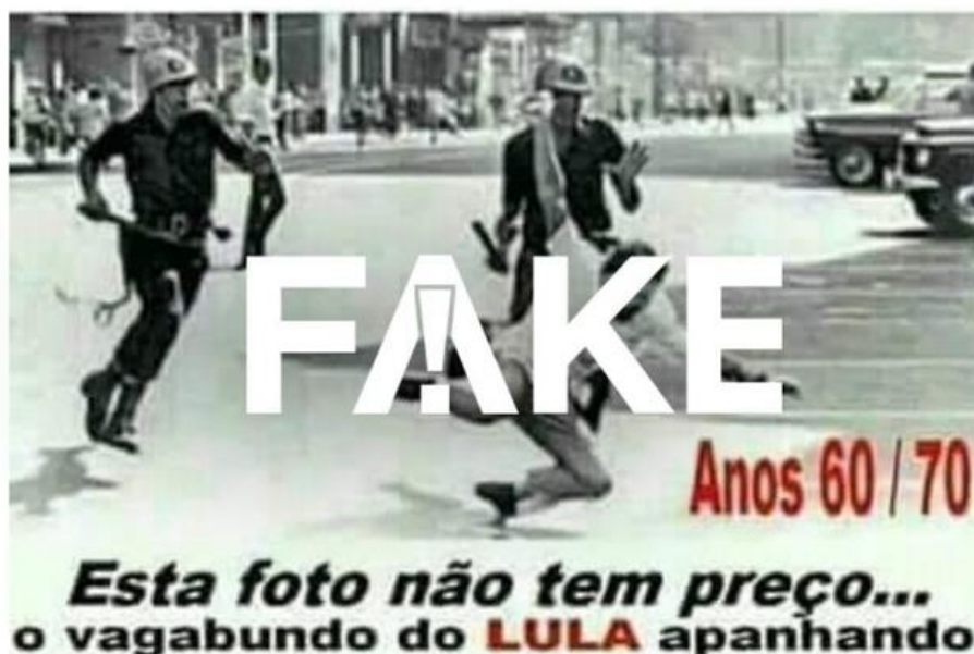
Figura 11: Fotografia de Evandro Teixeira associada a fake news .