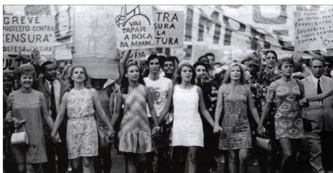
Passeata dos 100 Mil