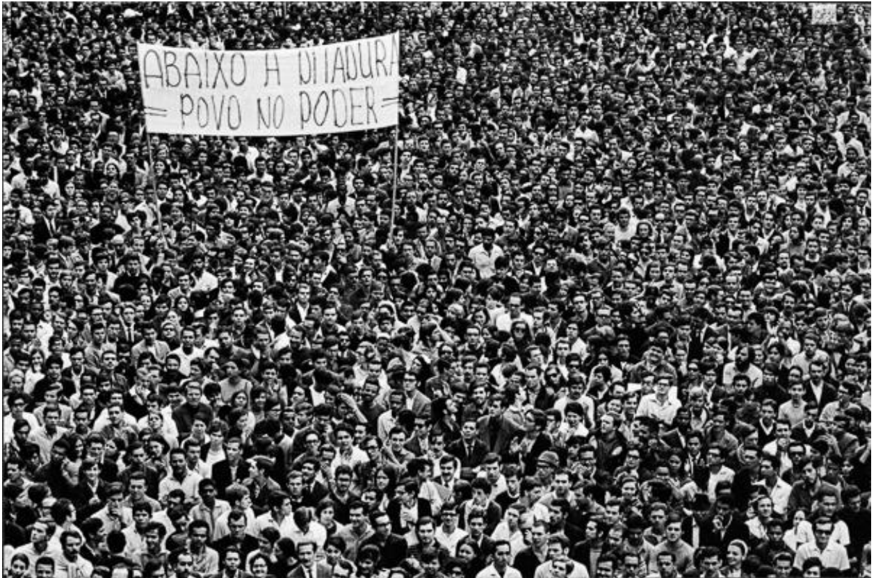
Figura 12: Passeata dos 100 Mil, Rio de Janeiro, 1968.