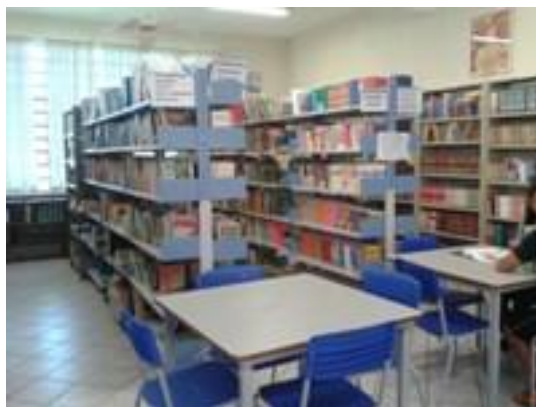
Figura 23 – Acervo e mesas de estudo