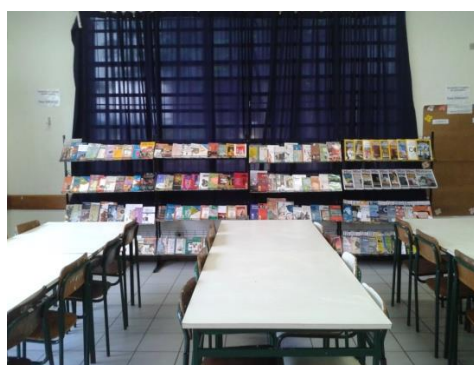
Figura 14 – Estantes expositivas