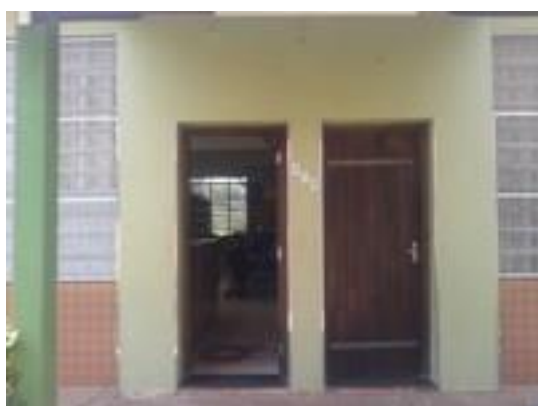
Figura 5 – Porta de entrada da biblioteca