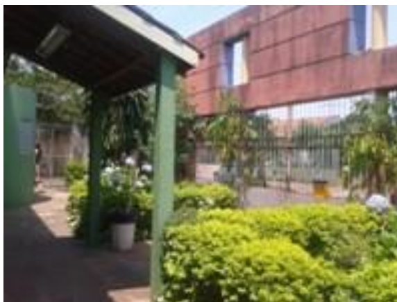
Figura 7 – Portão de acesso à comunidade

O acervo é registrado em livro próprio, mas não conta com um sistema de catalogação. Há outro banheiro no fundo da sala que é utilizado pelos funcionários da biblioteca. A iluminação e a ventilação do local são adequadas. Na época em que foi concebida, a biblioteca tinha como proposta atender à comunidade do bairro, portanto, existe um portão de acesso à comunidade com portal, mas esse atendimento nunca se efetivou.