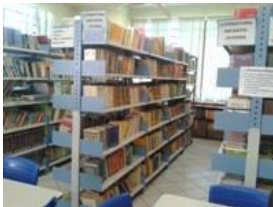
Figura 22 – Estantes com acervo