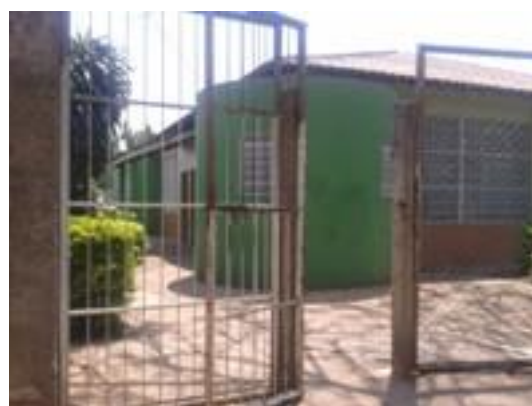
Figura 6 – Portão de separação das saldas