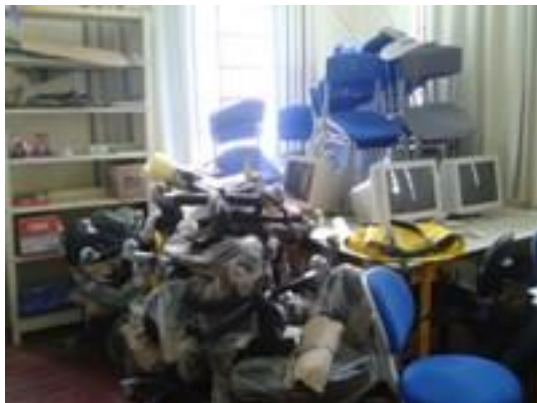
Figura 28 – Depósito