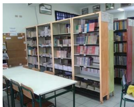
Figura 15 – Estantes com acervo