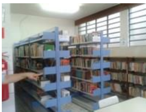
Figura 19 – Estantes com acervo de literatura