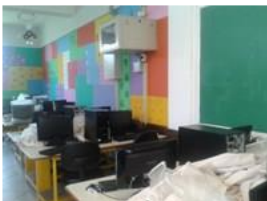
Figura 3 – Computadores