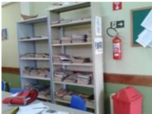
Figura 10 – Estante de livre acesso