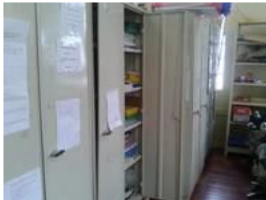
Figura 29 – Armários para documentos