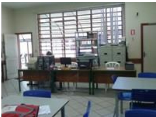
Figura 21 – Balcão de atendimento