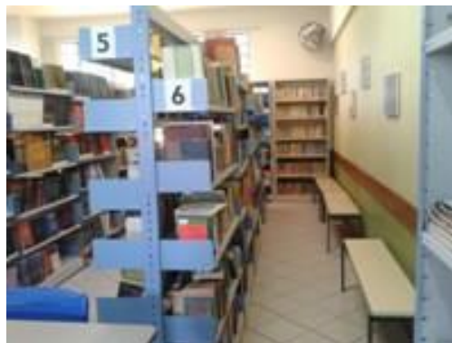
Figura 11 – Estantes com acervo