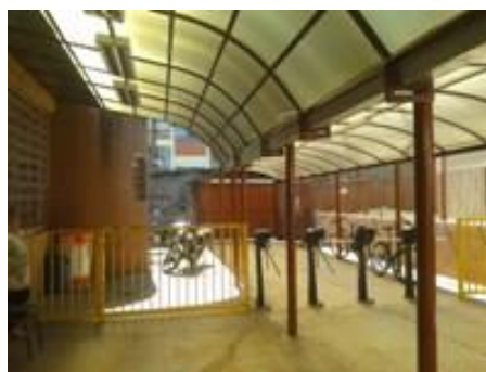
Figura 20 – Portão de entrada

local. A escola ocupa toda a quadra e a biblioteca está localizada no meio da quadra do lado esquerdo do portão principal desativado. Na frente localiza-se cantina e o refeitório, mais acima um bloco de salas de aula, que são as construções mais próximas. Há catracas para o acesso à escola, mas a biblioteca não é separada por grades.