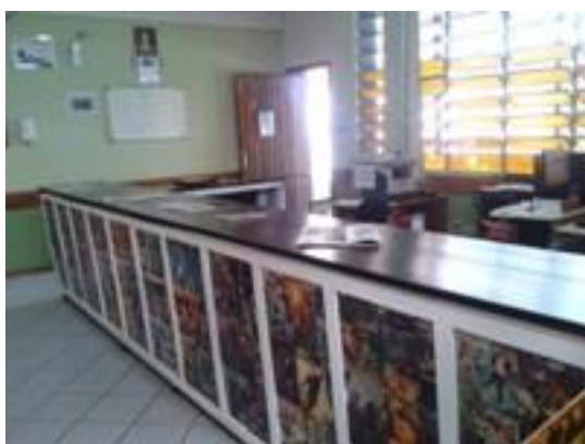
Figura 8 – Balcão de atendimento