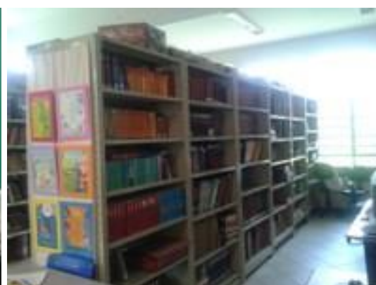
Figura 4 – Estantes do acervo