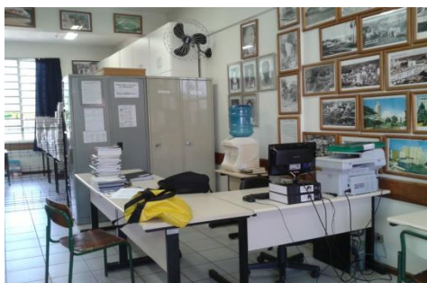
Figura 12 – Balcão de atendimento