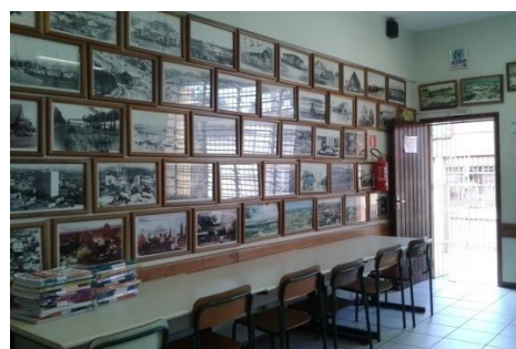
Figura 13 – Mesa de estudos e fotos