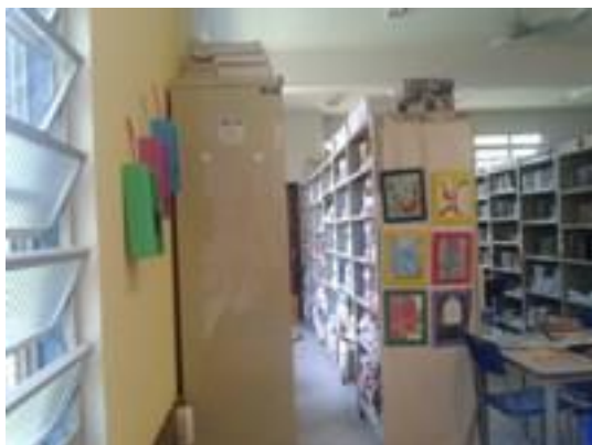
Figura 1 – Estantes e decoração

direito e nas laterais das estantes. Também nesta parede fica um armário de ferro com portas onde são guardados os títulos da Biblioteca do professor.