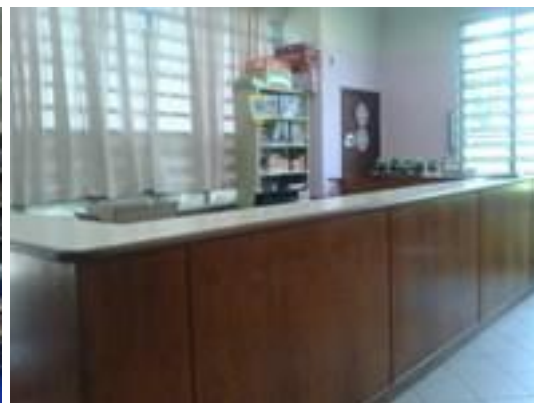
Figura 2 – Balcão de atendimento