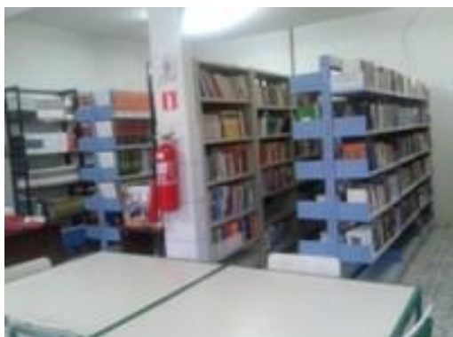
Figura 18 – Estantes com acervos outras áreas