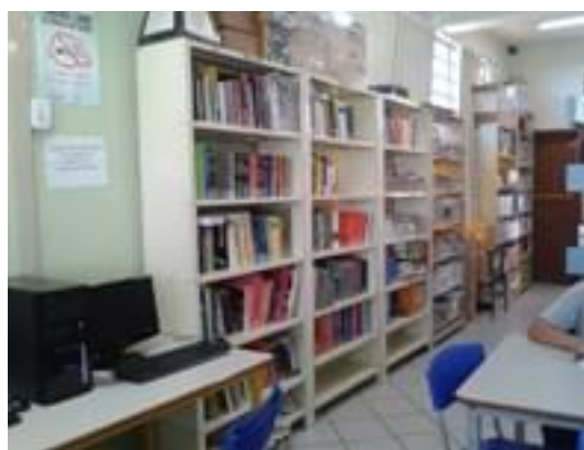
Figura 9 – Computador e acervo do professor