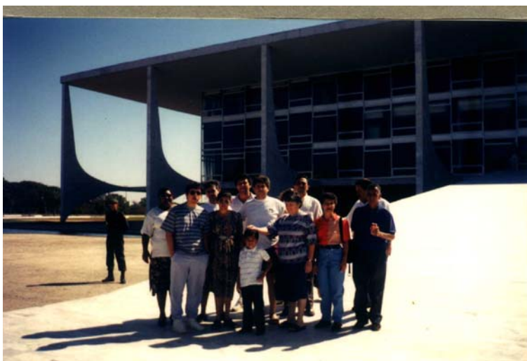
-Oficina de Capacitação de Lideranças em Brasília. (1995)