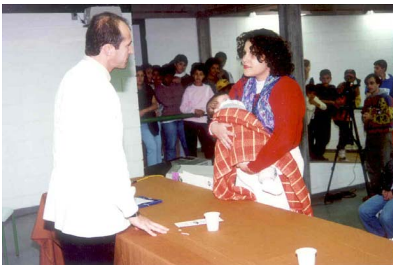
-Teatro Comunitário sobre os cuidados que as mães devem ter com os filhos recém nascidos. Sala de Eventos do CAIC (Centro de Atendimento Integrado a Criança), do Jardim União da Vitória, Zona Sul de Londrina. (1996)