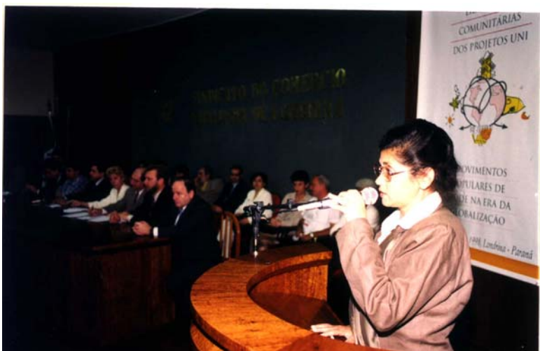
-Abertura do Congresso Internacional de Desenvolvimento de Lideranças Comunitárias em Londrina. (1998)