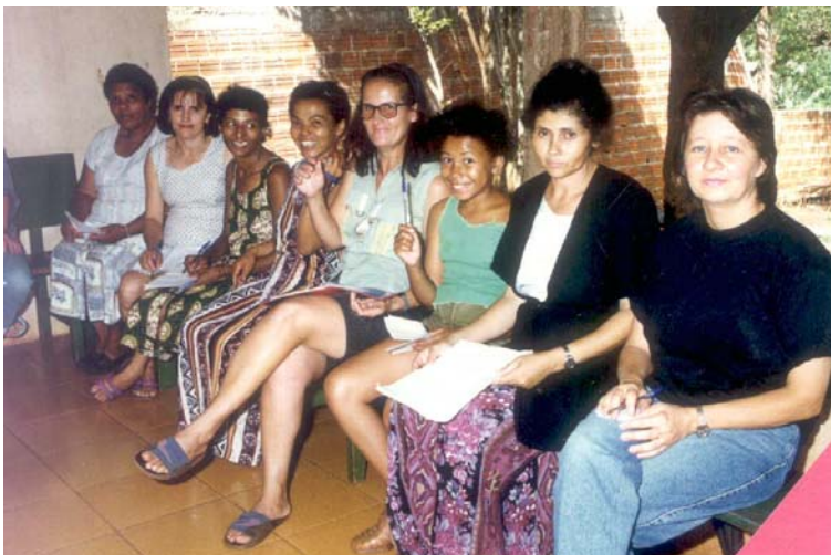
-Oficina: Auto-estima e Valorização do Corpo da Mulher, realizada na casa de uma moradora do Jardim Franciscato. (1995)