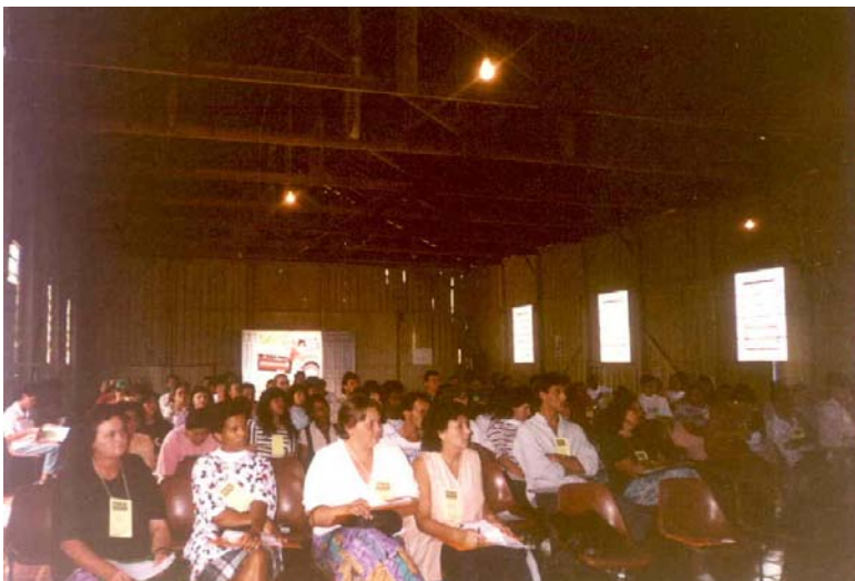
-Reunião para formação do Conselho Comunitário de Saúde do Distrito de Lerrovile, Londrina. (1997)