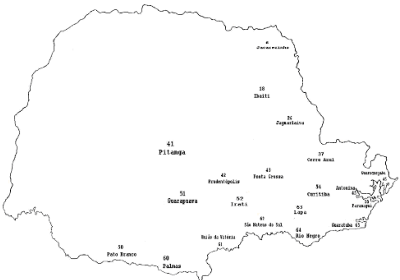
Figura 1 – Os 20 pontos Lingüísticos selecionados para a pesquisa

reduzimos a investigação a 20 pontos ao escolher aqueles correspondentes aos municípios pólo de cada microrregião pertencente ao Paraná Tradicional, conforme figura 1.