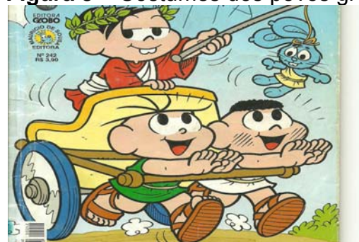
Figura 3 – Costumes dos povos gregos