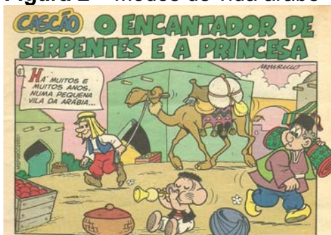
Figura 2 – Modos de vida árabe

Ao conceituar literatura, Bosi (1985) a trata como um instrumento que expressa aspectos culturais, ou seja, também reflete a cultura dos povos em suas narrativas por meio de diversos assuntos. Segundo os dizeres de Barbosa (2009, p. 94), “quando o sujeito-autor Maurício de Sousa retorna a determinados temas e figuras do passado para serem atualizados no presente”, fatos sociais dialogam com os enredos presentes nas HQs. Como exemplos há histórias que abordam modos de vida árabe (SOUSA, 1998); costumes dos povos gregos (SOUSA, 2006), dentre outros.