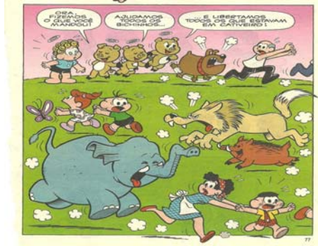
Figura 5 – Os três porquinhos