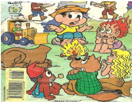
Figura 4 – Figuras folclóricas