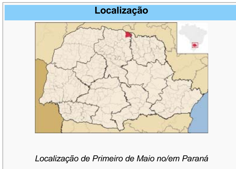
Figura 1 – Localização do município de Primeiro de Maio