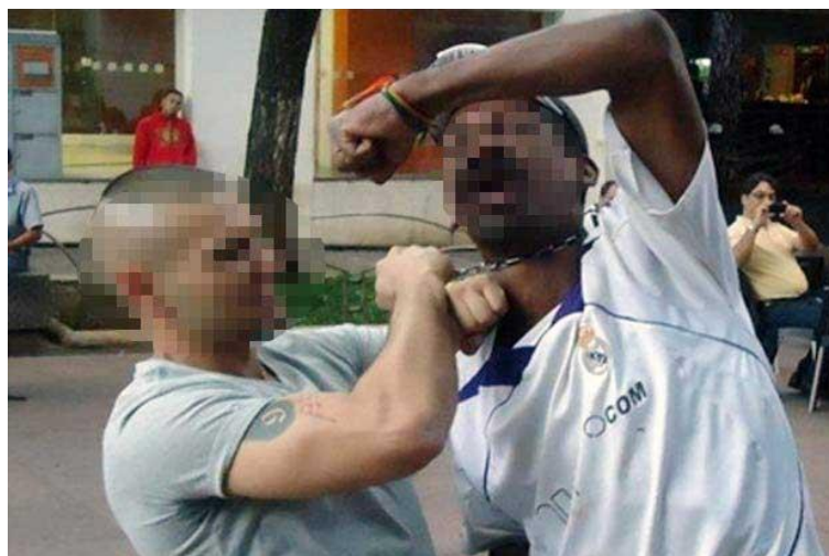
Figura 1. Skinhead enforcando homem em situação de rua.

Meses depois, no dia 23 de outubro de 2013, o jornal “Hoje em Dia” publicou uma reportagem informando que o mesmo skinhead havia conseguido liberdade judicial para deixar o sistema prisional 6 meses após o fato ocorrido (“Skinhead”, 2013b).