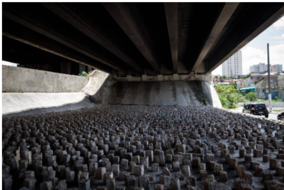
Figura 4. Paralelepípedos instalados sob o viaduto Antônio de Paiva Monteiro, no bairro do Tatuapé (zona leste de SP), no fim de 2020.