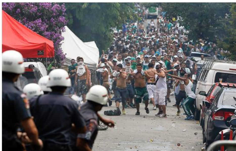
Figura 2. Briga entre homens torcedores de clubes de futebol.

Outra reportagem, desta vez publicada pelo jornal digital da “Folha de São Paulo” em 14 de janeiro de 2018, contém o seguinte título: “Na nossa espécie, violência e estupidez são coisa de homem, não de mulher”, seguido da seguinte imagem: