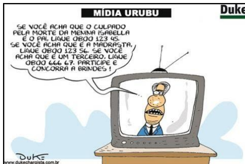
FIGURA Alexandre Aranha 14

Fonte: Blog Duke Chargista. Publicada em 14 de abril de 2008. Autor: Duke Disponível em: < https://leiamidia.wordpress.com/2008/04/14/midia-urubu/ >.