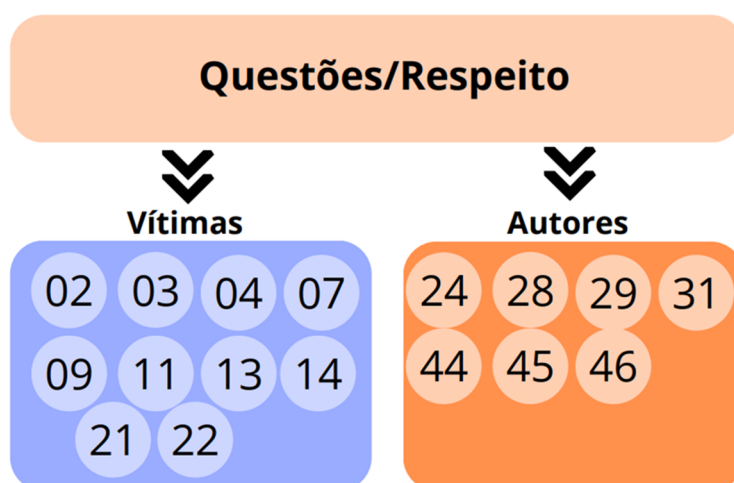
Figura 3 Questões referentes à temática respeito

Atenta ao bullying , a escola construirá possibilidades de proteger a todos de maneira igualitária, será intolerante às práticas de bullying , pois o sofrimento vivenciado por um estudante, reflete-se na escola como um todo. A Figura 3 a seguir, demonstra as questões da escala referentes ao eixo respeito e que demonstraram índice de significância ( p \leq 0,05 ) ao comportamento de bullying nas subescalas “vítimas e autores”.