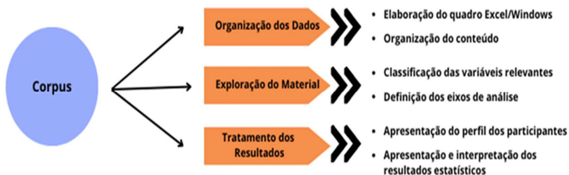
Figura 1 - Eixos de análise

A figura 1 apresenta uma proposta de organização dos eixos de análise.