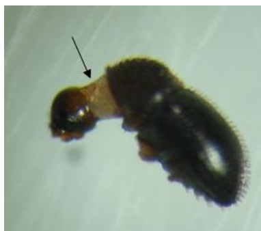
Figura 1. Adulto de H. hampei infectado por nematoides entomopatogênicos. A flecha indica o local de separação da cabeça do tórax, confirmando a morte do inseto por nematoide.

Foi possível observar ainda que, os adultos de H. hampei infectados por NEPs não apresentaram coloração típica de infecção para ambos os gêneros de nematoides. Isso pode ser explicado devido a coloração escura e cutícula bastante quitinizada que estes insetos apresentam. No entanto, uma característica observada para alguns adultos infectados, foi a separação da cabeça do tórax (Figura 1). Tal característica também foi observada por Benavides-Machado et al. (2010), tendo ressaltado o fato que, a causa desta separação é provavelmente, devido à pressão gerada pelo nematoide durante o seu desenvolvimento no interior do inseto.