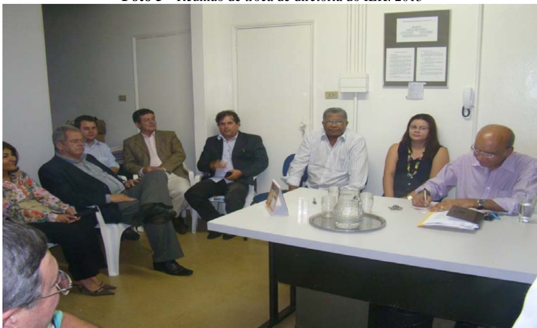
Foto 5 - Reunião de troca de diretoria do ILK. 2013