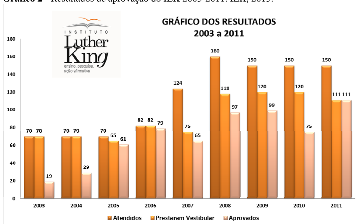
Gráfico 2 - Resultados de aprovação do ILK 2003-2011. ILK, 2013.

A instituição mantém um gráfico que anualmente é atualizado, com certa dificuldade, na medida em que muitos ex-alunos não informam sua aprovação, e cada vez é maior o número de alunos atendidos pela instituição, conseqüentemente aumenta também o número de alunos aprovados em Universidades públicas ou privadas. Os dados independem se o aluno matriculou-se ou não no respectivo curso de aprovação.