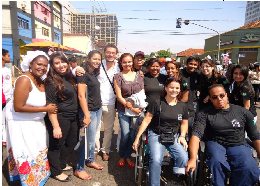
Foto 2 - Desfile 26 de agosto de 2012. Aniversário de Campo Grande.

Alguns eventos foram organizados no interior da instituição, em que, o foco não era apenas os alunos da instituição, em alguns nem eram de fato, mas visava-se uma aproximação do movimento negro, organizando oficinas, seminários e cursos; e em outros eventos, o ILK é convidado, como o caso exemplar do desfile de 26 de agosto. Este desfile no centro da cidade marca o aniversário de Campo Grande, em 2012 os 113 anos, no qual o ILK participou com seus alunos junto com a comunidade negra da cidade e algumas de suas manifestações culturais afro-brasileiras (Capoeira, comunidades quilombolas, etc.) e religiosas (Umbanda e Candomblé).