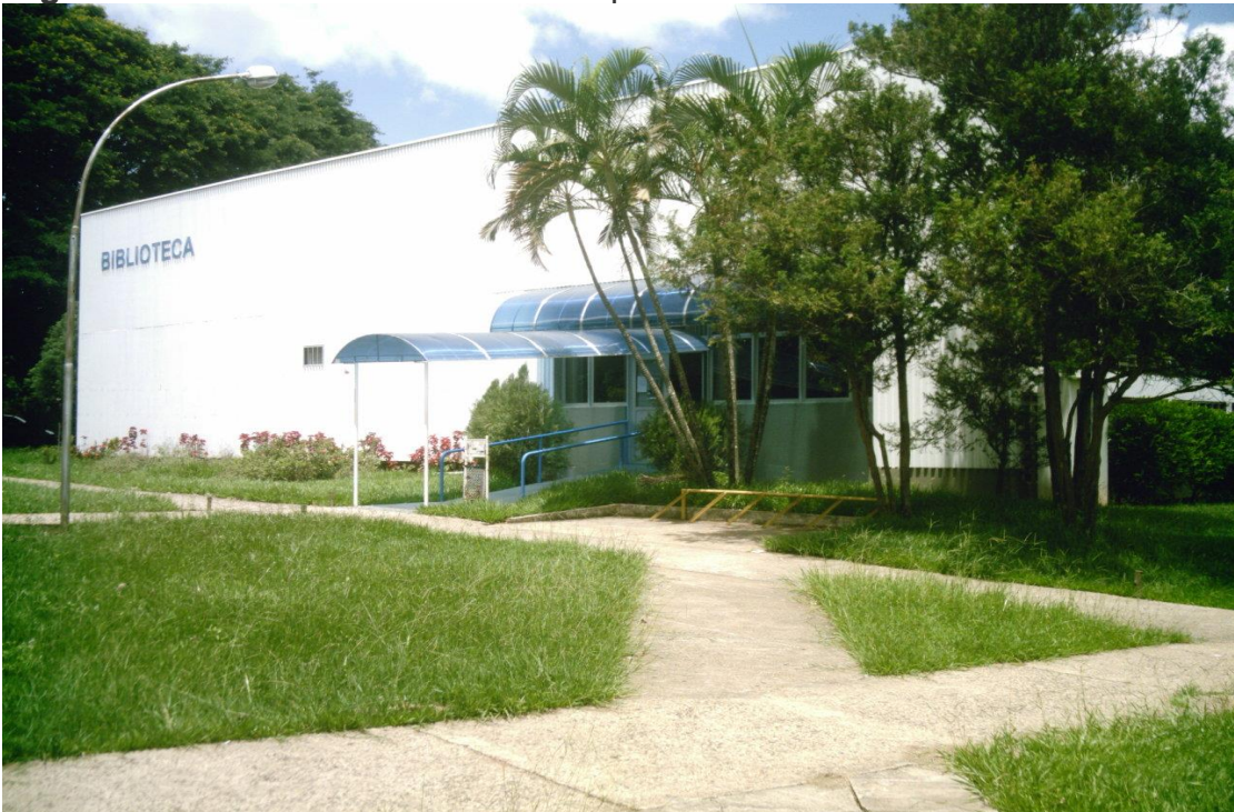
Figura 1 – Fachada da biblioteca campus Marília