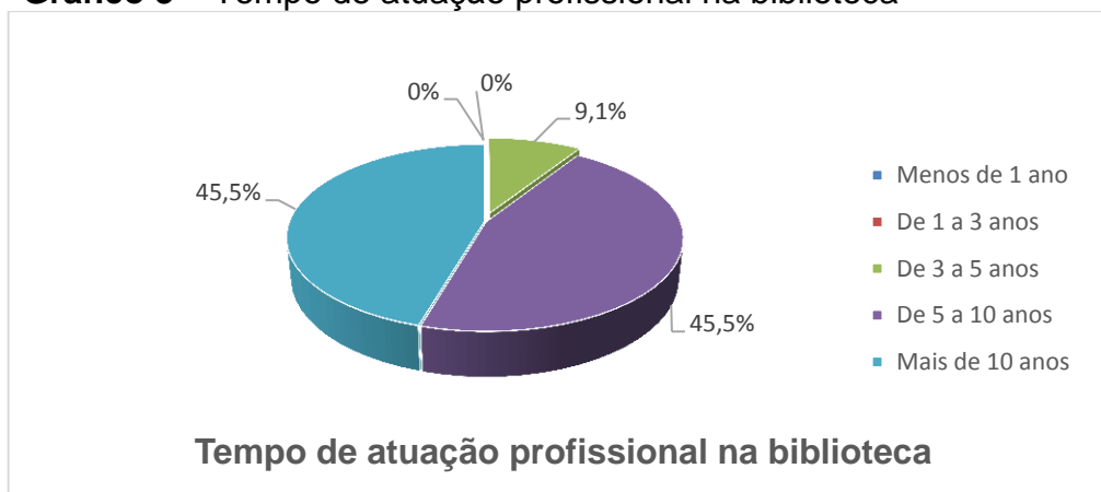
Gráfico 3 – Tempo de atuação profissional na biblioteca

O tempo de atuação profissional do bibliotecário na biblioteca, teve sua maior representação nas faixas de 3 a 5 anos e de 5 a 10 anos, conforme o Gráfico 3. Infere-se, com base no tempo de atuação, que os profissionais já têm experiência profissional para trabalhar em biblioteca universitária, além do que tal fato propicia a esses bibliotecários terem um domínio das práticas informacionais desempenhadas nas bibliotecas universitárias voltadas à mediação da informação e ao comportamento informacional. Assim, procuram melhor conhecer para atender às necessidades informacionais dos usuários da biblioteca em diferentes momentos.