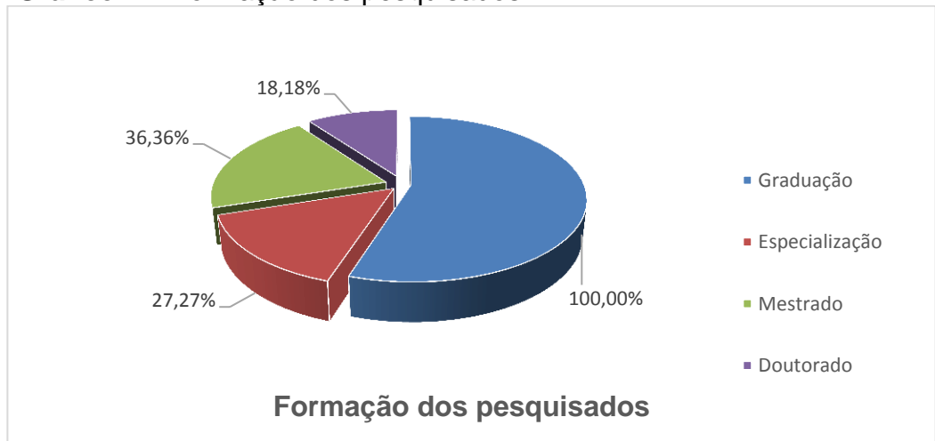
Gráfico 2 – Formação dos pesquisados