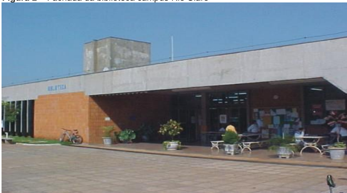
Figura 2 – Fachada da biblioteca campus Rio Claro