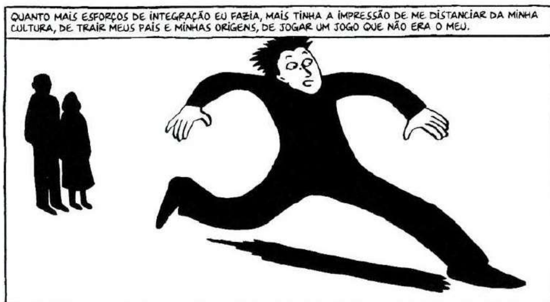
Figura 39 - A sensação constante de afastamento

Fonte: Persépolis (2007), Marjane Satrapi