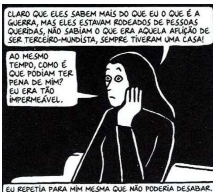
Figura 35 - A volta à realidade

Fonte: Persépolis (2007), Marjane Satrapi