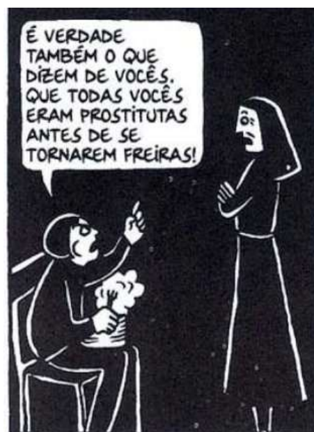
Figura 32- A resposta de Marjane

Fonte: Persépolis (2007), Marjane Satrapi