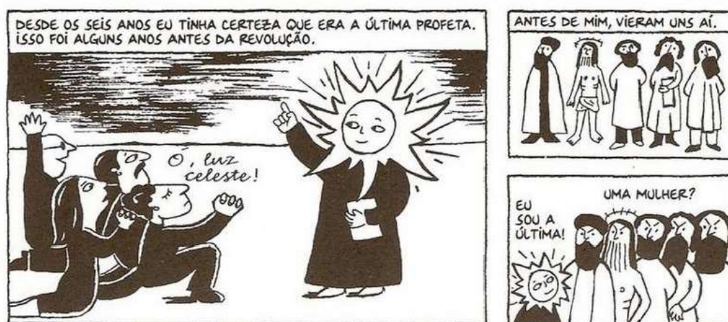
Figura 8 - Marji quer ser profeta

Fonte: Persépolis (2007), Marjane Satrapi