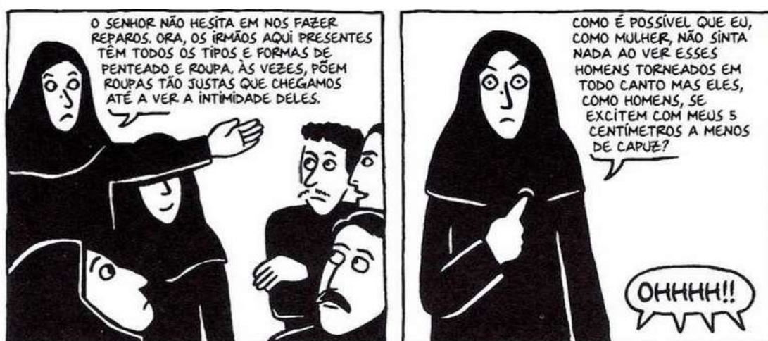
Figura 20 - O discurso de Marji

Fonte: Persépolis (2007), Marjane Satrapi