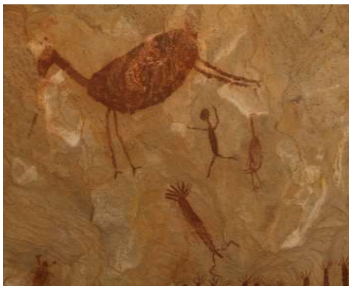
Figura 2 - Registros Rupestres