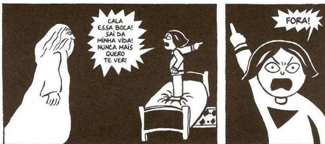
Figura 17- A expulsão de Deus

Fonte: Persépolis (2007), Marjane Satrapi