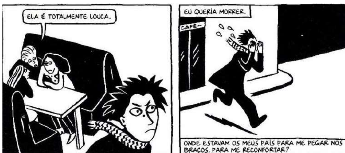
Figura 25 - Dificuldade de encontrar seu lugar

Fonte: Persépolis (2007), Marjane Satrapi