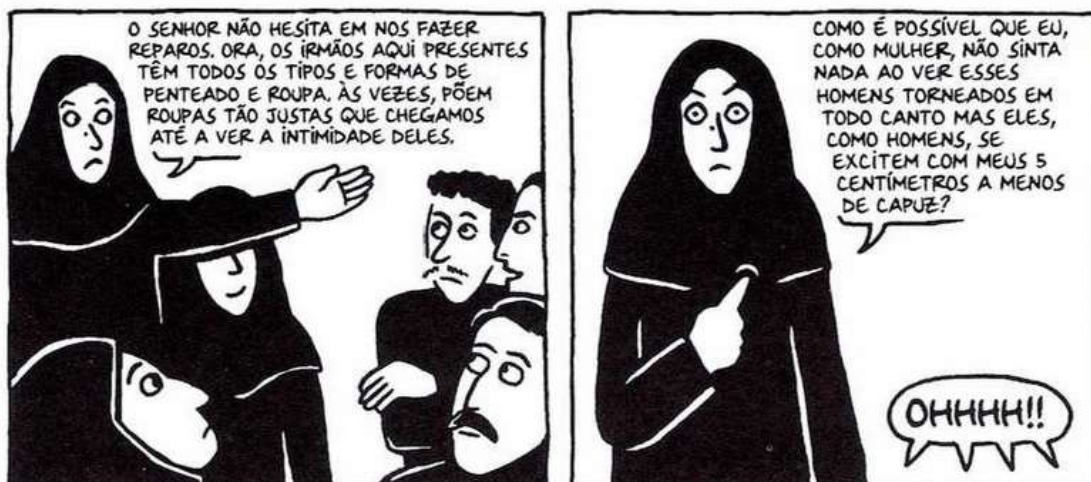
Figura 9 - Marjane argumenta contra o aumento do véu

Fonte: Persépolis (2007), Marjane Satrapi