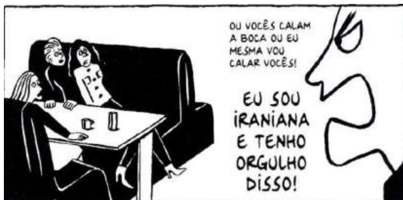
Figura 27 - Afirmação de Identidade

Fonte: Persépolis (2007), Marjane Satrapi