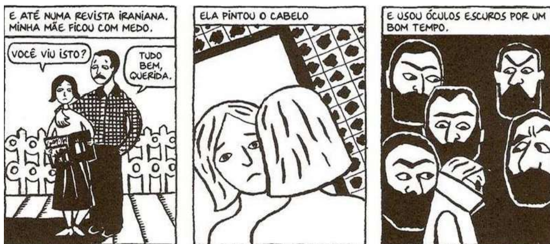
Figura 15 - O medo vivido pela mãe de Marji

Fonte: Persépolis (2007), Marjane Satrapi