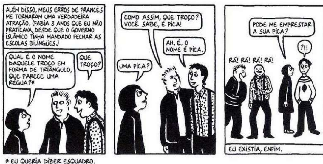
Figura 21 - Os colegas de Marji

Fonte: Persépolis (2007), Marjane Satrapi