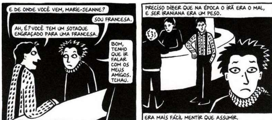
Figura 26 - Francesa

Fonte: Persépolis (2007), Marjane Satrapi