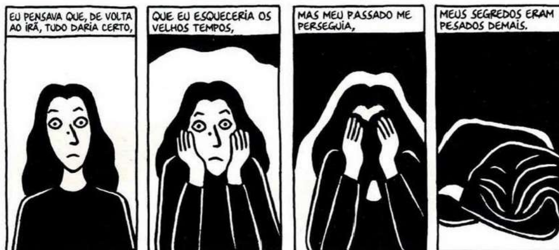
Figura 37 - Desestabilização de Marji

Fonte: Persépolis (2007), Marjane Satrapi