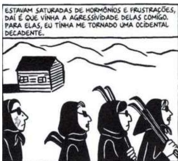
Figura 36 - As amigas de Marjane

Fonte: Persépolis (2007), Marjane Satrapi