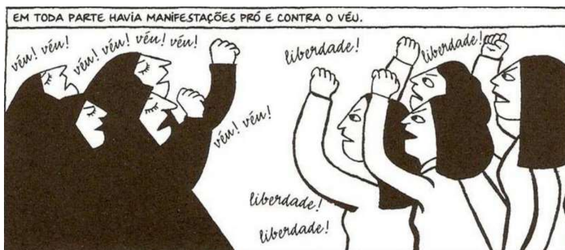
Figura 13 - Manifestação das mulheres

Fonte: Persépolis (2007), Marjane Satrapi