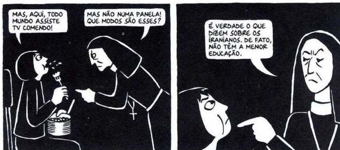
Figura 31- O pensamento das freiras

Fonte: Persépolis (2007), Marjane Satrapi