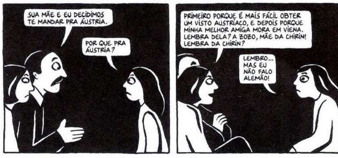
Figura 33- A decisão dos pais de Marji

Fonte: Persépolis (2007), Marjane Satrapi