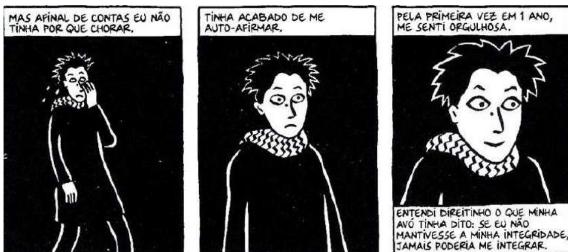
Figura 28 - O encontro consigo mesma

Fonte: Persépolis (2007), Marjane Satrapi