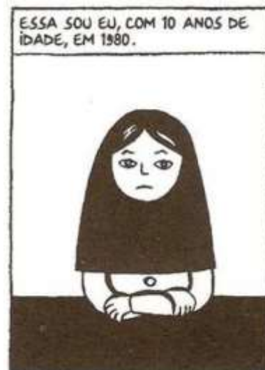
Figura 5 - Marji com 10 anos

A autora abre o caminho para pensarmos a relação entre imagem e escrita, sobre a importância de se criar algo que misture os dois e ainda tenha seu valor legitimado. Novamente, para Satrapi, deixar de lado um dos dois, quando se possui a habilidade para tal, pode parecer um desperdício (SATRAPI, 2003). Dito isso, ela escreve Persépolis e suas outras obras em formato de graphic novel , tal aprendizado, diz ela, teve de ser aprendido na prática da criação (SATRAPI, 2003), além de salientar o fato que por vezes quando encontra leitores de Persépolis , descobre em seus diálogos que eles nunca haviam lido HQs, mas que a partir da leitura de sua obra o interesse por quadrinhos foi despertado (SATRAPI, 2003).