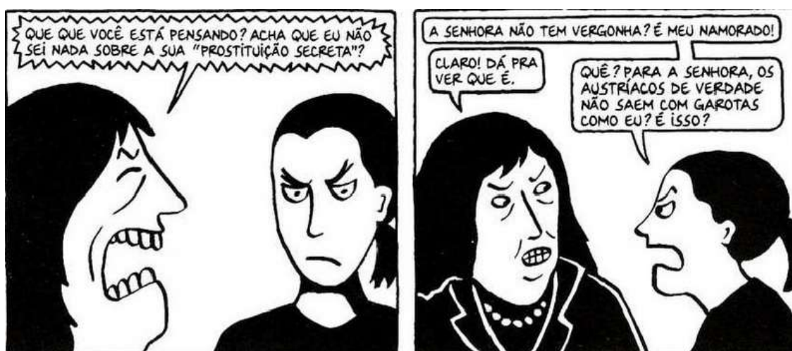
Figura 22 - "Prostituição Secreta"

Fonte: Persépolis (2007), Marjane Satrapi