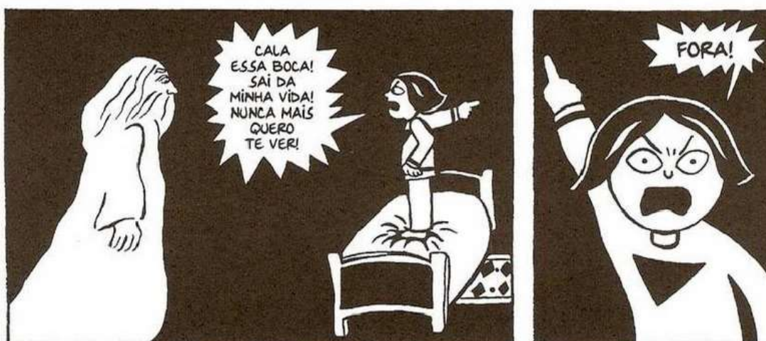
Figura 10 - Marji discute com Deus

Fonte: Persépolis (2007), Marjane Satrapi