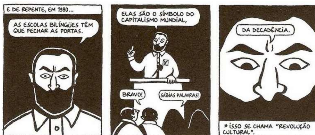
Figura 7 - Fechamento das escolas bilíngues

Fonte: Persépolis (2007), Marjane Satrapi