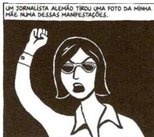
Figura 14 - Mãe de Marji é fotografada

Fonte: Persépolis (2007), Marjane Satrapi