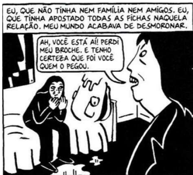
Figura 29 - Acusação de roubo

Fonte: Persépolis (2007), Marjane Satrapi