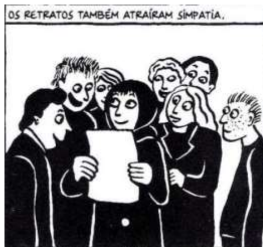
Figura 23 - As notas de Marji atraem atenção

Fonte: Persépolis (2007), Marjane Satrapi