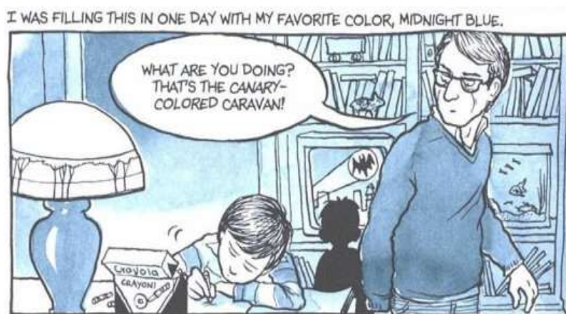
Figura 6 - Fun Home de Bechdel

A HQ mais famosa da autora é constantemente colocada ao lado de outras grandes histórias em quadrinhos também premiadas, tais como Maus de Spiegelman, que ganhou o prêmio Pulitzer em 1992 e Fun Home de Bechdel, que em 2006 foi eleito pela Time como livro do ano. Persépolis garantiu o prêmio de melhor história em quadrinhos na Feira de Frankfurt em 2004. E colocá-los juntos não é somente feito para validar as suas premiações, mas para lembrar a importância da atenção midiática que tais obras receberam e tem recebido cada dia mais, e com isto mostrar um significativo avanço em diminuir as barreiras que