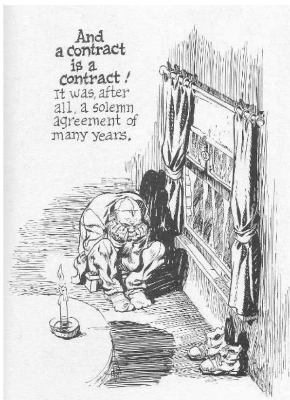
Figura 4 - Contrato com Deus de Eisner

Fonte: A Contract with God (1978), Will Eisner