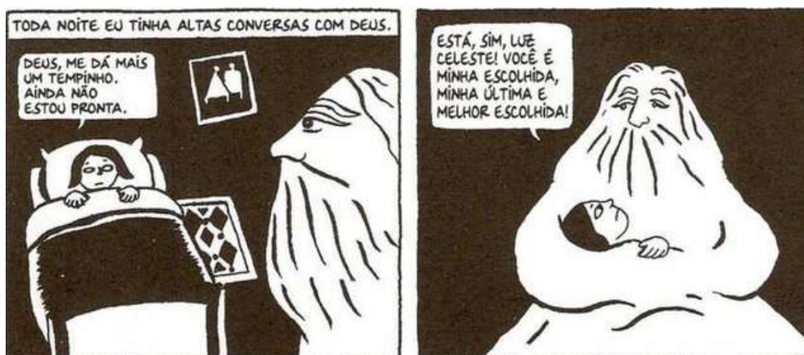
Figura 16 - O amigo de Marji

Fonte: Persépolis (2007), Marjane Satrapi