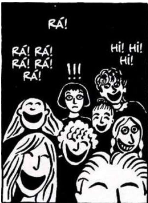
Figura 34- Marjane não fala o idioma

Fonte: Persépolis (2007), Marjane Satrapi