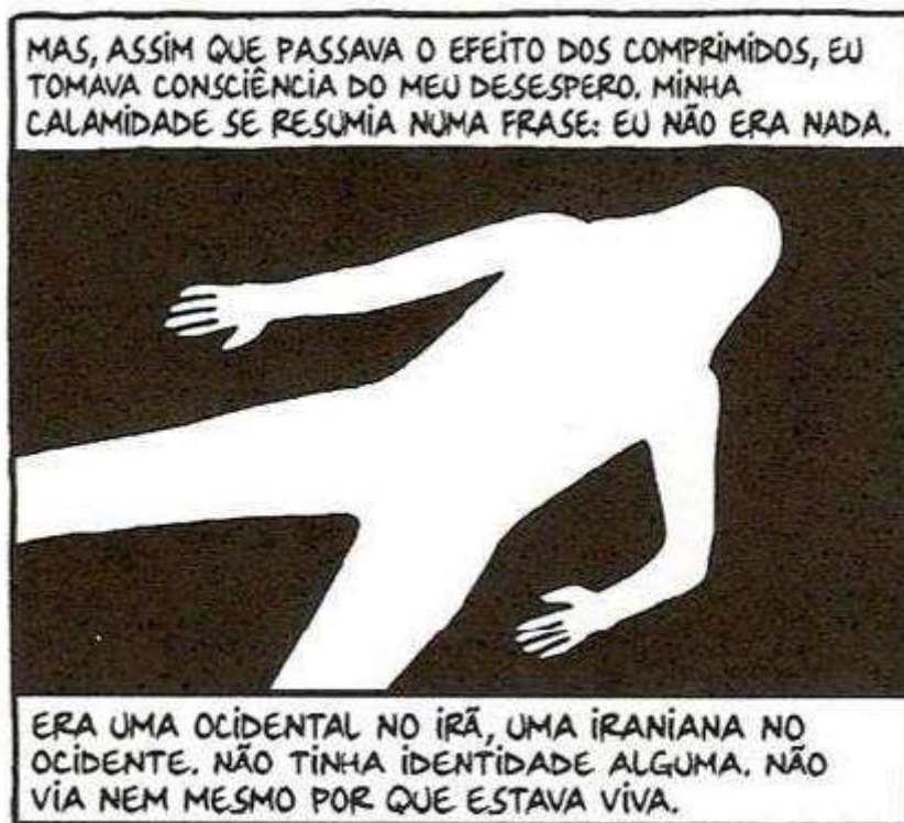
Figura 44- Não sou nada

Fonte: Persépolis (2007), Marjane Satrapi