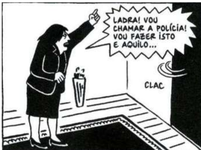
Figura 30 - Marji deixa a casa onde morava

Fonte: Persépolis (2007), Marjane Satrapi