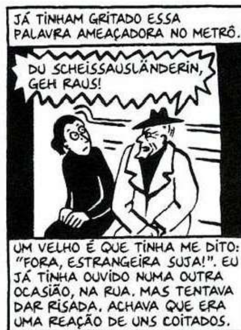
Figura 38 - "Estrangeira suja"

Fonte: Persépolis (2007), Marjane Satrapi