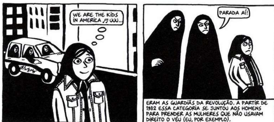
Figura 19 - As guardiãs da revolução

Fonte: Persépolis (2007), Marjane Satrapi