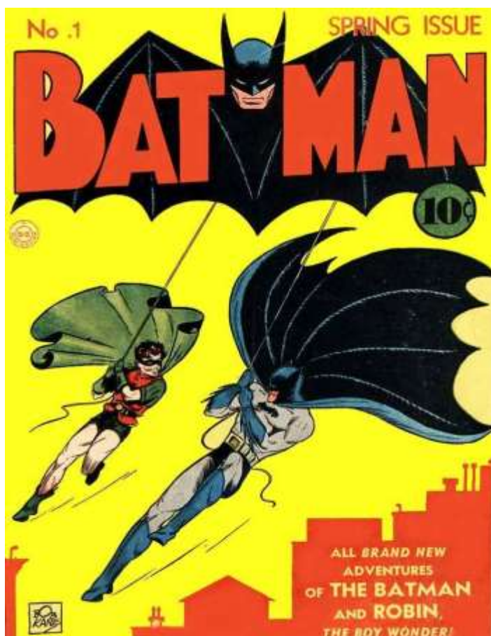
Figura 3 - Quadrinho do Batman

O autor não estende seu argumento sobre a extrapolação histórica e como ela se daria. Ele adentra, logo em seguida, a outro ponto importante sobre a gênese dos quadrinhos, o fato da comicidade destes terem o acompanhado desde o princípio: “For the first comics were above all intended to be funny” 2 (p.13). Isso nos leva ao começo, novamente, aos quadrinhos terem sua filiação ao público infantil.