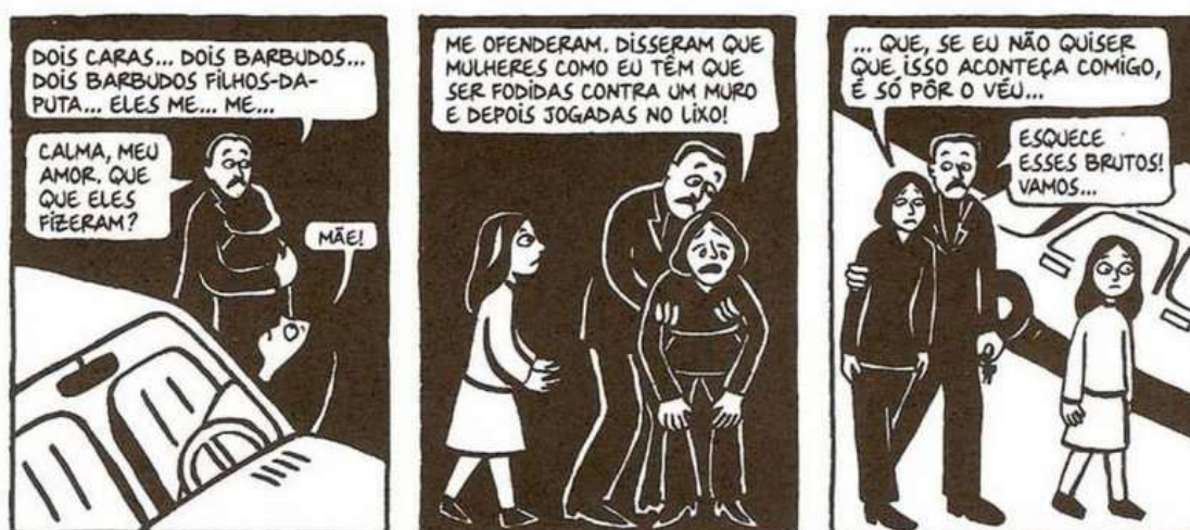
Figura 18 - Taji sofre violência