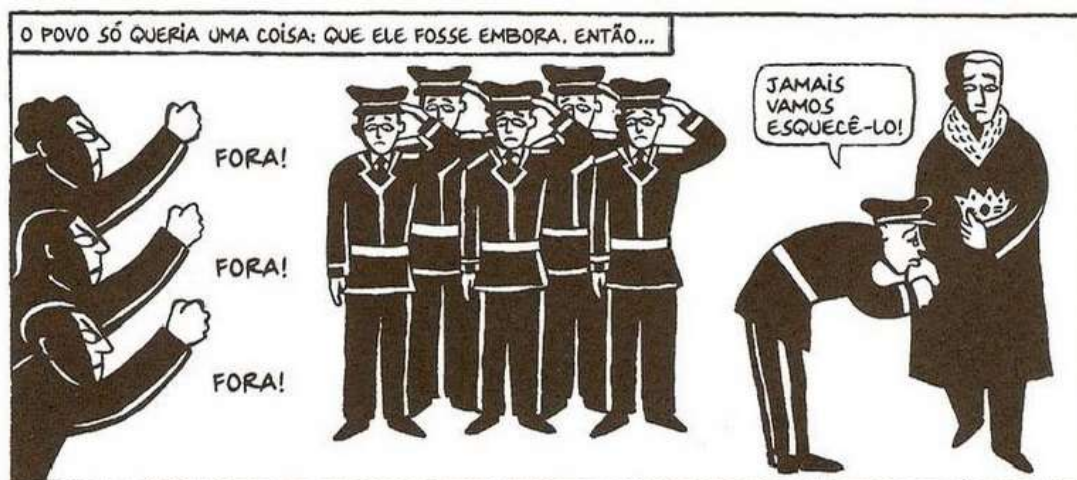
Figura 12 - A despedida de Reza

Fonte: Persépolis (2007), Marjane Satrapi