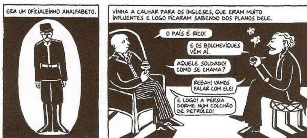
Figura 11 - As negociações europeias

Fonte: Persépolis (2007), Marjane Satrapi