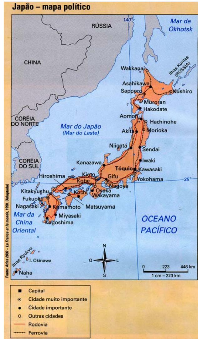
Mapa 3 – Mapa político do Japão, com suas principais cidades