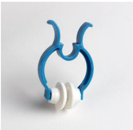
Figura 2: Clipe nasal usado no presente estudo.