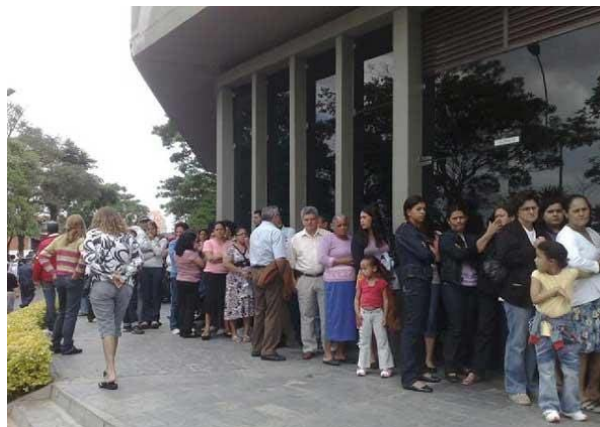
Figura 4 – Fila durante velório de Eloá.

como verdadeiros mártires, pois, como nos coloca Baitello (2005, p. 16), “os símbolos necessitam de imagens que os possam representar”.