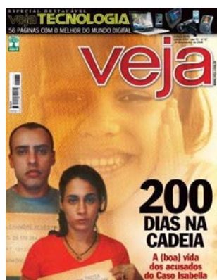
Figura 2 – Caso Isabela Nardoni Fonte: Capa da Revista Veja de 26 de novembro de 2008

trabalhar, os demais podem escolher; assim, somente após o julgamento é que sua rotina deve mudar. Alexandre nunca trabalhou e não participa dos diversos cursos e oficinas oferecidos no presídio, também não interage com os demais presos em jogos e atividades. Como seu pai leva comida suficiente para a semana, não apenas para ele como também para os 4 demais detentos que dividem a sela com ele, em muitas vezes ele dispensa a refeição servida pela instituição (Revista Veja 26 de novembro de 2008, p. 93-94).