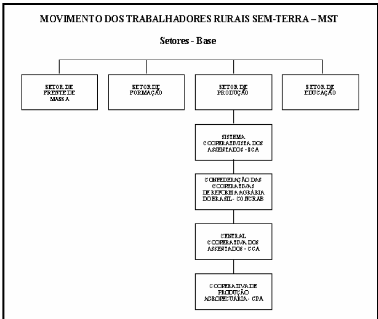
Figura 1 – Estrutura organizacional do MS

seu conteúdo, os elementos básicos para a organização das cooperativas, tanto dos aspectos ligados às relações humanas, como das estratégias de desenvolvimento econômico. O fortalecimento das cooperativas era visto pelo MST como resultado da estruturação de um sistema gerencial nacionalmente constituído, baseado em fundamentos teóricos que orientaram toda sua organização. A estrutura organizacional constituída pode ser compreendida pela orientação básica do MST, que entendia o assentamento como espaço de resistência e continuidade da luta pela terra.