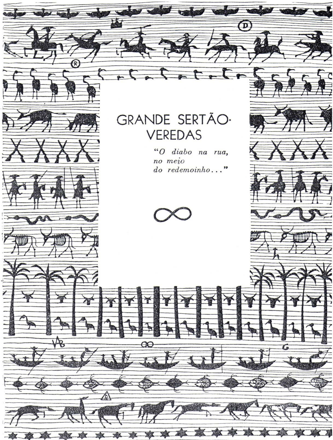
Figura 3 – Lemniscata no início de Grande sertão: veredas