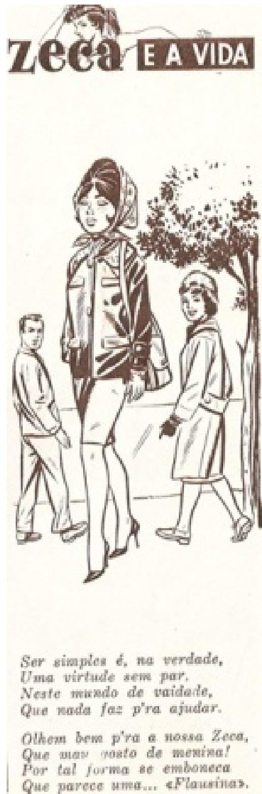
Figura 6 – Caricatura de uma “Flausina”