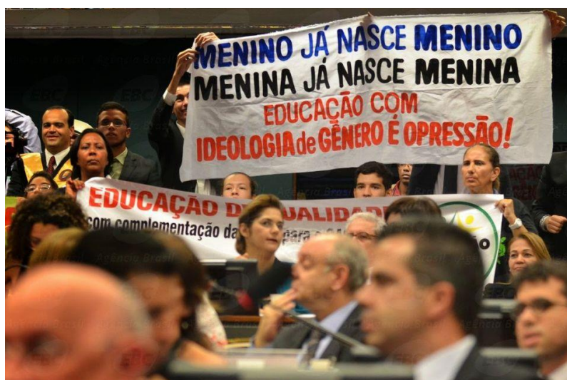
ILUSTRAÇÃO 3 – “Menino já nasce menino, menina já nasce menina”

as referências ao gênero e a sexualidade do Plano Nacional de Educação 2014 podem ser observadas nas imagens abaixo. Tratam-se de faixas levadas por manifestantes partidários do antifeminismo à Câmara dos Deputados, durante o processo de aprovação do PNE 2014.