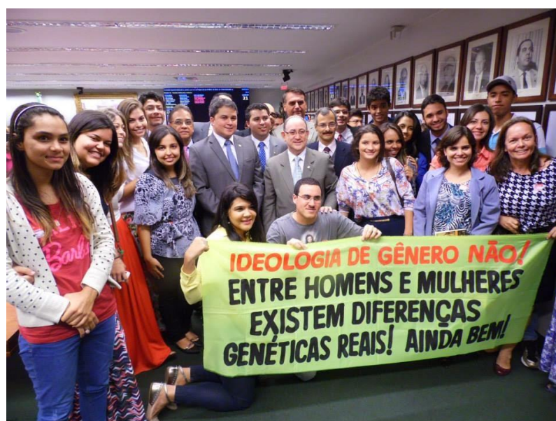
ILUSTRAÇÃO 4 – “Entre homens e mulheres existem diferenças genéticas reais”

Fonte: Fabiano Marta Tobias – Bloqueros com el Papa