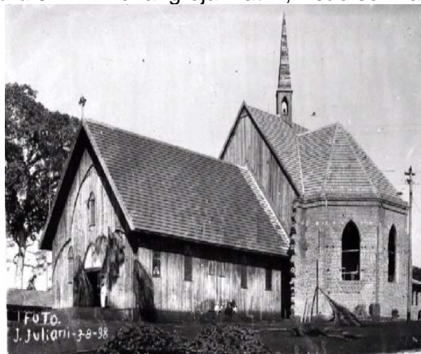
Figura 6 – Primeira Igreja Matriz, visão semilateral

Nota: Trabalho escolar: Vídeo 3 – A Catedral de Londrina