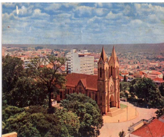
Figura 8 – Segunda Igreja Matriz Londrina

Nota: Trabalho escolar: Video 3 – A Catedral de Londrina