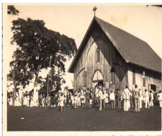
Figura 7 – Primeira Igreja Matriz Londrina

Nota: Trabalho escolar: Vídeo 3 – A primeira igreja de Londrina, erigida no mesmo local da atual Catedral Metropolitana