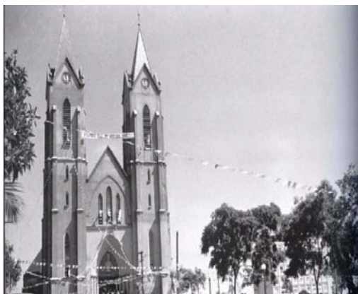
Figura 2 – Segunda Igreja Matriz de Londrina

Nota: Trabalho escolar: Vídeo 3 – Imagem do segundo prédio da Catedral de Londrina.