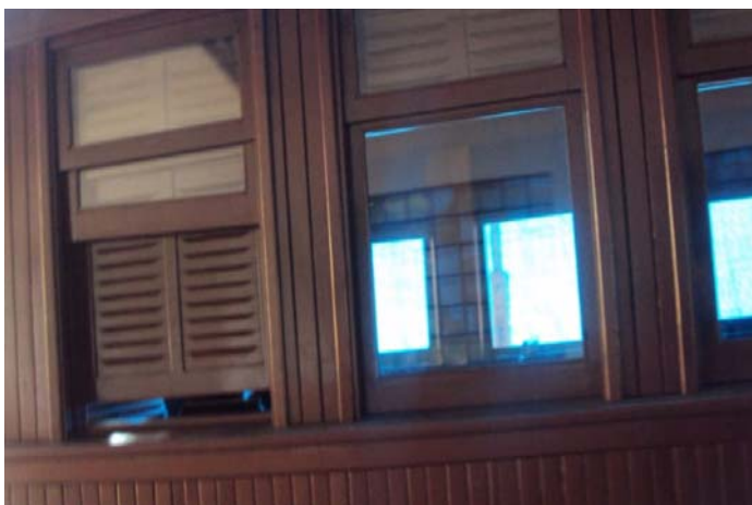
Tela 7 – Foto da janela do vagão – externa