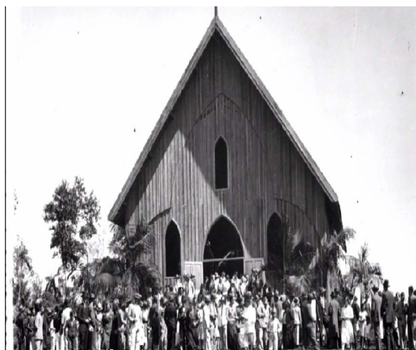
Figura 5 – Primeira Igreja Matriz de Londrina

Nota: Trabalho escolar: Vídeo 3 – A primeira igreja de Londrina, erigida no mesmo local da atual Catedral Metropolitana.