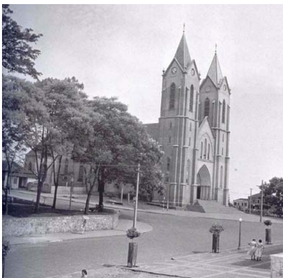
Figura 4 – Segunda Igreja Matriz de Londrina, visão semilateral

Nota: Trabalho escolar: Vídeo 3 – A Catedral de Londrina Foto Estrela.