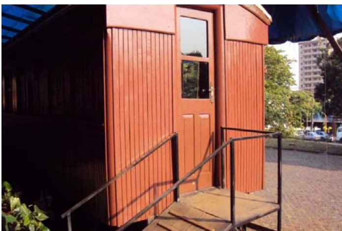
Tela 4 – foto mostrando o vagão do trem - 12/09/2012