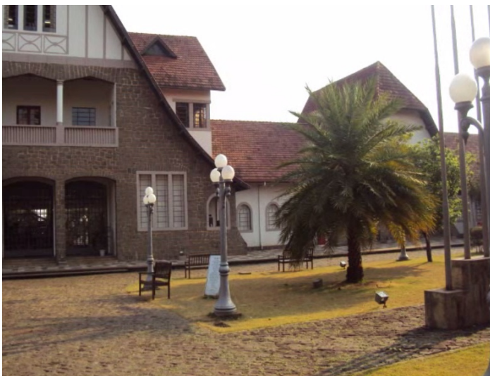
Tela 3 – Visão semilateral do Prédio do Museu