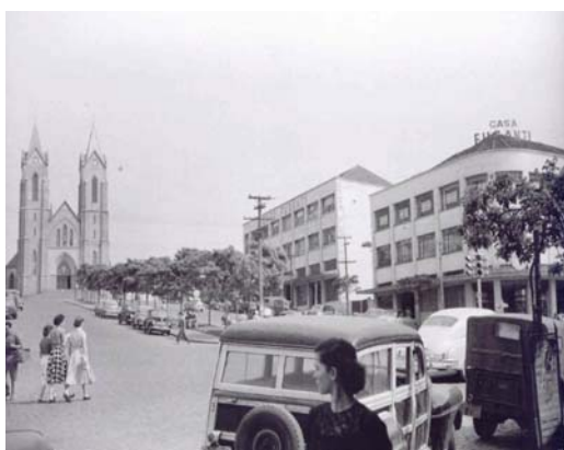
Figura 3 – Segunda Igreja Matriz de Londrina

Nota: Trabalho escolar: Vídeo 3 – A Catedral de Londrina - Esquina da Alameda Miguel Blasi com a Avenida Souza Naves, mostrando ao fundo a segunda Igreja Matriz.