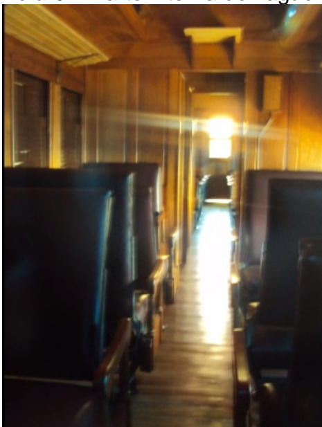
Tela 6 – Parte interna do vagão