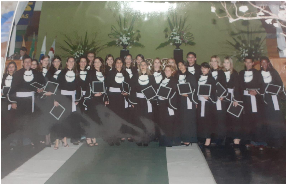
Figura 9 - Foto com a turma de graduação do curso de Letras