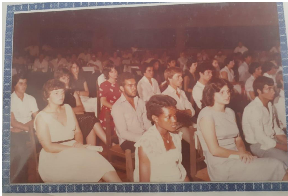
Figura 7 - Formatura de Magistério