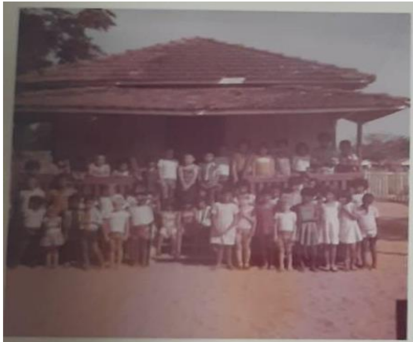
Figura 10 - Foto dos alunos da professora Aurora em frente à entrada da escola da fazenda Fartura