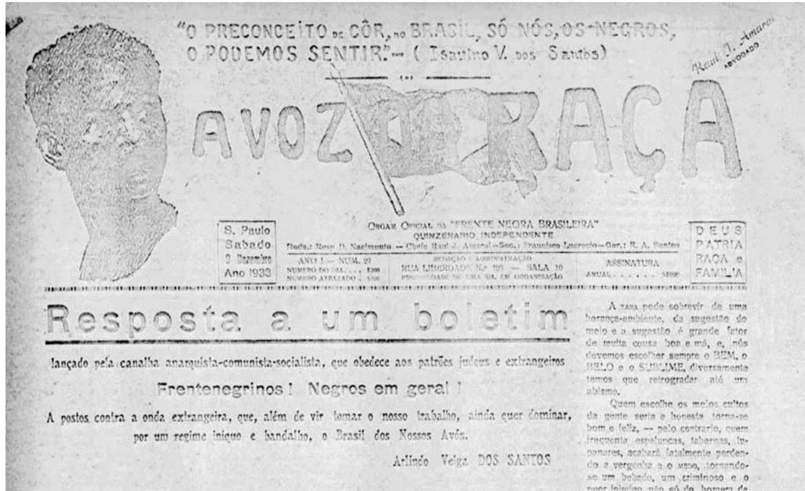
Figura 1 - Capa do jornal A Voz da Raça

Fonte: Hemeroteca Digital Brasileira (2023)