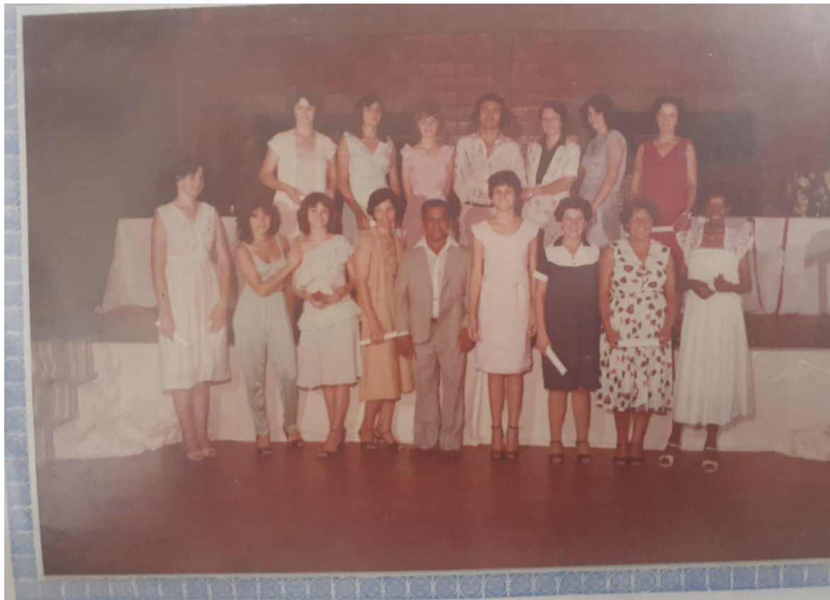
Figura 8 - Turma de Magistério