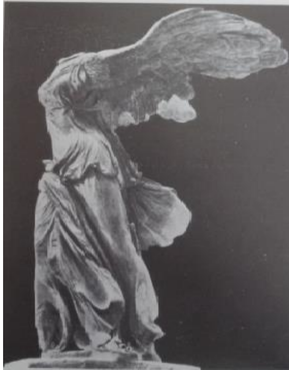
Figura 1: Victoria. Grécia, aproximadamente 200 a.C. Paris, Louvre

A partir de então, até meados do século V, a imagem do anjo segue sem grandes modificações visuais (SAXL, 1989). Assim, para resumir a história das imagens aladas angelicais,