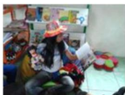
Contação de História