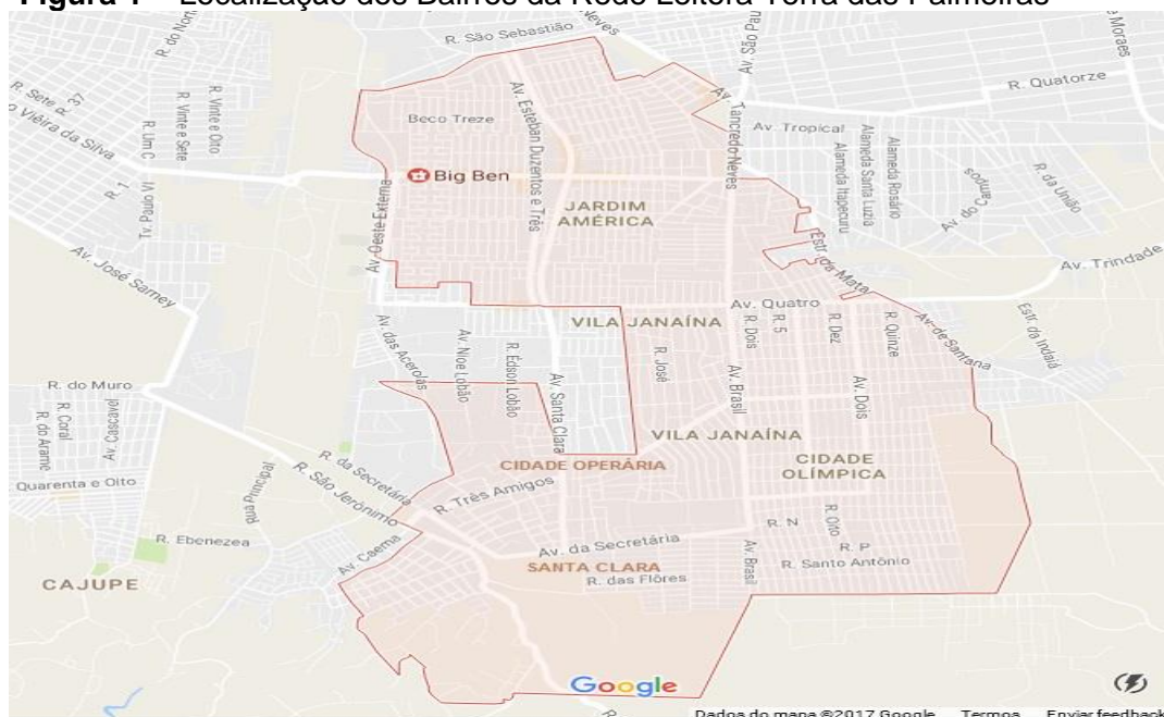
Figura 1 – Localização dos Bairros da Rede Leitora Terra das Palmeiras

As bibliotecas da Rede Leitora Terra das Palmeiras estão localizadas nos bairros periféricos da cidade de São Luís: Cidade Operária, Cidade Olímpica, Vila Janaina e Santa Clara, como ilustra a Figura 1.