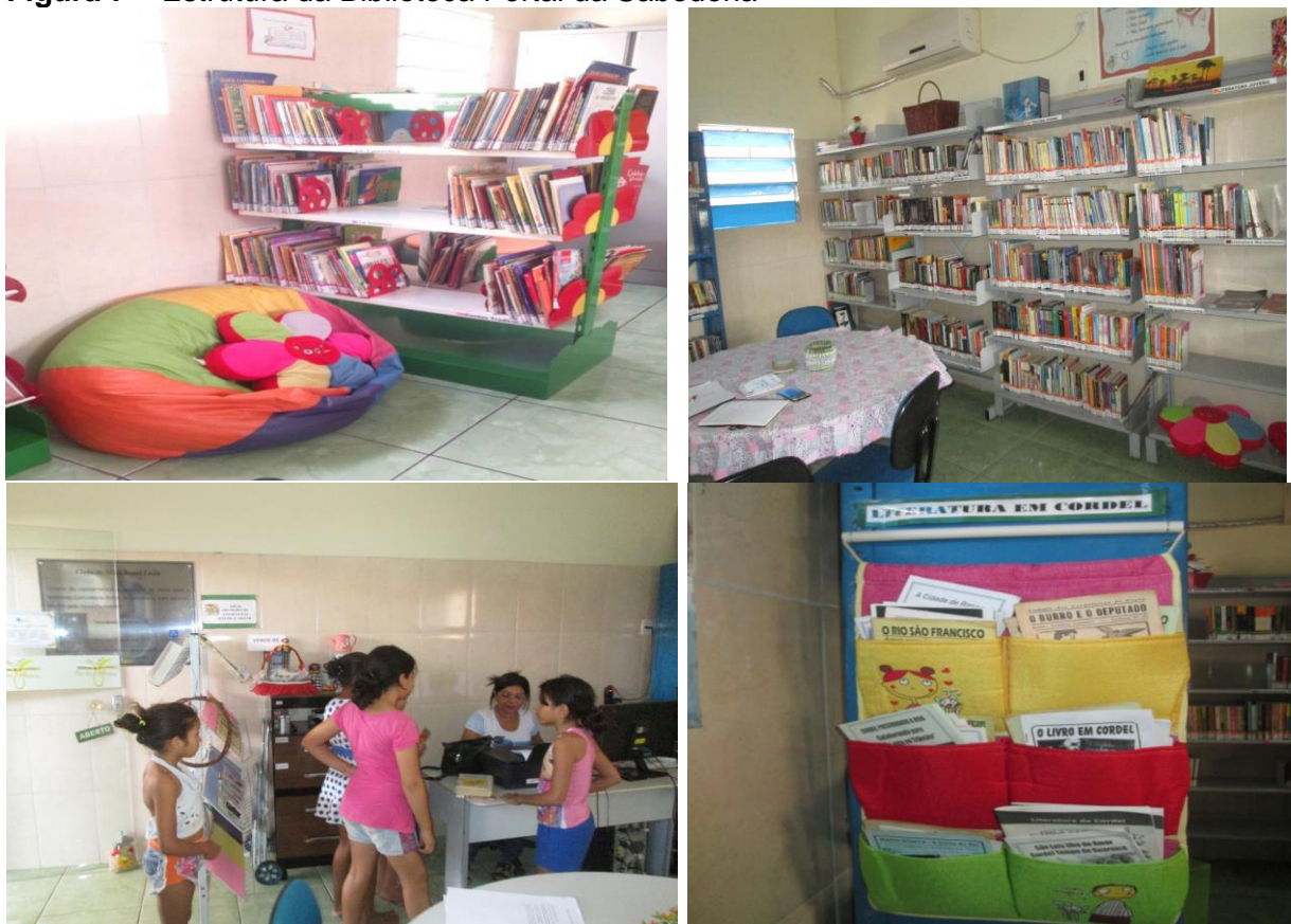
Figura 7 – Estrutura da Biblioteca Portal da Sabedoria