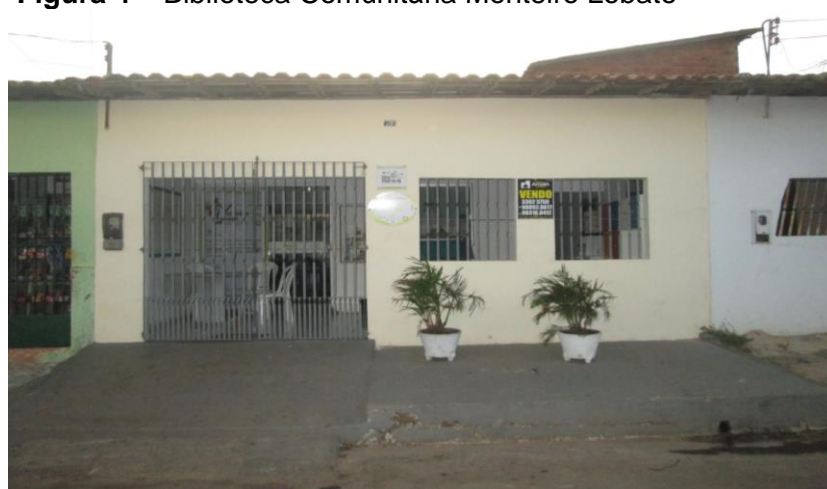
Figura 4 – Biblioteca Comunitária Monteiro Lobato

O fortalecimento das ações do Espaço de Leitura Monteiro Lobato necessitou de recursos, levando a equipe do Instituto Mariana a escrever o Projeto Palco das Letras para concorrer ao edital do Projeto Criança Esperança em 2011, sendo executado em 2012 e renovado em 2013. O mesmo Projeto foi encaminhado ao Instituto C&A para concorrer ao edital para ações conjuntas de incentivo à leitura e aprovado propondo a junção com outras quatro bibliotecas da região, formando em 2012 a Rede Leitora Terra das Palmeiras.