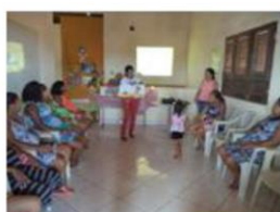
Projeto Ler pra mim! Mediação para Gestantes