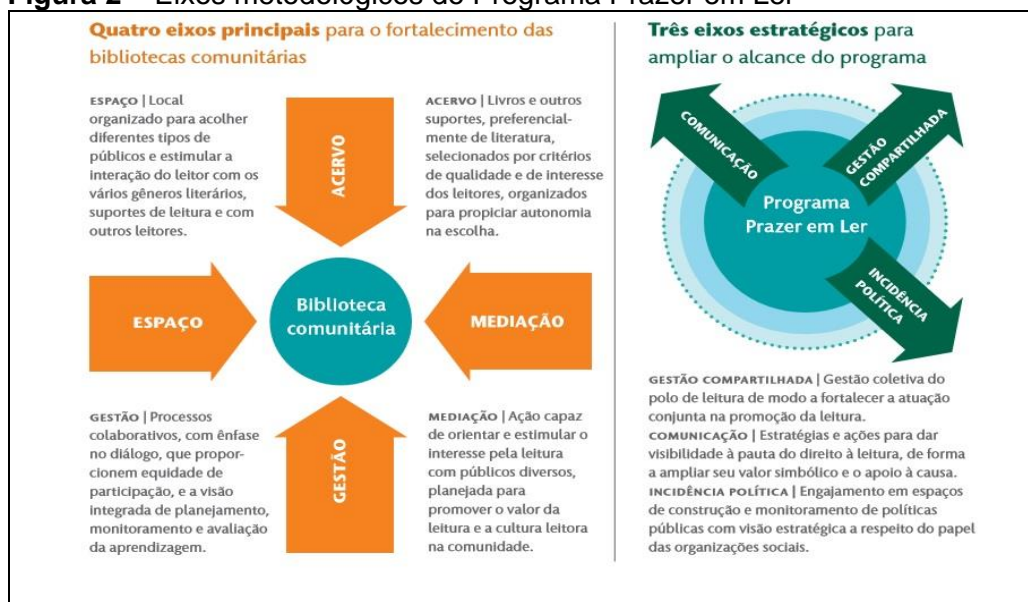
Figura 2 – Eixos metodológicos do Programa Prazer em Ler

O Programa atua em quatro eixos metodológicos para fortalecer as bibliotecas comunitárias e três eixos estratégicos para ampliar o seu alcance conforme ilustrado na Figura 2.