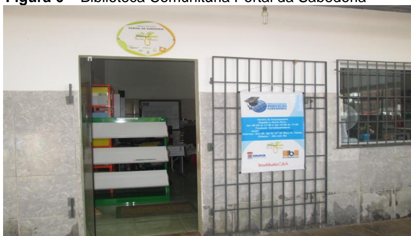
Figura 6 – Biblioteca Comunitária Portal da Sabedoria

A biblioteca comunitária Portal da Sabedoria está localizada no bairro da Cidade Olímpica nas dependências do Colégio Nossa Senhora da Conceição mantido pelo Clube de Mães Santa Luzia . A iniciativa de criar um espaço de leitura na escola surgiu após uma reunião com representantes de diversas instituições dentre elas a Associação de Educação Católica do Maranhão (AEC/MA), Banco Nacional de Desenvolvimento Econômico e Social (BNDES), Associação de Educação Católica do Brasil (AEC/Brasil).