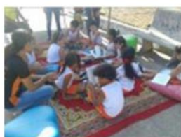
Lendo na Praça