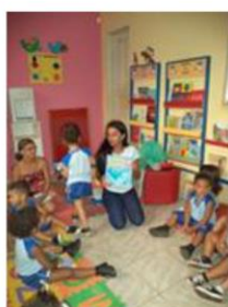
Mediação para Bebês