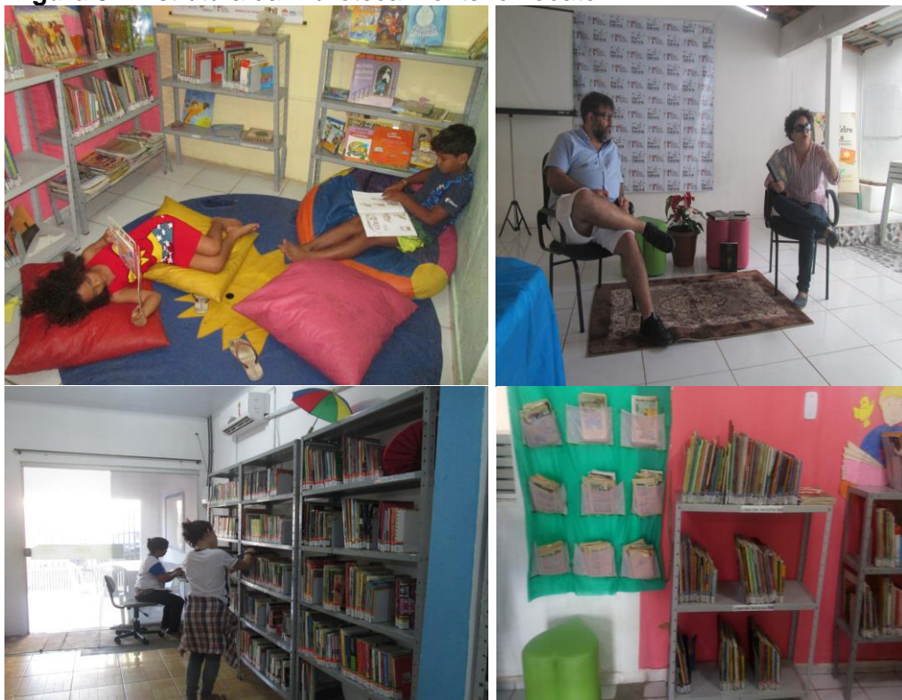
Figura 5 – Estrutura da Biblioteca Monteiro Lobato

A Biblioteca Comunitária Monteiro Lobato atualmente promove o acesso à leitura por meio de mediações periódicas internas e externas visando tornar-se referência no apoio ao desenvolvimento literário em âmbito municipal, estadual e nacional.