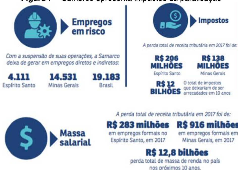
Figura 7 – Samarco apresenta impactos da paralisação