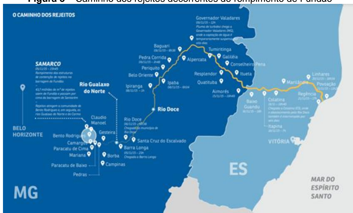
Figura 3 – Caminho dos rejeitos decorrentes do rompimento de Fundão