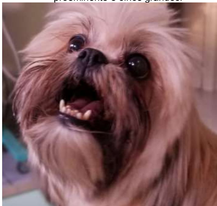
Figura 1- Características da braquicefalia em um Shih Tzu, evidenciando o focinho curto, cabeça larga, mandíbula proeminente e olhos grandes.

Segundo a Federação Internacional de Cinofilia – FCI (2017), dentre as características da raça Shih Tzu, destacam-se a cabeça larga e arredondada, olhos grandes, focinho curto e maxilar apresentando prognatismo. Algumas dessas características são maléficas aos cães, como no caso da Síndrome do cão braquicefálico, que envolve doenças respiratórias e oculares resultantes do achatamento craniano (SERPELL, 2002). As afecções oftalmológicas mais comuns da raça como o prolapso de terceira pálpebra, ceratite crônica, úlcera de córnea, atrofia progressiva e deslocamento de retina (CHRISTMAS, 1992).