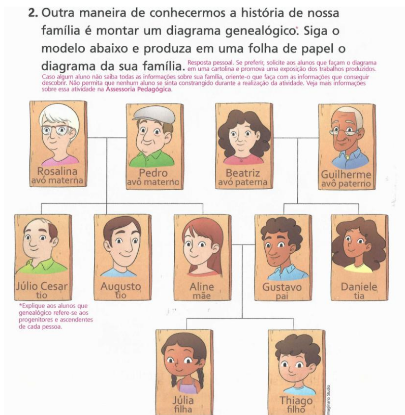
Figura 19 – Proposta de atividade (Árvore Genealógica)

Outras propostas de atividade apresentadas nas obras, que têm uma finalidade positiva na construção da noção de família própria a cada criança, são a construção de Árvores Genealógicas. Elas possibilitam que o aluno reflita sobre si e sobre sua família e esquematize os dados hierarquicamente e em cronologia histórica.