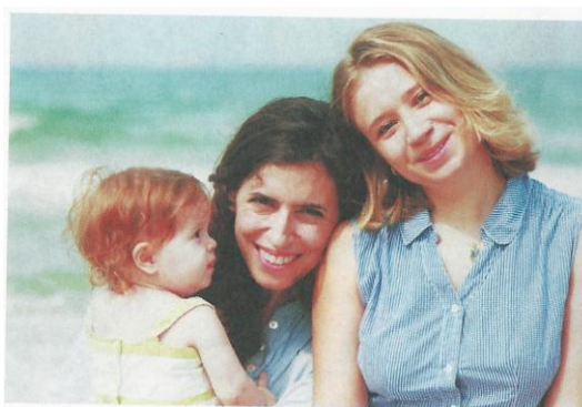
Figura 10 – Família composta por duas mães e um filho.