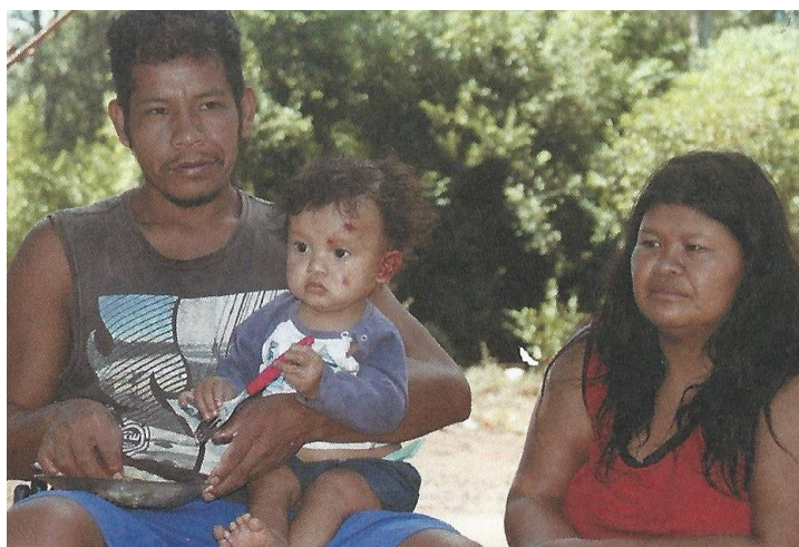
Figura 7 – Família indígena