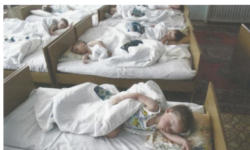
Figura 12 – Crianças em um orfanato