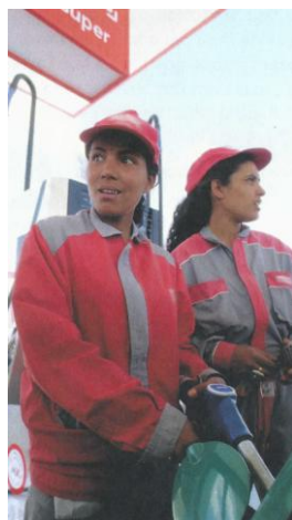
Figura 3 – Mulher trabalhando no posto de gasolina