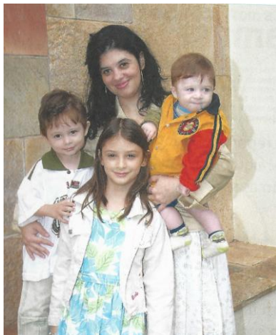
Figura15 – Família composta por mãe e filhos