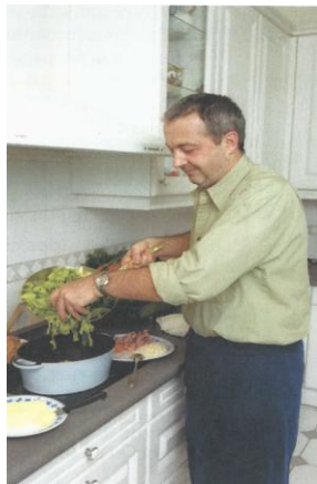
Figura 2 – Homem cozinhando

das relações sociais humanas em que histórica e sociologicamente são importantes de serem debatidas e dialogadas com as crianças.