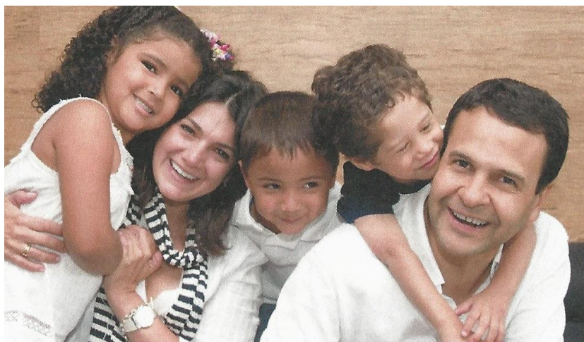
Figura 6 – Família composta por casal com filhos