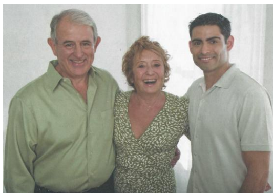
Figura 11 – Casal com filho adotado

“Viver em família é um direito de toda criança. De acordo com a Declaração Universal dos Direitos da Criança, todos tem o direito de viver com sua família. Sempre que isso não é possível, a sociedade e as autoridades têm a obrigação de proteger essas crianças. Muitas crianças vivem com suas famílias naturais, formadas por seus pais e irmãos. Em algumas famílias, os avós, tios e primos vivem juntos [...] Entretanto, nem todas as crianças vivem com suas famílias naturais. Há crianças que são adotadas e passam a viver em uma nova família” (Brasiliiana, 3º ano, p. 24 e 25).