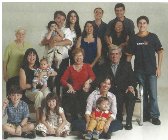
Figura 8 – Família Numerosa