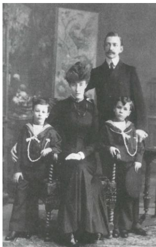
Figura 9 – Família Aristocrática do século XX