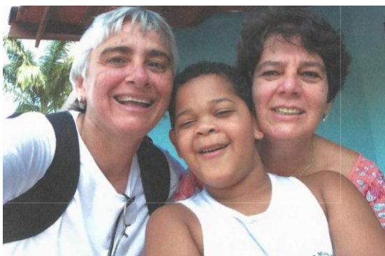
Figura 13 – Família composta por duas mães e um filho

Em decorrência disso, salientamos que, conforme discutido anteriormente, não aparecem em nenhum dos livros imagens de famílias homoafetivas compostas por dois pais com filhos, não garantindo alguma discussão a respeito. Nesse caso, o que não é visto, não é dito. Contudo, consideramos que os livros fazem, sim, um movimento de tentar ampliar as abordagens sobre família no sentido de contemplar a diversidade, mesmo porque temos legislações que precisam ser cumpridas minuciosamente no que diz respeito à elaboração do material que consta no livro didático.