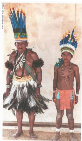
Figura 4 – Fotografia de Avô e Neto Indígena

As leis 10.639/2003 e 11.645/2008 35 asseguram e garantem que, no conteúdo programático das escolas, estejam inclusos o debate e o ensino sobre diversos aspectos dessas culturas que caracterizam a formação da população brasileira, e que sejam contemplados nas instituições de ensino. A presença dessas discussões nos livros didáticos tem ganhado mais visibilidade, porém ainda carece de aprofundamento para além do que está posto neles.