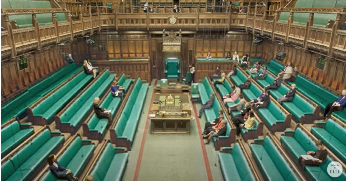
Figura 2 - Parlamento Inglês Campanha #MoreWomen