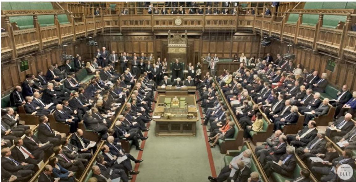
Figura 1 - Campanha #MoreWomen

A alteração das imagens associada à oposição que se tem uma sobre a outra não nos revela nada de novo, tendo em vista que o problema da representatividade feminina já é de nosso conhecimento, mas escancara de maneira didática as consequências prejudiciais para as mulheres da divisão sexual em função do gênero na sociedade do século XXI. As imagens indicam o baixo número de mulheres que participam da esfera pública, assumindo funções de visibilidade e poder. Ao mesmo tempo demonstra como nos encontramos “isoladas” nesse cenário, sentimento também sinalizado com a proposta do vídeo.